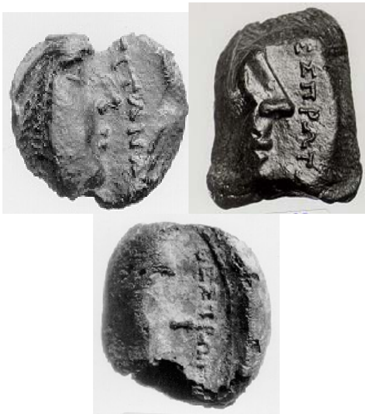
Εικ. 11. Σφραγίσματα με γυναικείες κεφαλές και τις επιγραφές ΓΙΤΑΝΑ και ΘΕΣΠΙΡΩΤΩΝ (από αριστερά)

Προτείνεται , επίσης η σχεδιαστική αναπαράσταση της στέγης, με την πήλινη κεράμωση, του Πρυτανείου, αλλά και της πρόσοψης του κτιρίου με τα δύο μνημειακά πρόπυλα. Τα τρεις χιλιάδες (3000) πήλινα σφραγίσματα, που προέκυψαν από την έρευνα του Πρυτανείου, κυρίως από το λεγόμενο δωμάτιο του Αρχείου, συγκροτούν το μοναδικό -μέχρι σήμερα- δημόσιο αρχείο μίας αρχαιοελληνικής πόλης. Τα σφραγίσματα, το «βουλοκέρι» με το οποίο σφραγιζόταν η αλληλογραφία της εποχής, εξασφαλίζοντας το απόρρητο, αλλά και την αξιοπιστία του αποστολέα της, φέρουν παραστάσεις νομισματικών τύπων της Ηπείρου ή άλλων περιοχών, αγαλματικούς τύπους, μυθολογικές παραστάσεις και διάφορες άλλες απεικονίσεις.