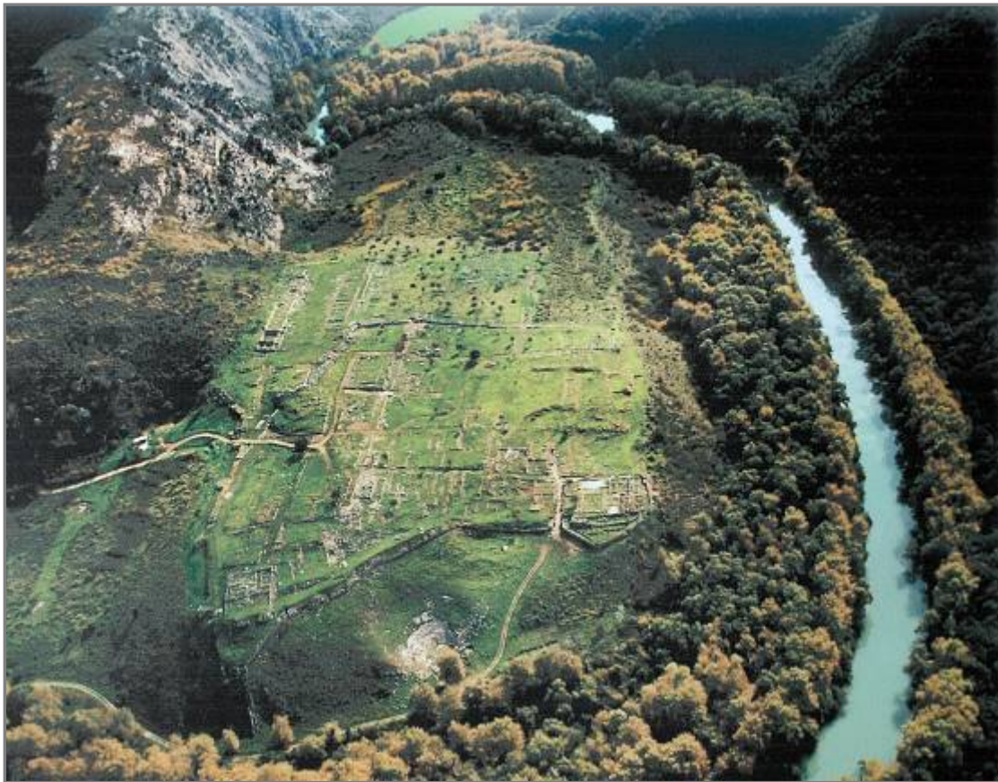
Εικ. 1. Γίτανα. Αεροφωτογραφία της αρχαίας πόλης

Βορειοδυτικά του σημερινού Νομού της Θεσπρωτίας, σε μία περιοχή η οποία κατά την αρχαιότητα ανήκε στη χαονική, αρχικά, και θεσπρωτική 1 από τον 4 ο αι. π.Χ., Κεστρίνη (ή αλλιώς Καμμανιά 2 ), είναι ορατά τα ερείπια αρχαίας τειχισμένης πόλης 3 , γνωστής με το όνομα Γκούμανη. Η πόλη είναι χτισμένη σε διάφορα επίπεδα -που κυμαίνονται από 30 έως 183 μέτρα πάνω από την επιφάνεια της θάλασσας- στη νοτιοδυτική πλαγιά του γυψολιθικού βουνού Βρυσέλλα, στη δεξιά όχθη του ποταμού Καλαμά (αρχ. Θύαμης), κοντά στη συμβολή του με τον Καλπακιώτικο χείμαρρο.