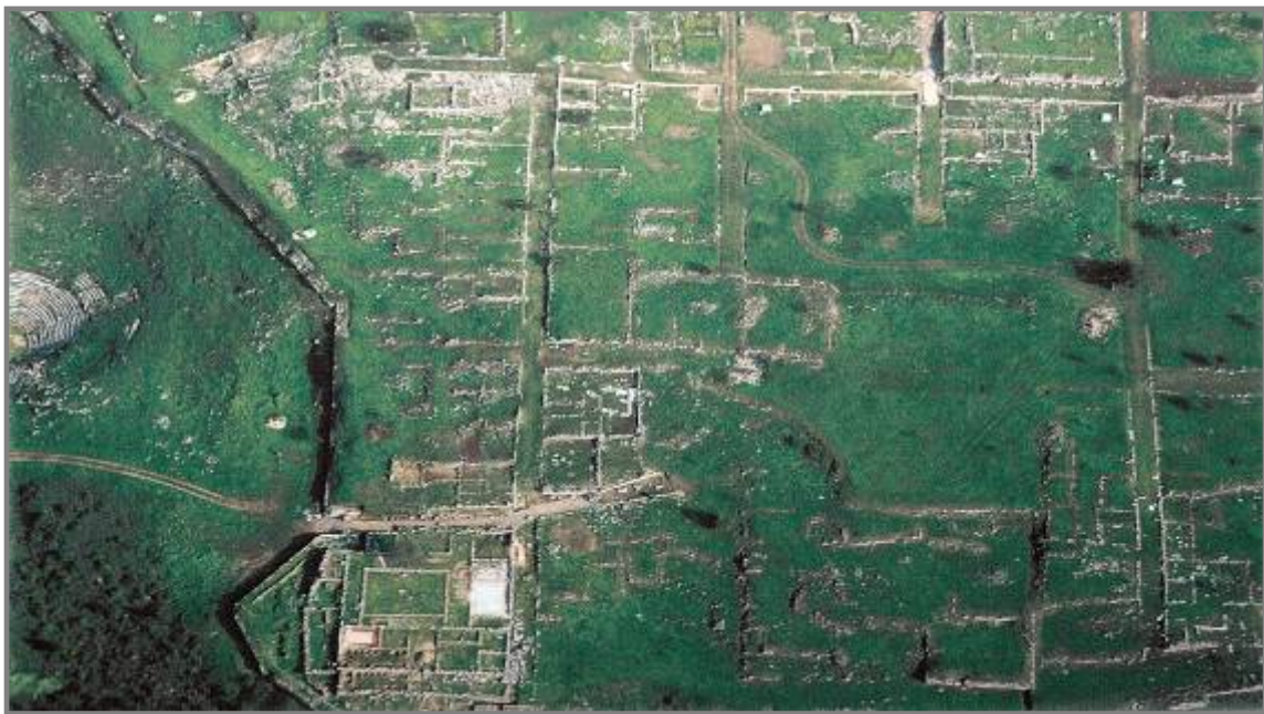
Εικ. 2. Το πολεοδομικό σύστημα στο νοτιοδυτικό τμήμα της πόλης

Η εντός των τειχών πόλη, ακολουθώντας τη φυσική διαμόρφωση του εδάφους, αναπτύχθηκε σε διαφορετικά άνδηρα, ενώ ένα ισχυρό εσωτερικό τείχος -διατείχισμα-, μήκους 3.15μ., με κατεύθυνση περίπου Α-Δ, τη διαχωρίζει σε δύο μεγάλους τομείς. Στον εκτεταμένο δυτικό τομέα αναπτυσσόταν μεγάλο μέρος της δημόσιας και θρησκευτικής ζωής, ενώ στον ανατολικό κυρίαρχη θέση καταλαμβάνει η Αγορά.