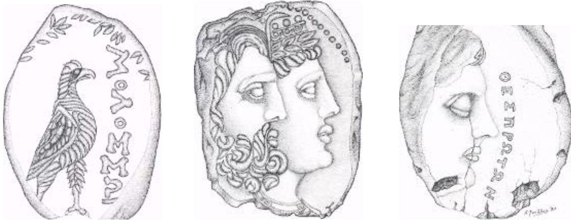
Σχέδιο 7. Σφραγίσματα με αετό και την επιγραφή ΜΟΛΟΣΣΩΝ, με κεφαλές Δωδωναίου Δία και Διώνης και με γυναικεία κεφαλή και την επιγραφή ΘΕΣΠΡΩΤΩΝ (από αριστερά)

Συμπληρωματικές ανασκαφικές εργασίες, προς ολοκλήρωση της έρευνας του μνημείου, απαιτούνται επίσης στο Κτίριο Στ. Η ανεύρεση μικρών υποστατών και σφηνών, στον εν λόγω χώρο, σε συνδυασμό με την υπόλοιπη κεραμική του κτιρίου παραπέμπει σε αποθηκευτική ή εργαστηριακή χρήση, η οποία θα πρέπει να συσχετισθεί με το παρακείμενο εργαστηριακό συγκρότημα εφαπτόμενα στο Πρυτανείο.