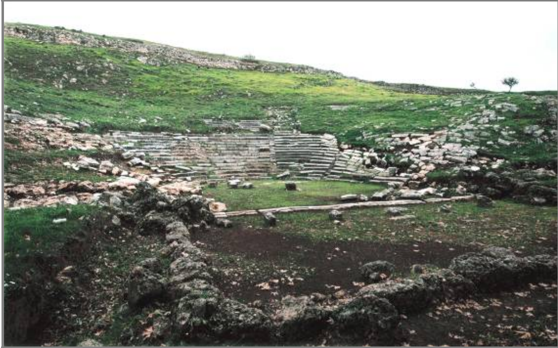
Εικ. 9. Το Θέατρο

επιπλέον, συντήρηση της επιφάνειας των εδωλίων στην οποία έχουν χαραχτεί τα ανθρωπωνύμια, ώστε να καταστεί δυνατή η δημιουργία εκμαγείων και εν συνεχεία ο σχεδιασμός των επιγραφών. Θα ακολουθήσει η αρχιτεκτονική μελέτη του μνημείου, προκειμένου να γίνει αναπαράσταση του σκηνικού του οικοδομήματος.