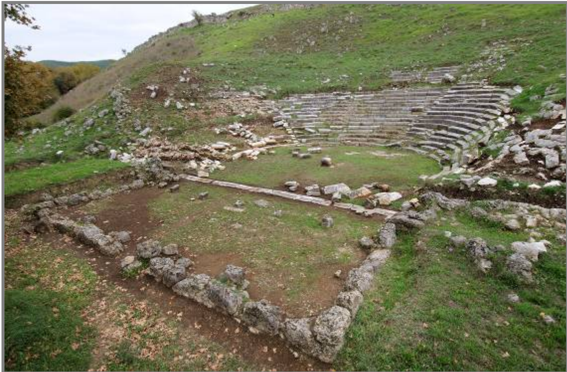
Εικ. 8. Το Θέατρο

Το κοίλο, κατασκευασμένο σε βραχώδη πλαγιά, έχει σχήμα μικρότερο του ημικυκλίου, όπως το μικρό θέατρο της Κασσώπης, με μέγιστη διάμετρο 65,00μ. και ελάχιστη 24,00μ. και ύψος 10,00μ. Ένα διάζωμα το διακρίνει σε δύο τμήματα, ενώ τέσσερις κλίμακες το διαιρούν σε πέντε κερκίδες, στις οποίες θα πρέπει να προστεθούν δύο ακόμη που φαίνεται να υπήρχαν στα δύο άκρα, εκατέρωθεν, με 28 σειρές εδωλίων, στη θέση τους ή ελαφρώς μετατοπισμένα.