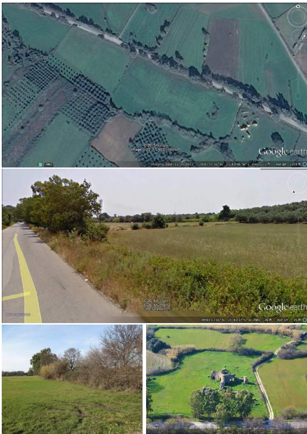
Εικόνα 2. Η θέση της Πρόσβασης Α. Αεροφωτογραφία και απόψεις της περιοχής χωροθέτησης.