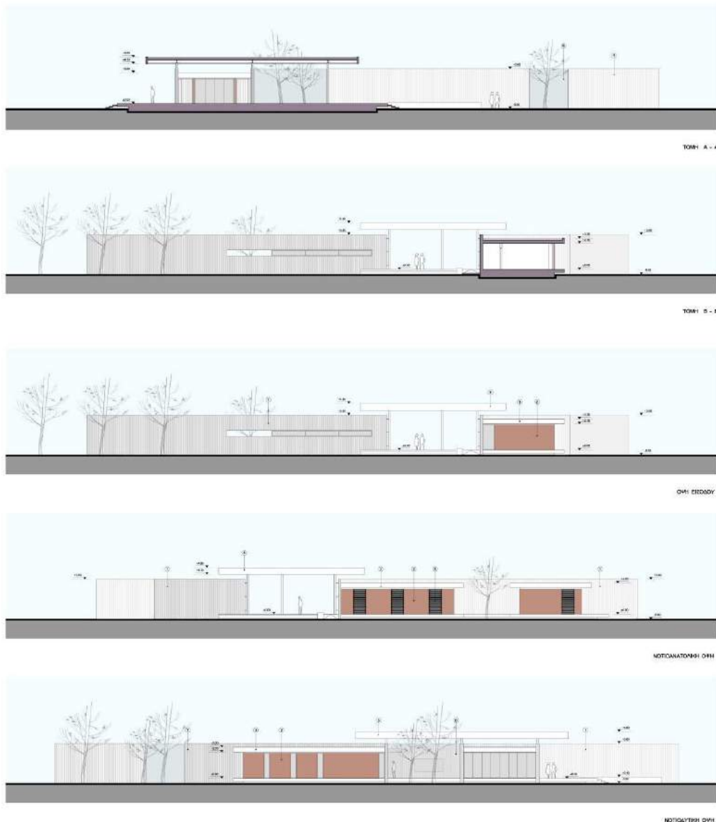
Εικόνα 6. Τομές και όψεις του κτιρίου της Πρόσβασης Α.