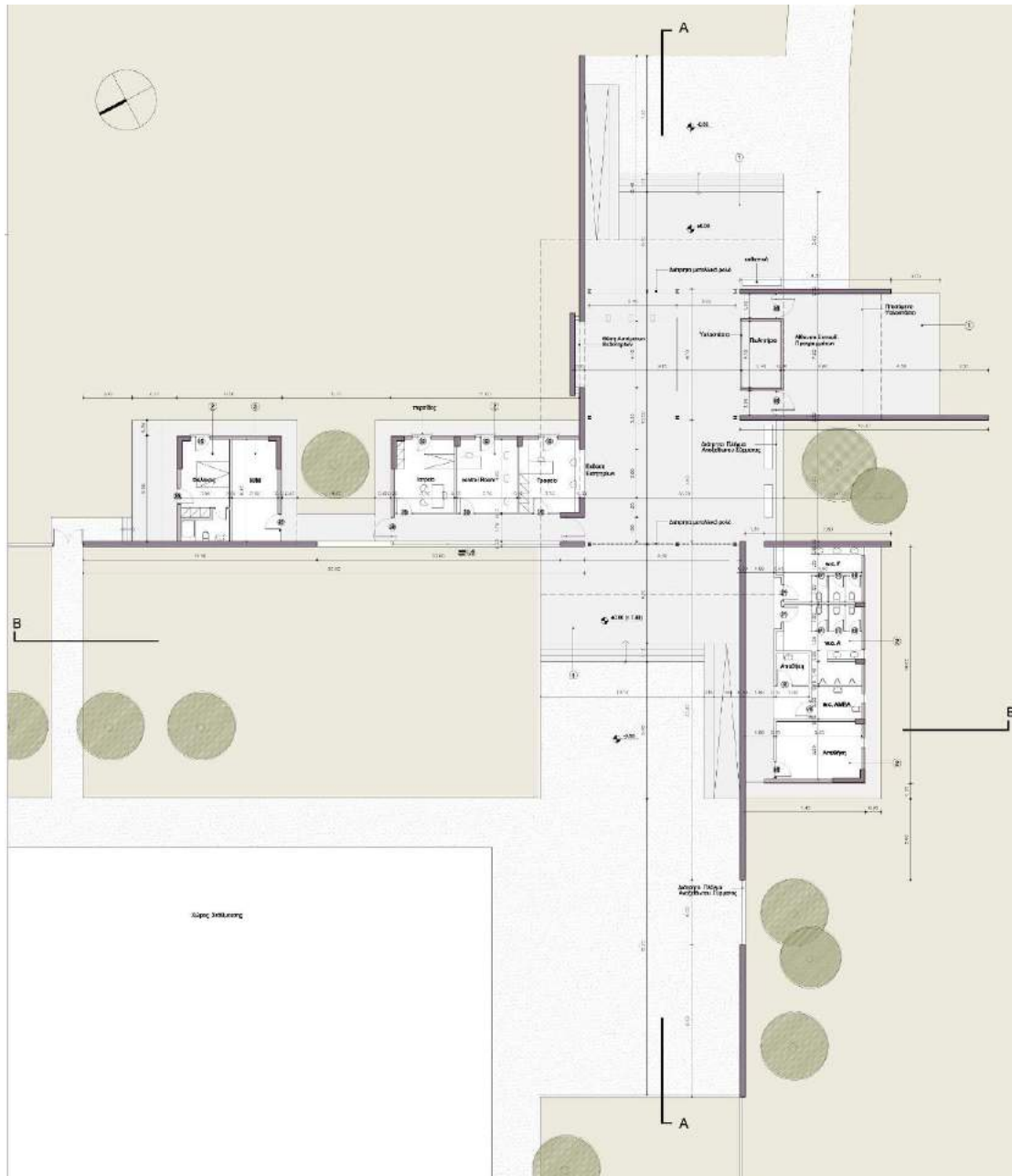
Εικόνα 4. Κτίριο Πρόσβασης Α. Κάτοψη.