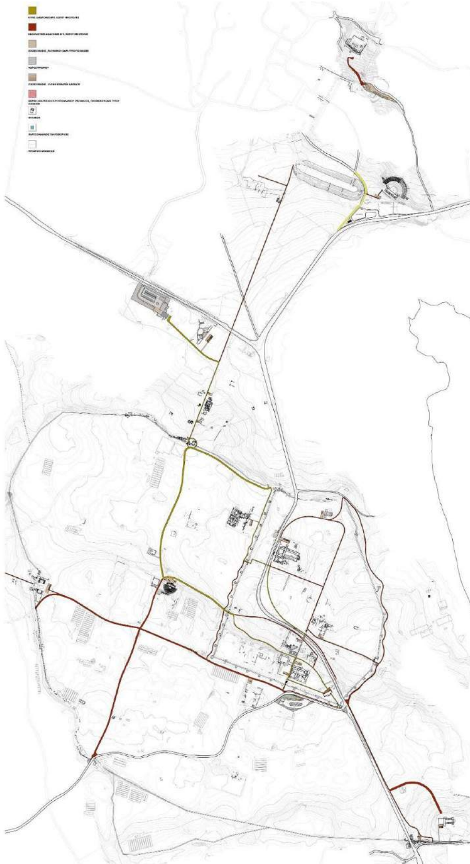
Εικόνα 1. Γενικό τοπογραφικό του αρχαιολογικού χώρου Νικόπολης με τις προτεινόμενες επεμβάσεις και διαμορφώσεις