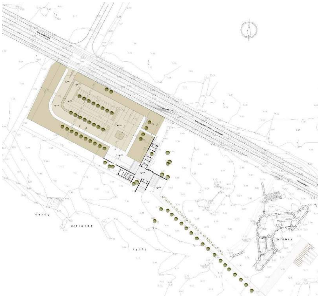
Εικόνα 3. Τοπογραφικό υπόβαθρο και διαμόρφωση της Πρόσβασης Α..

Η χωροθέτηση αυτή καταρχήν εξυπηρετεί την ασφαλή και σύμφωνα με τους συγκοινωνιακούς κανόνες πρόσβαση των τροχοφόρων οχημάτων στο χώρο στάθμευσης, που αναμένεται να κατασκευαστεί. Επιπλέον, το εν λόγω αγροτεμάχιο χαρακτηρίζεται από μία απόσταση ασφαλείας από το μνημείο των Βόρειων Θερμών (Μπεντένια), τόσο για αισθητικούς