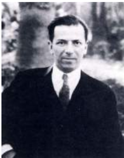
5. Ο Χρήστος Καρούζος, διευθυντής του Εθνικού Αρχαιολογικού Μουσείου.

Προεδρίας ενώπιον του Γενικού Επιθεωρητή Αρχαιοτήτων Ιωάννη Παπαδημητρίου, ο οποίος με τοποθέτησε στο Εθνικό Αρχαιολογικό Μουσείο.