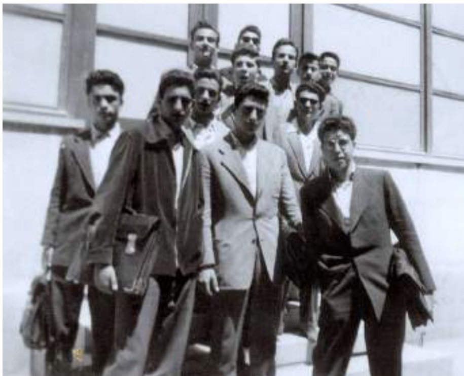
2β. Με συμμαθητές στην είσοδο του Πειραματικού Σχολείου Θεσσαλονίκης.

και τη φωνητική αξία των συλλαβικών συμβόλων της Γραμμικής Β γραφής, η οποία λίγο πριν είχε αποκρυπτογραφηθεί από τον Michael Ventris.