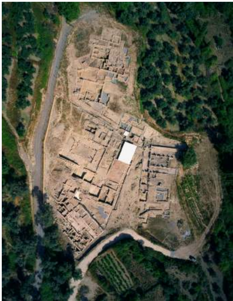
11α. Αεροφωτογραφία του αρχαιολογικού χώρου, Τομέας Ι της αρχαίας Ελεούθερνας.

Η συνεργασία και η αμοιβαία κατανόηση μεταξύ αρχαιολόγων και τοπικών κοινωνιών επιτυγχάνεται με απλοποίηση και μετάδοση του πολιτιστικού αγαθού (με διαλέξεις, ξεναγήσεις, ντοκιμαντέρ, δημοσιεύματα στον ημερήσιο τοπικό και αθηναϊκό τύπο, συζητήσεις σε δήμους, κοινότητες, σχολεία, τοπικές οργανώσεις, εκτύπωση και διανομή ενημερωτικών φυλλαδίων) καθώς και με τη συμμετοχή εθελοντών σε αποψιλώσεις και καθαρισμούς μνημείων και στην ανασκαφική διαδικασία με την επίβλεψη, φυσικά, και την καθοδήγηση έμπειρων αρχαιολόγων. Εφόσον αγωνιζόμαστε να καλλιεργηθούν αγαθές σχέσεις Κράτους-πολίτη όσον αφορά στην αντίληψη για την προστασία και την ανάδειξη της πολιτιστικής μας κληρονομιάς, είμαστε υποχρεωμένοι να επιδιώκουμε με κάθε δυνατό τρόπο την προσέγγιση των πολιτών προς αυτό το αγαθό, καθορίζοντας και τους όρους αυτής της προσέγγισης. Κερδίζει σήμερα συνεχώς έδαφος η αντίληψη ότι οι αρχαιολογικοί χώροι και τα μνημεία προστατεύονται και συντηρούνται αποτελεσματικότερα όταν αποτελούν μέρος της ζωής των πολιτών, όταν περιλαμβάνονται στη λεγόμενη οικονομία του ελεύθερου χρόνου και την δια βίου εκπαίδευση.