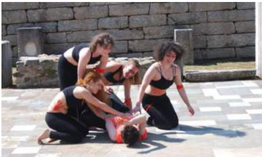
12β. Παράσταση αρχαίας τραγωδίας στο Εκκλησιαστήριο της αρχαίας Μεσσήνης από Σχολείο της Αγγλίας.

Η κοινωνικοποίηση των αρχαίων μνημείων, το άνοιγμά τους στο διεθνές κοινό με χρήσιμες συμβατές προς αυτές που είχαν στην αρχαιότητα και ταυτόχρονα το άνοιγμά τους στην σύγχρονη καλλιτεχνική δημιουργία, η συνύπαρξη στον ίδιο χώρο αρχαίων και σύγχρονων έργων τέχνης αποτελεί τεράστιο βήμα προόδου. Η αρχαία Μεσσήνη (η δωρική πόλη Μεσσήνη), πέρα από τις ποικίλες μορφές, υποστάσεις και λειτουργίες της, αποτελεί αυτή καθαυτή μια τρισδιάστατη δημιουργία που συνομιλεί με το φυσικό περιβάλλον και το παγκόσμιο κοινό που την επισκέπτεται, μια εξελισσόμενη δημιουργία που συγκροτείται σταδιακά από τα διάσπαρτα μέλη της, ζώ-