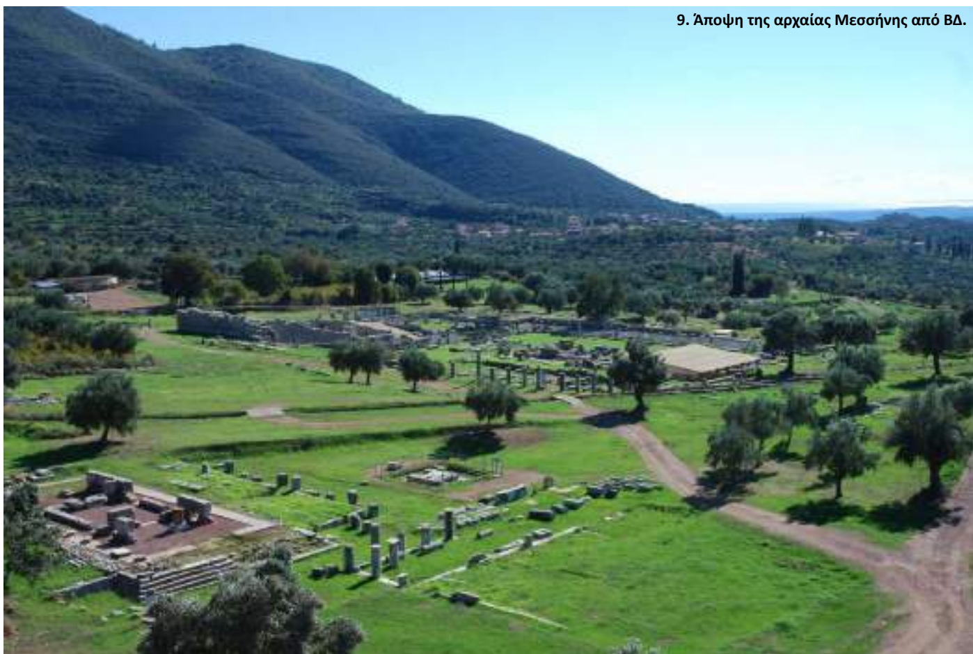
9. Άποψη της αρχαίας Μεσσηνίας από ΒΔ.

Αν δεν αγαπήσεις τη απαιτητική ενασχόληση του αρχαιολόγου, αν δεν μπορείς να χαρείς την κάθε στιγμή της ανασκαφικής διαδικασίας στο ύπαιθρο, αν δεν σε γοητεύει το φυσικό περιβάλλον, η εναλλαγή φωτός και σιάς, τα δένδρα, τα βουνά, αν δεν αγαπάς τα ζώα, αν δεν σε συγκινεί η τέχνη γενικώς, τότε θα σε συμβούλευα, αγαπητή/αγαπητέ μου έφηβε, να αποφύγεις να σπουδάσεις Αρχαιολογία.