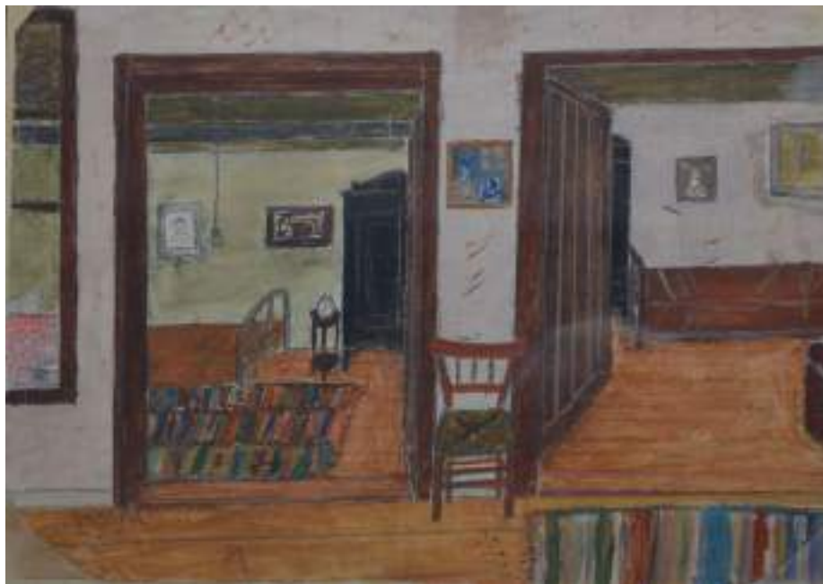
1β. Άποψη του εσωτερικού της οικίας Γ. Θέμελη. Υδατογραφία Π. Θέμελη.

μιλούσαν με τους γονείς και τη γιαγιά, αλλά και για το ελκυστικό στην παιδική αστική μάτια μου παραδοσιακό οικιακό περιβάλλον με κουρελούδες στο πάτωμα, μντέρια, μαξιλάρια και τσιβιά (= αποξηραμένους καρπούς) σε πήλινα πιάκια.