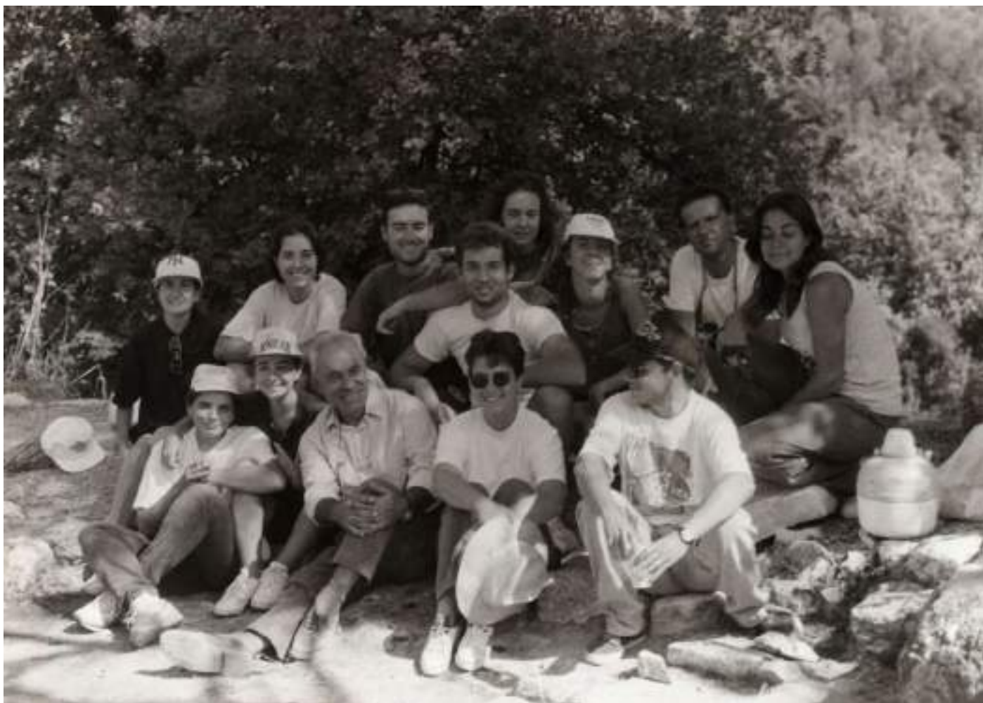
11β. Με ομάδα φοιτητριών και φοιτητών μου στην ανασκαφή της αρχαίας Ελεύθερας.

ους αυτοφυείς πρίνους που δεσπόζουν στο ημιορεινό τοπίο. Το 1997 η κοινότητα μετονομάστηκε σε Αρχαία Ελεύθερα.