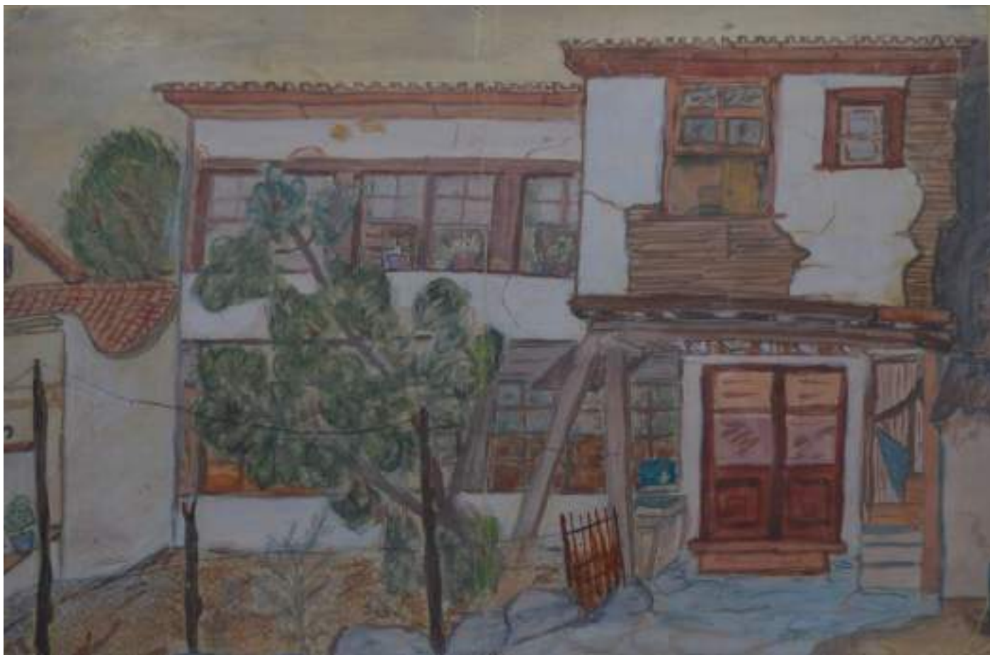
1α. Η διώροφη κατοικία της οδού Δημητρίου Πολιορκητού 10, όπου έμενε η οικογένεια Γ. Θέμελη στα χρόνια της κατοχής. Υδατογραφία Π. Θέμελη.