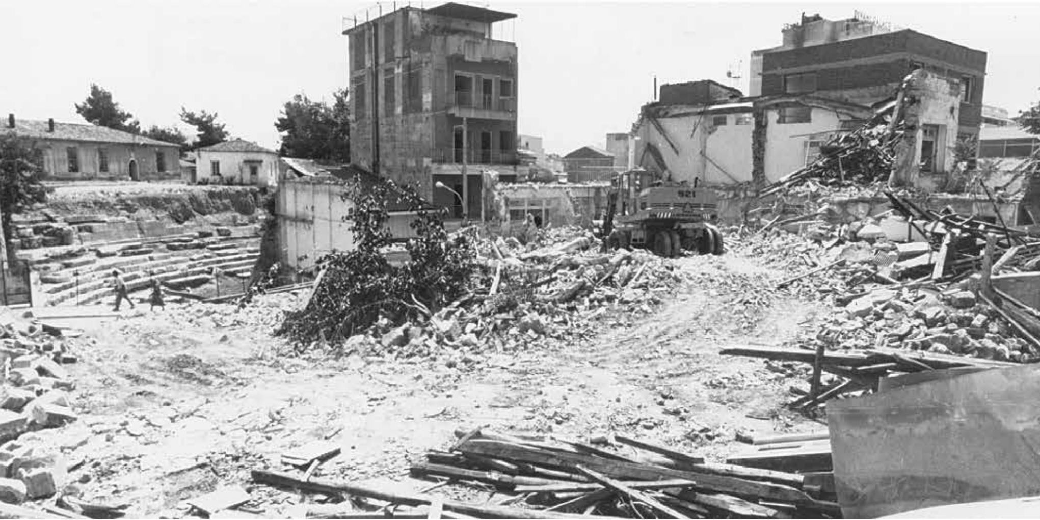
Κατεδαφίσεις οικοδομών -1992. Διακρίνεται αριστερά τμήμα του επιθεάτρου.