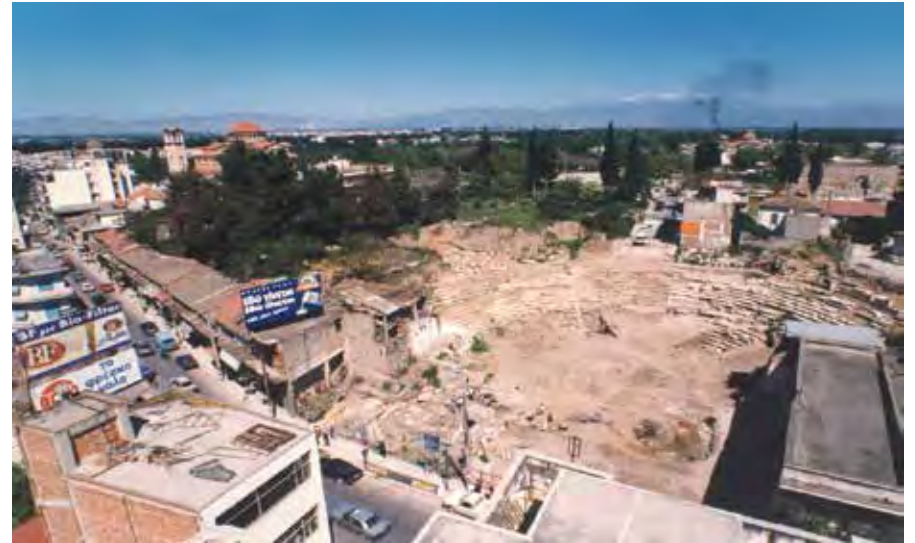
Η ευρύτερη περιοχή του Θεάτρου το 1998 μετά την κατάργηση της οδού Παπαναστασίου.