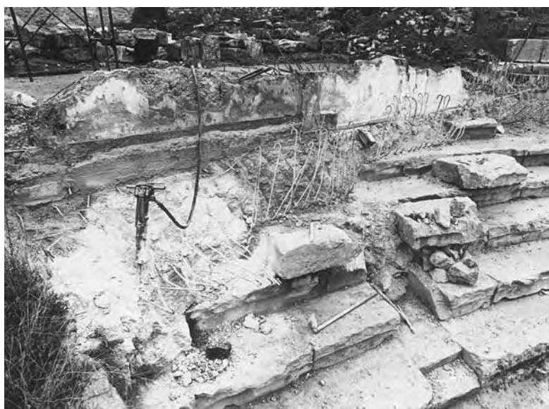
Απομάκρυνση θεμελίων και αποκάλυψη εδωλίων - 1997.