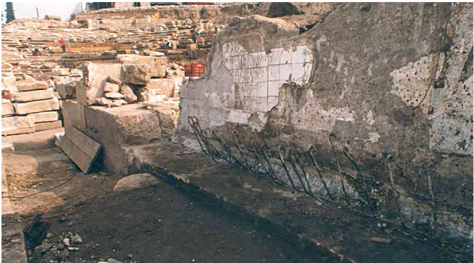
Κατεδάφιση οικοδομής η οποία θεμελιώνεται πάνω στο σκηνικό οικοδόμημα - 2000.