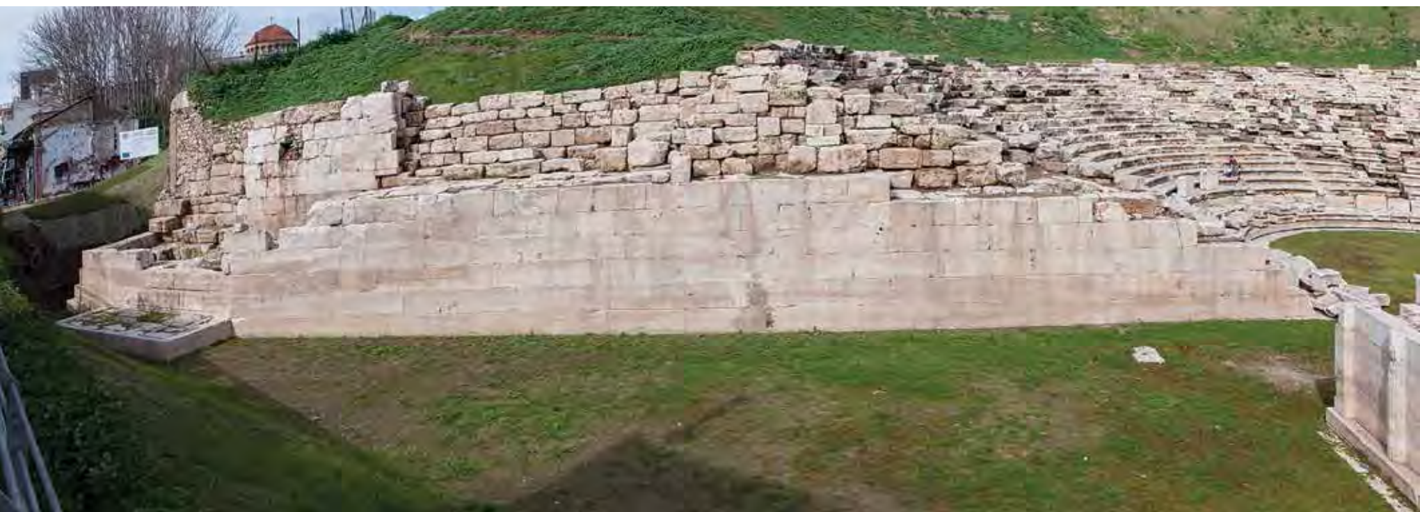
Ο δυτικός αναθηματικός τοίχος