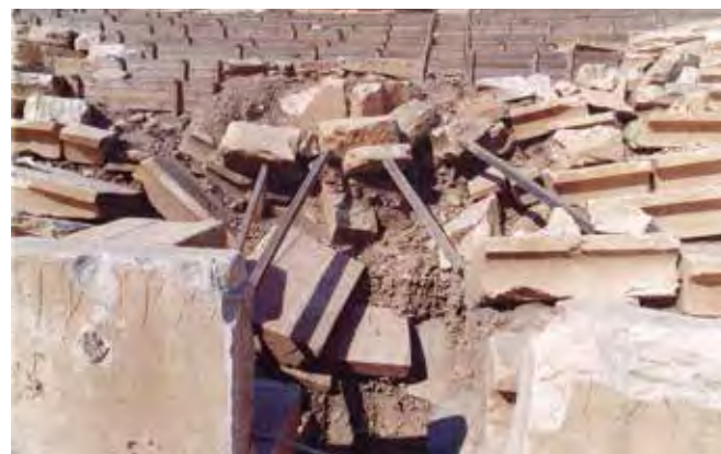
Τμήματα κερκίδων Β και Γ πριν τις ταυτίσεις και τις επανατοποθετήσεις.