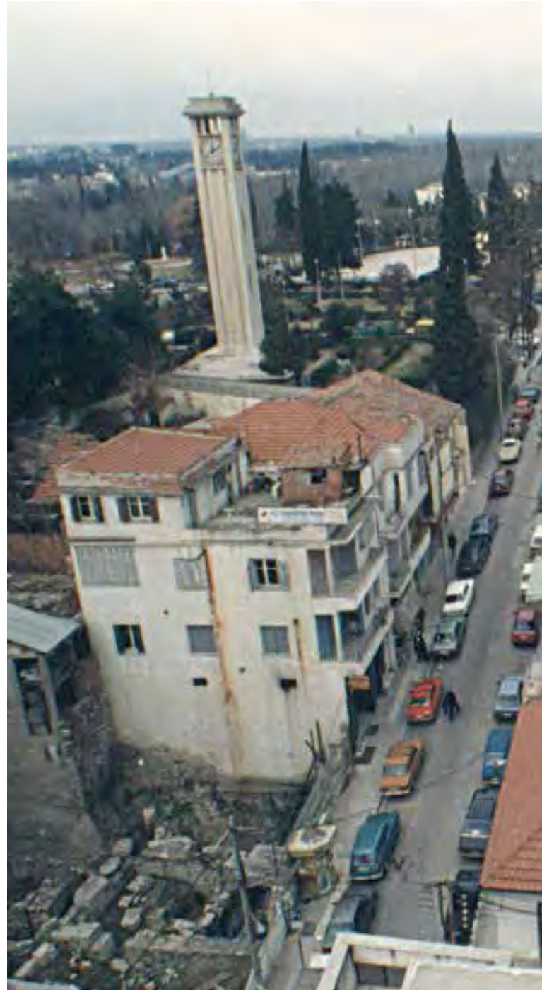
Οικοδομές και το ιστορικό ρολόι της Λάρισας.

Οι ανασκαφές έδειξαν ότι οι τεράστιες επιχώσεις του κοίλου αποτελούνταν από κρημνίσματα σπιτιών, ωμές πλίνθους και κεραμίδια στέγης. Σύμφωνα με τα αρχεία του Εθνικού Αστεροσκοπείου το 1868 ένας μεγάλος σεισμός σάρωσε την Λάρισα και φαίνεται ότι τα ερείπια των πλινθόκτιστων σπιτιών μεταφέρθηκαν και απορρίφθηκαν στον χώρο του μνημείου. Όσο το θέατρο ήταν ορατό έγινε σε διάφορες εποχές συστηματική λιθοθηρία σ' ορισμένα τμήματά του για εξαγωγή οικοδομικού υλικού. Η αποξήλωση ορισμένων τμημάτων του ολοκληρώθηκε μετά την απελευθέρωση της Θεσσαλίας το 1881. Στο επιχωσμένο πλέον θέατρο κατασκευάστηκαν ισόγειες κατοικίες και καταστήματα με ρηχές θεμελιώσεις μιν, αλλιά πολύ βαθείς σηπτικούς βόθρους, αρκετοί από τους οποίους τραυμάτισαν τα μάρμαρα. Μέχρι το 1950 λοιπόν οι ζημιές που προκλήθηκαν στο μνημείο από τις οικοδομές που κατασκευάστηκαν πάνω σ' αυτό ήταν μέτριες. Μετά τη δεκαετία αυτή και ιδιαίτερα κατά τη δεκαετία του 1960, οι βλάβες έγιναν πάρα πολύ σοβαρές με τις νέες οικοδομές που ανεγέρθηκαν στη θέση των παλιών.