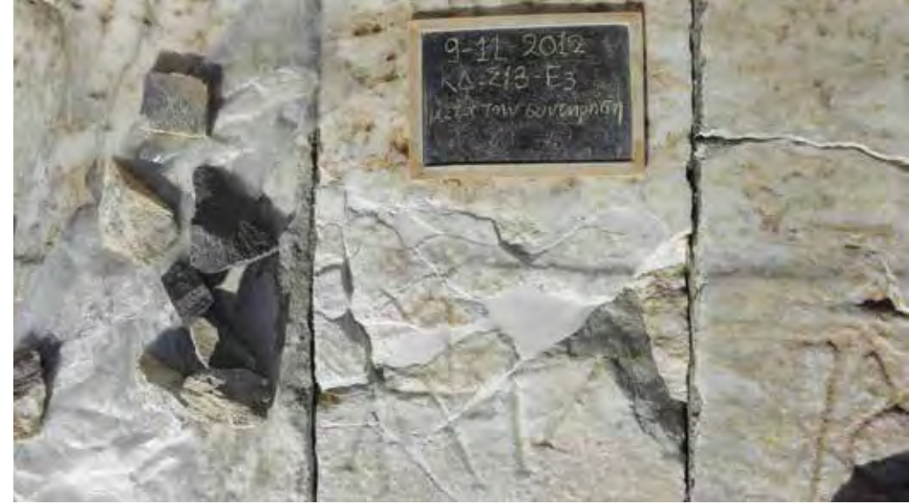
Εργασίες συντήρησης εδωλίων.