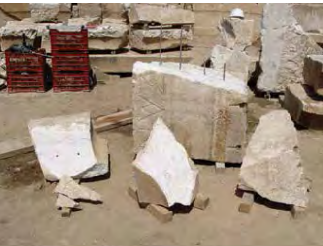
Συγκόλλησεις διάσπαρτων εδωλίων.