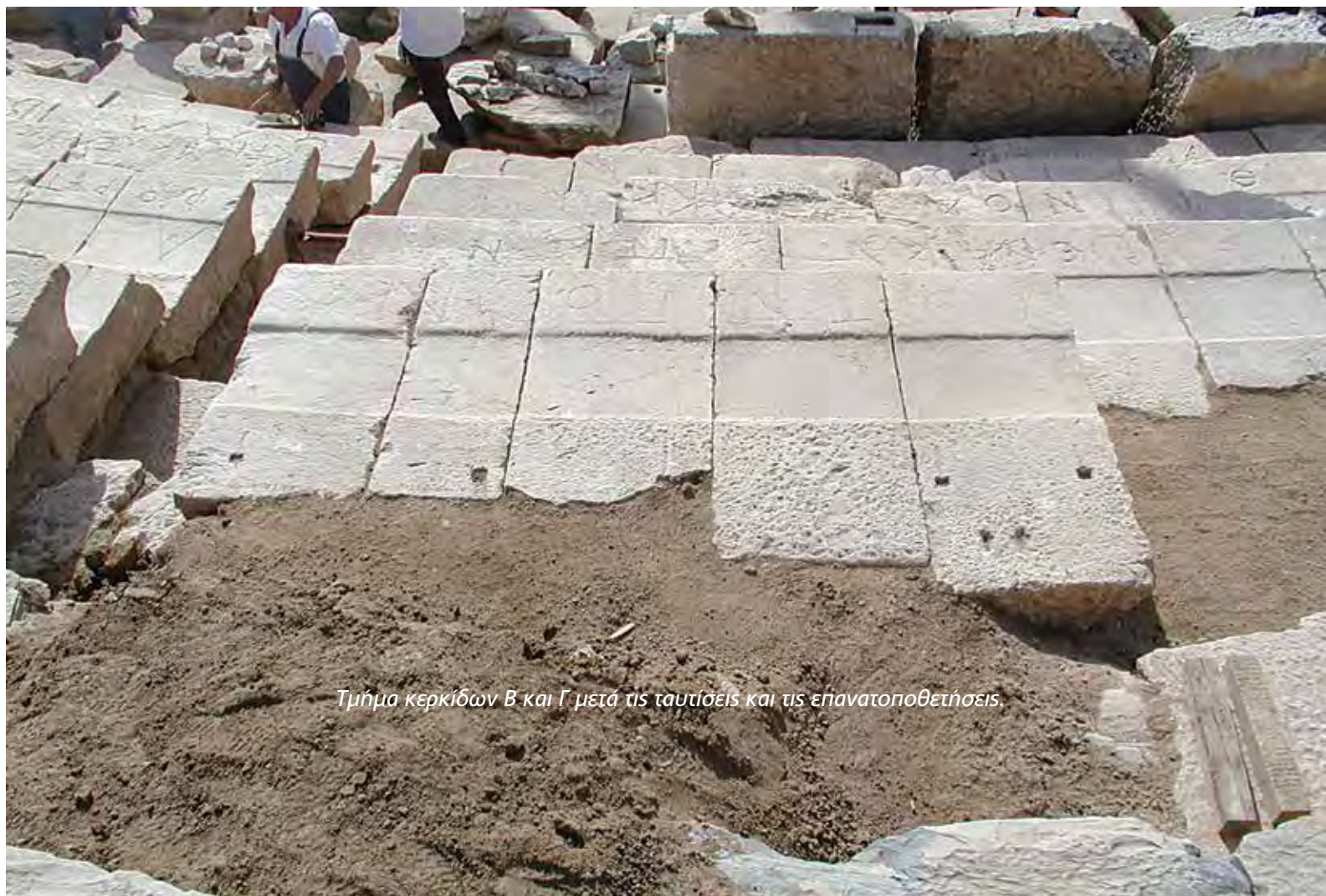
Τμήμα κερκίδων Β και Γ μετά τις ταυτίσεις και τις επανατοποθετήσεις.