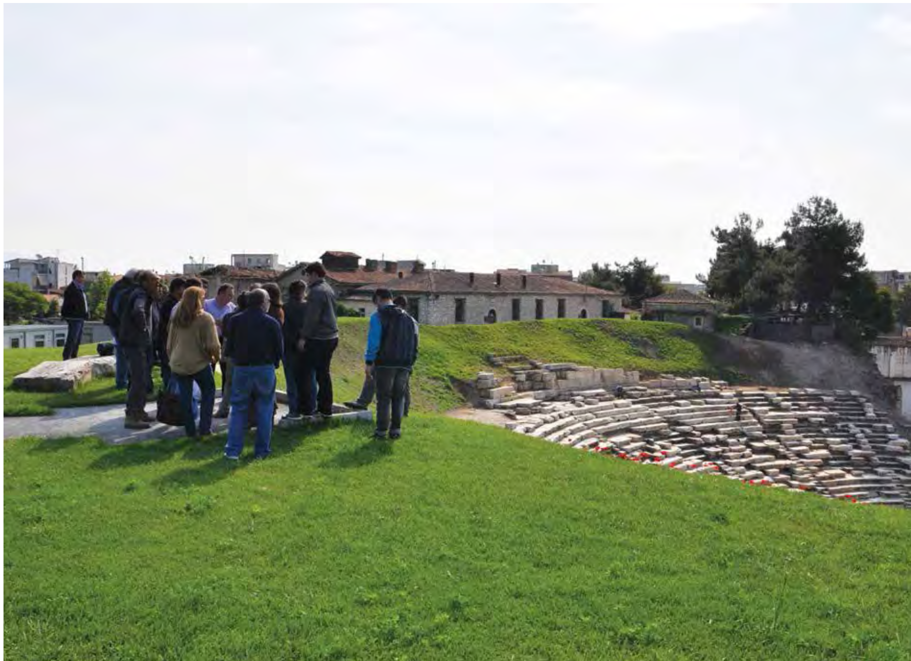
Ξενάγηση εκπαιδευτικών του 4ου ΕΠΑΛ Λάρισας.