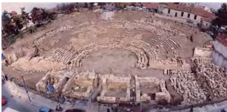
Ο χώρος του αρχαίου θεάτρου μετά την ομαδοποίηση των διάσπαρτων αρχιτεκτονικών μελών - 2005.