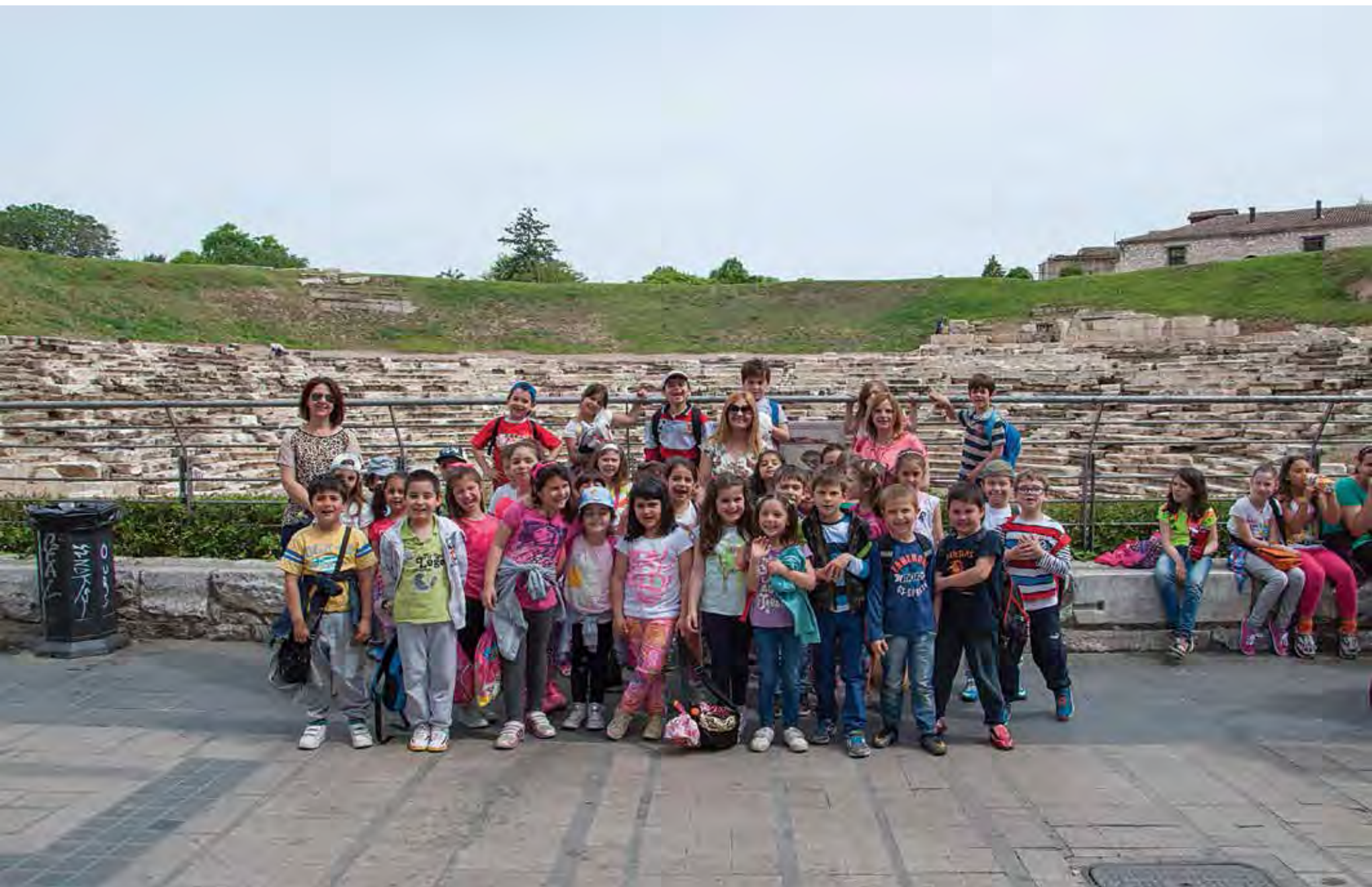
Επίσκεψη – ξενάγηση Δημοτικού σχολείου στο χώρο του αρχαίου θεάτρου.