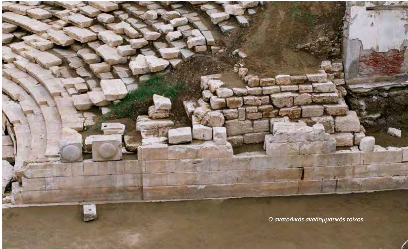
Ο ανατολικός αναθηματικός τοίχος