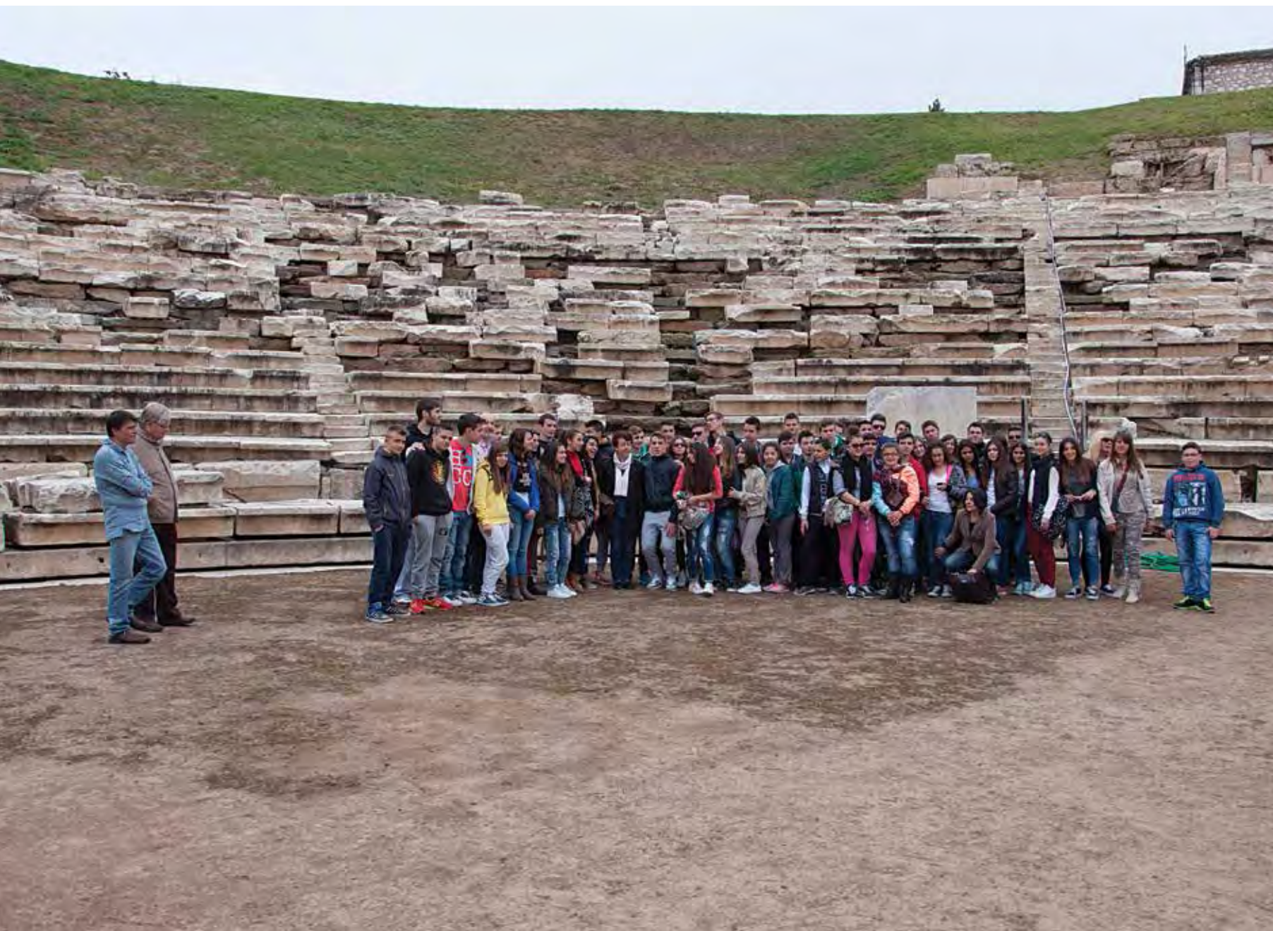
Ξενάγηση στο χώρο του αρχαίου θεάτρου Λυκείου από την Τρίπολη.