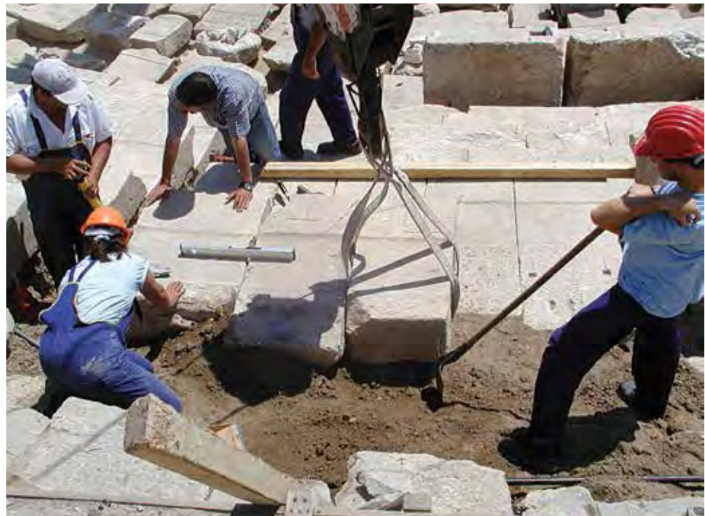
Ταυτίσεις εδωλίων στο χώρο του κυρίως θεάτρου