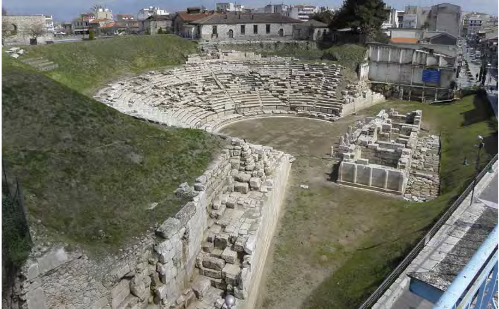
Εργασίες αποκατάστασης του πρανούς. Πριν και μετά την αποκατάσταση.