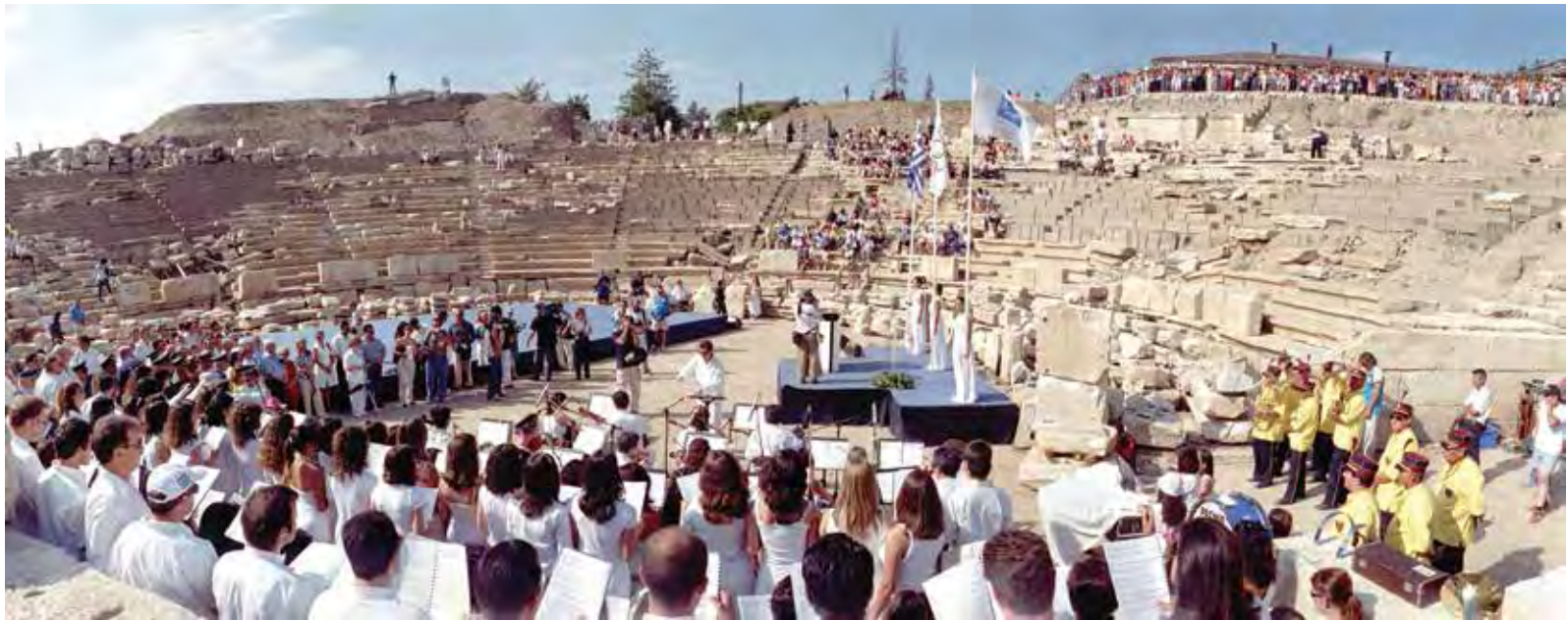
Υποδοχή της ολυμπιακής φλόγας το 2004.