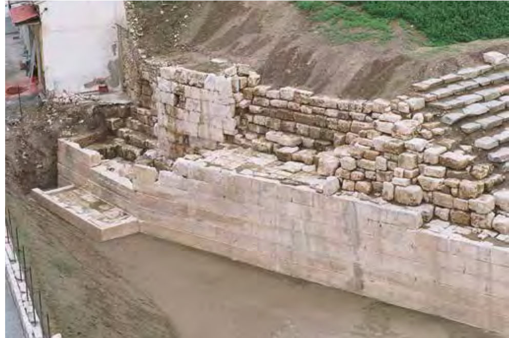
Ο δυτικός αναλημματικός τοίχος

Ο αναλημματικός τοίχος της δεξιάς παρόδου (δυτικός αναλημματικός) αποκαλύφθηκε σε μήκος 40,86, ύψος 4,50 και πλάτος 3,55 μέτρων. Πάνω του σώζεται τμήμα του αναλημματικού τοίχου του επιθέατρου. Στην κύρια όψη του φαίνονται ίχνη των βαθμίδων της κλίμακας ανόδου προς το επιθέατρο. Νότια του δυτικού αναλημματικού του κυρίως θεάτρου και σε επαφή μ' αυτόν, εντοπίστηκε, τον Ιούνιο του 2006, κατά την υλοποίηση του υποέργου εκσκαφής οδοστρώματος της οδού Βενιζέλου, η μνημειώδης κλίμακα που οδηγούσε στο διάζωμα. Σώζονται οι τρεις πρώτες βαθμίδες της και πιθανότατα ένα πλατύσκαλο. Η κλίμακα αυτή εφάπτεται του νοτίου μετώπου του δυτικού αναλημματικού τοίχου (της κύριας όψης του δηλαδή) από βορρά. Νότια και ανατολικά πλαισιώνεται από μαρμαρινούς λιθοπλίνθους πολύ καλά λαξευμένους. Στο δυτικό τμήμα της κλίμακας, όπου και σώζονται οι τρεις πρώτες βαθμίδες, που όπως φαίνεται είναι η αρχή της, ο μαρμαρινός λιθοπλίνθος καταλήγει σε πεσό παραστάδας που στο κάτω μέρος του διακοσμείται με κυμάτιο. Στην κύρια όψη του δυτικού αναλημματικού του κυρίως θεάτρου και στο τμήμα, εντοπίζονται ίχνη επτά βαθμίδων. Η ίδια αυτή κλίμακα συμπεραίνουμε ότι συνεχιζόταν προς τα πάνω από τα