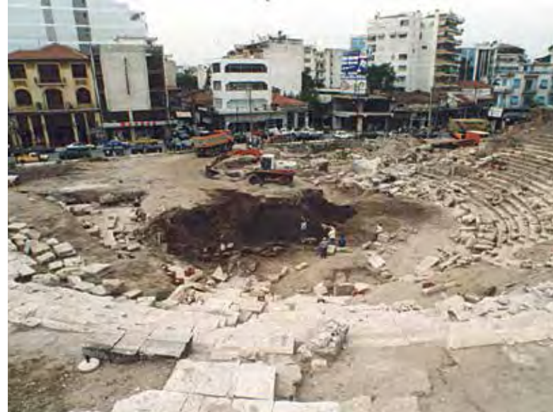
Αποκάθλιψη του θεάτρου - 1999.