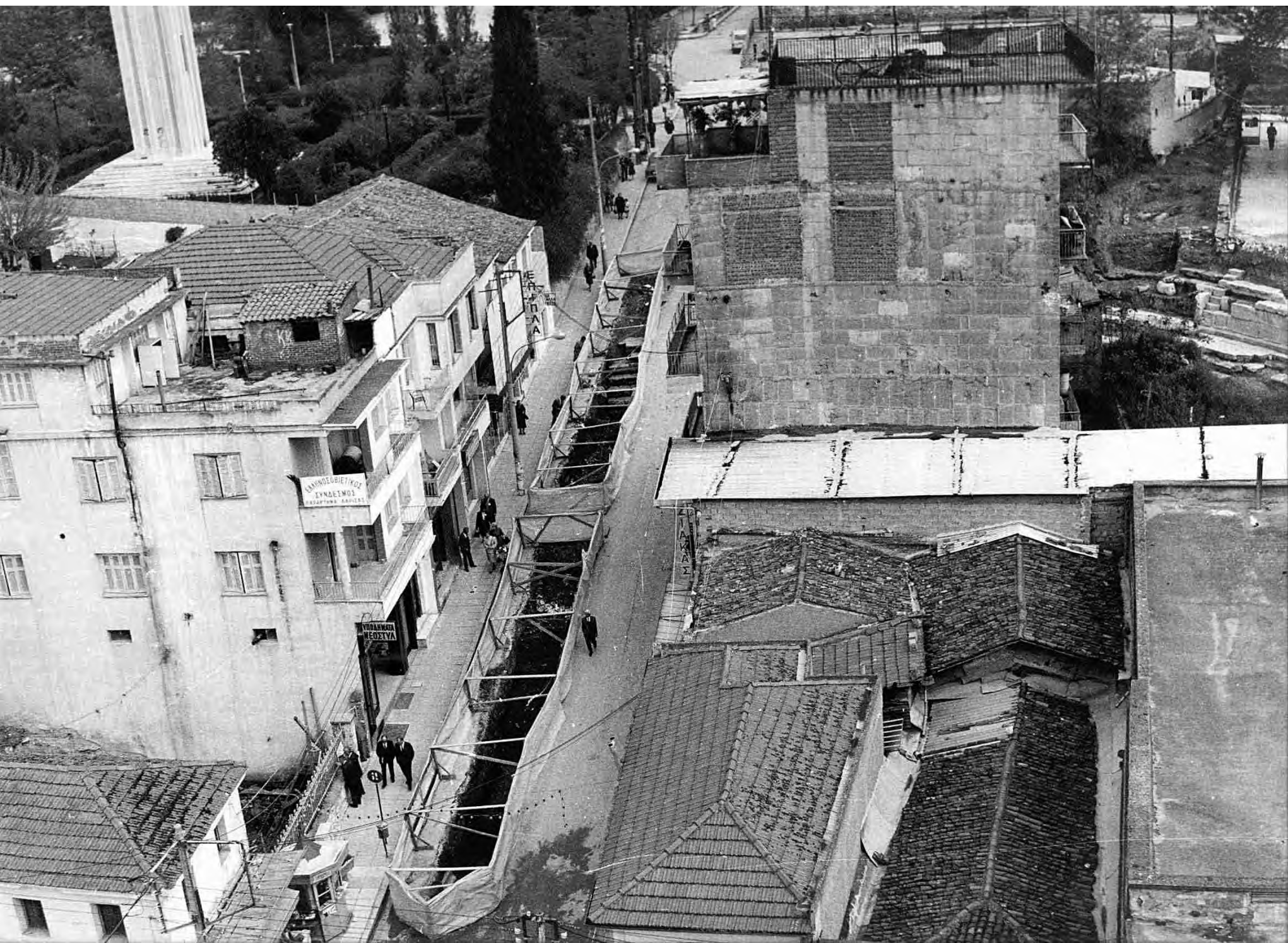
Οικοδομές στο χώρο του θεάτρου.