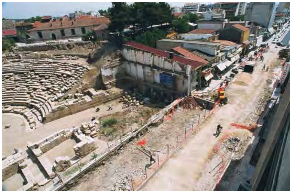
Εργασίες πεζοδρόμησης της οδού Βενιζέλου το 2006.