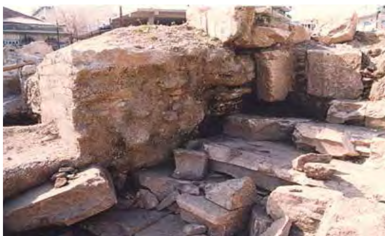
Αποκάλυψη του κυρίως θεάτρου - 1997 / 1998.