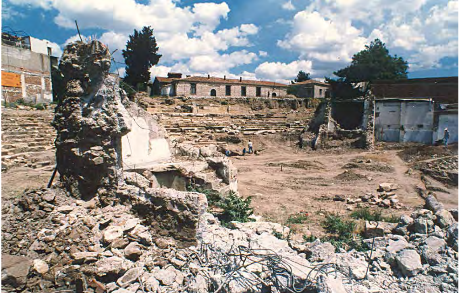
Κατεδαφίσεις πλησίον της δυτικής παρόδου - 1998. Στο βάθος διακρίνεται τμήμα του επιθεάτρου καθώς και το κτήριο των πρώην στρατιωτικών αρτοποιείων.