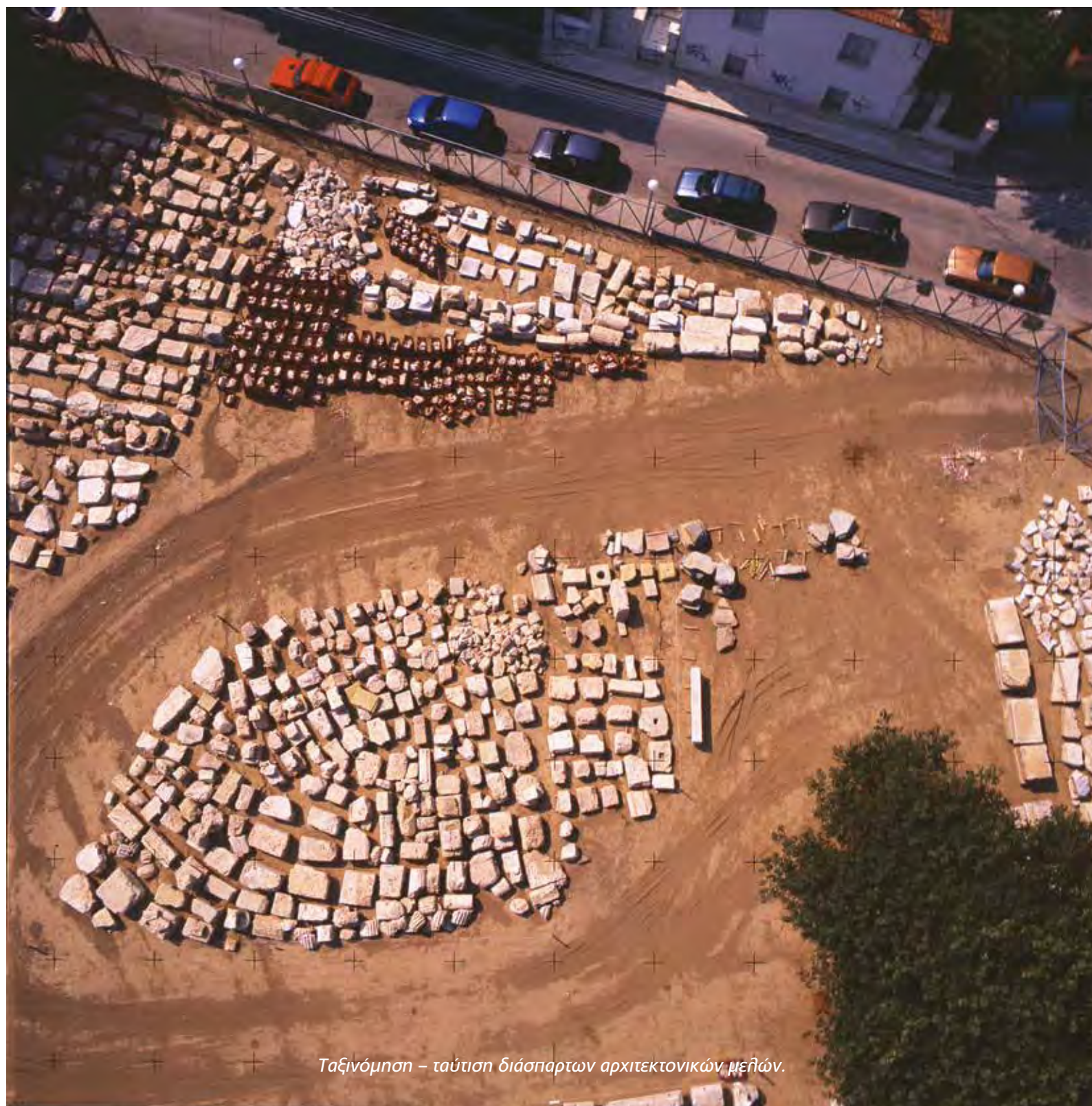
Ταξινόμηση – ταύτιση διάσπαρτων αρχιτεκτονικών μελών.