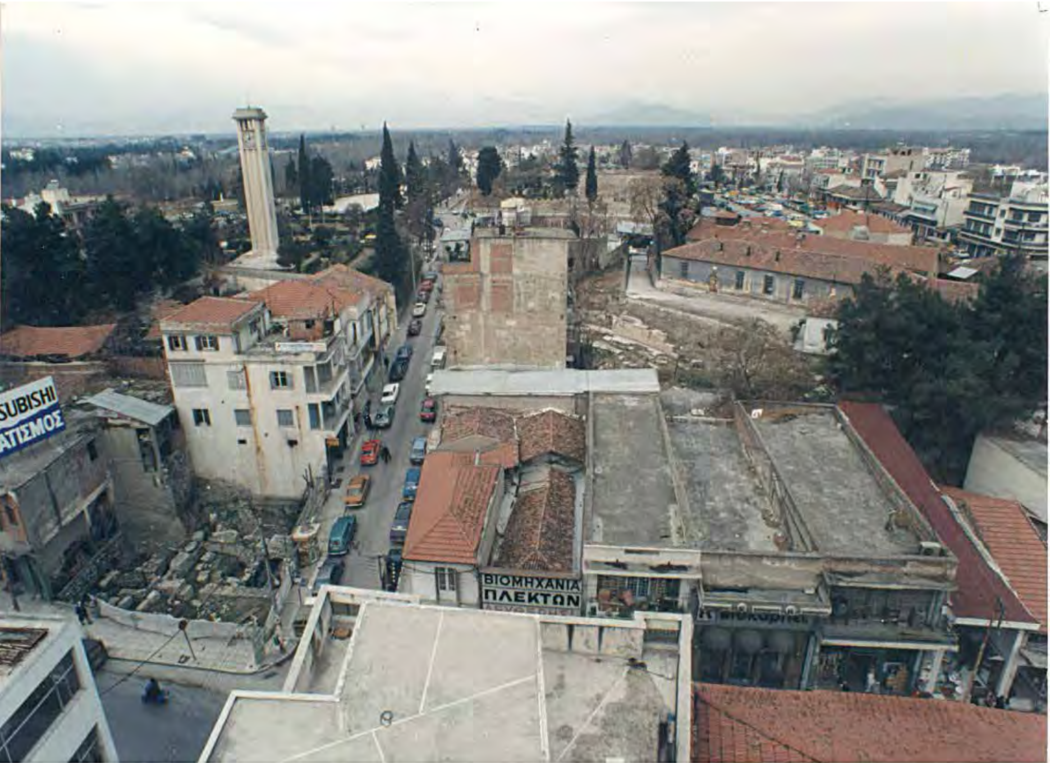
Οικοδομές στη δεκαετία του '80. Διακρίνεται το ρολόι