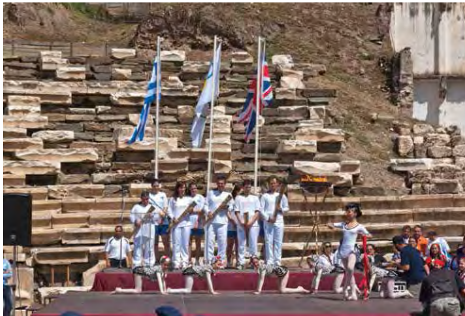
Εκδηλώσεις για την ολυμπιακή φλόγα το 2012.