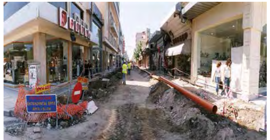
Κατά την διάρκεια των εργασιών πεζοδρόμησης των οδών Βενιζέλου και Παπαναστασίου το 2006.