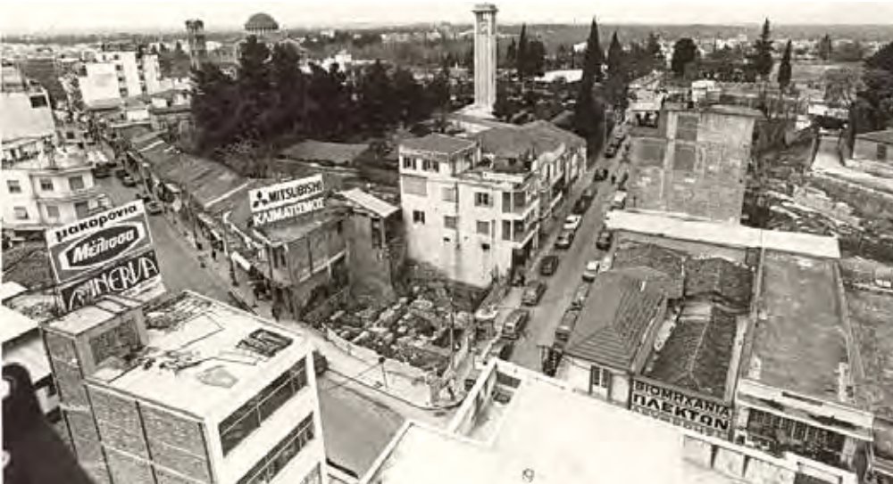
Η ευρύτερη περιοχή του Θεάτρου τέλη του 1980. Διακρίνονται οι οδοί Παπαναστασίου και Βενιζέλου.