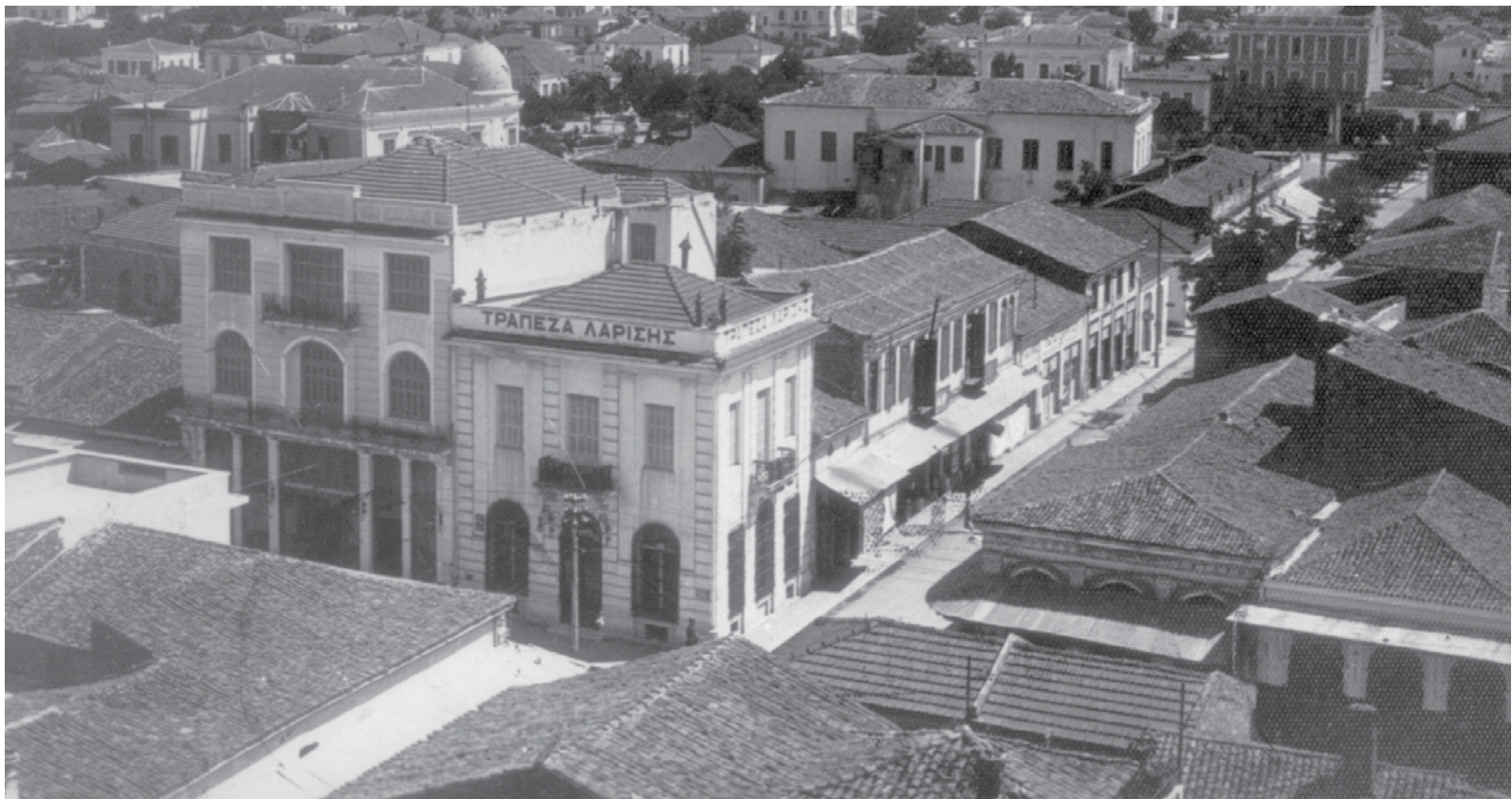
Ο χώρος του θεάτρου σε προπολεμική φωτογραφία.