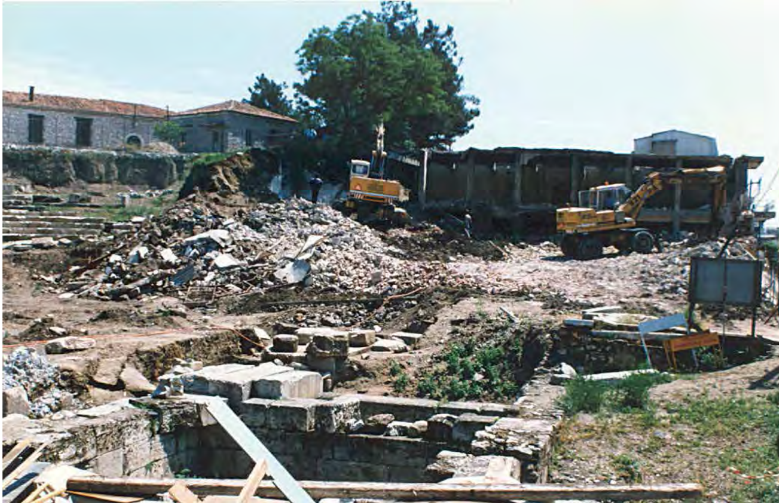
Κατεδάφιση οικοδομών – 1998. Διακρίνεται τμήμα του σκηνικού οικοδομήματος.