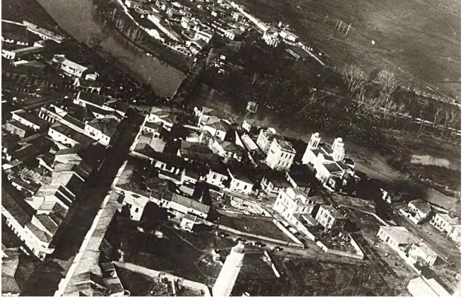
Παλαιότερη φωτογραφία της Λάρισας. Διακρίνεται ο Πηνειός και η περιοχή του θεάτρου.