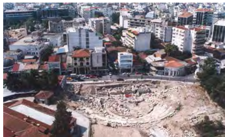
Πανοραμική άποψη του μνημείου και του περιβάλλοντος χώρου - 2001.