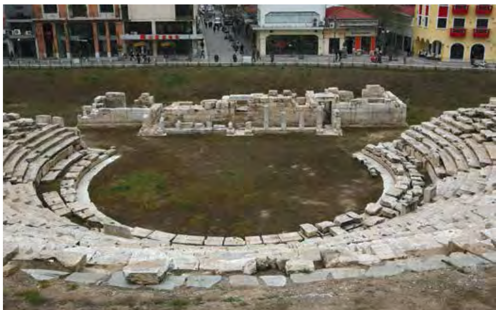
Η ευρύτερη περιοχή του θεάτρου μετά το πέρας των πεζοδρομήσεων.