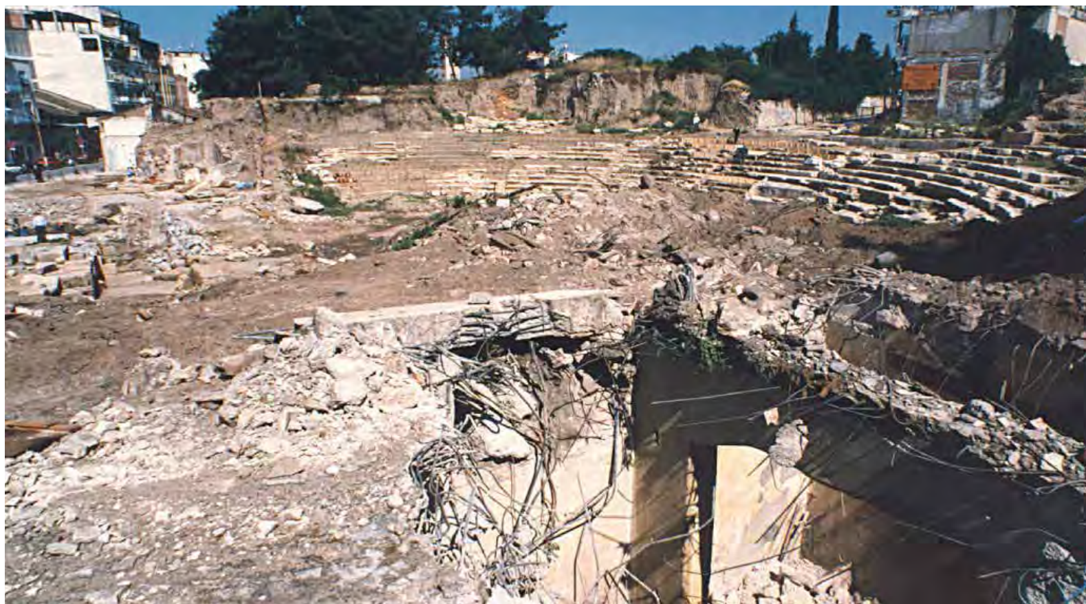
Κατεδαφίσεις πλησίον της ανατολικής παρόδου -1998.