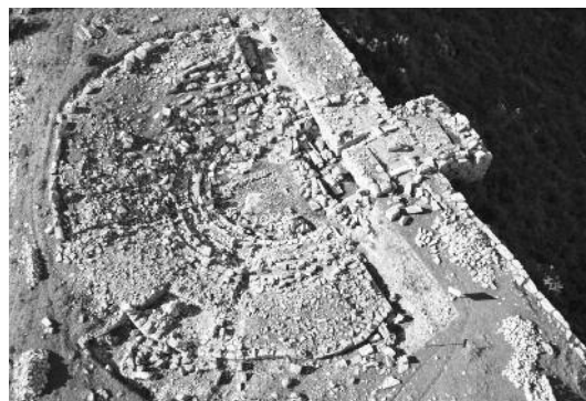
Μια πρόσφατη εικόνα του Θεάτρου από ψηλά (μετά τις ανασκαφές)

μήματος, αποκαλύφθηκε η κρηπίδα που έφερε το προσκήνιο, αλλά και τμήμα του κλιμακοστασίου (8 βαθμίδες), ενώ ανεδείχθησαν τα περιγράμματα των