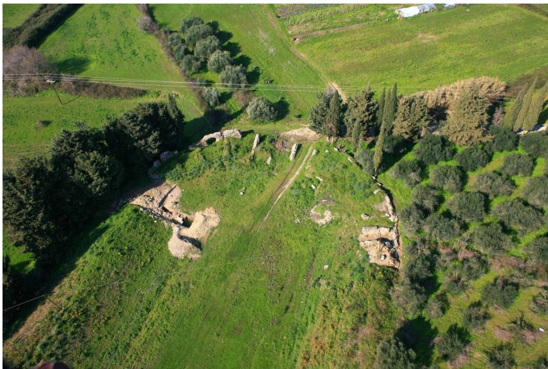
Εικόνα 4. Αεροφωτογραφία του Σταδίου στη συμβολή των τοιχοποιιών της δυτικής σφενδόνης με την πρόσοψη του πεταλόσχημου Σταδίου της πρώτης οικοδομικής φάσης.

Κατά τη δεύτερη οικοδομική φάση το μνημείο αναμορφώνεται για να καλύψει πιθανότατα αυξημένες ανάγκες και απαιτήσεις. Κατασκευάζεται η δυτική σφενδόνη, ενισχύεται τοπικά η υπάρχουσα κατασκευή και λαμβάνεται ειδική μέριμνα για την διευκόλυνση της προσέλευσης και αποχώρησης των θεατών με την διάνοιξη εισόδων στο κέντρο των δύο μακρών πλευρών. Επίσης με την κατασκευή υψηλού ποδίου στο εσωτερικό του, αφενός επιτυγχάνεται η αύξηση του πλάτους του στίβου και αφετέρου καθίσταται δυνατή η διεξαγωγή μονομαχιών και θηριομαχιών, τουλάχιστον στο τμήμα της δυτικής σφενδόνης. Η δεύτερη οικοδομική φάση, που χρονολογείται από τον Κωνσταντίνο Ζάχο στο τέλος του 1ου αι. μ.Χ., είναι κατασκευασμένη από χυτές τοιχοποιίες επενδυμένες με οπτοπλινθοδομή. Η δυτική σφενδόνη διαθέτει επίσης θολωτές κατασκευές εκατέρωθεν κεντρικής, τριπλής μνημειακής κρυπτής εισόδου, για την εξασφάλιση της επιθυμητής κλίσης του κοίλου και την κάλυψη των απαιτούμενων αναγκών σε βοηθητικούς χώρους.