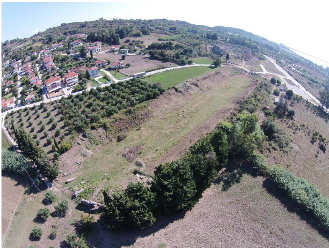
Εικόνα 2. Αεροφωτογραφία του Σταδίου από Νοτιοδυτικά. Διακρίνονται οι τοιχοποιίες της δυτικής σφενδόνης.