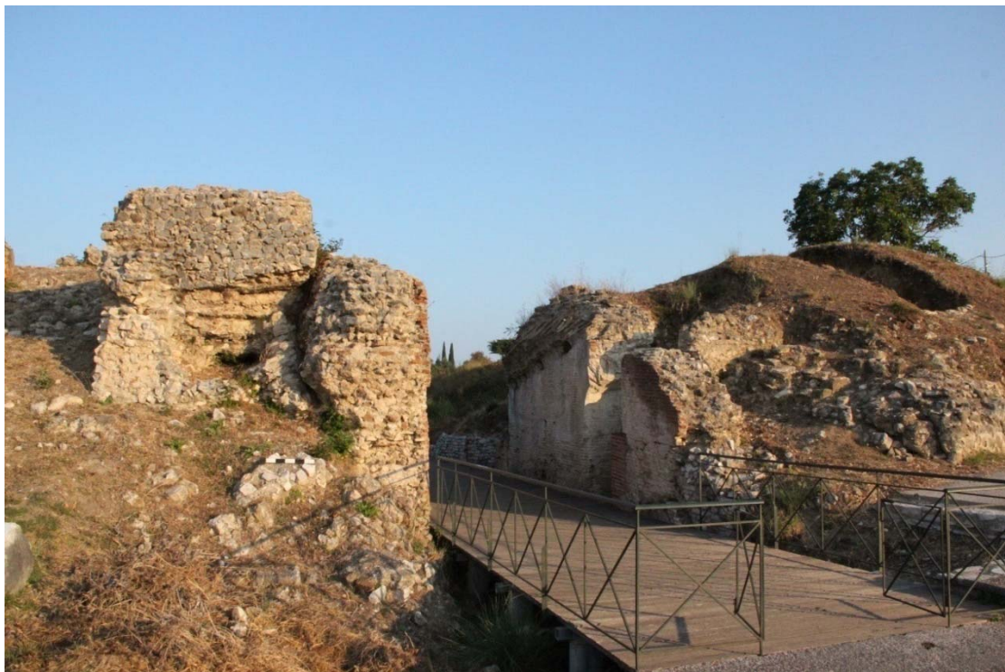
Εικόνα 5. Η Ανατολική κρυπτή είσοδος από νοτιοανατολικά.

Σύμφωνα με τα έως σήμερα αρχαιολογικά δεδομένα, θεωρείται δεδομένο ότι τα πρανή του σταδίου καλύπτονταν από επάλληλες σειρές ασβεστολιθικών εδωλίων τουλάχιστον στη δεύτερη φάση του, καθώς έχει υποστηριχθεί πως αρχικά ίσως τα πρανή παρέμειναν χωμάτινα. Παρόλα αυτά, η σημασία του μνημειακού οικοδομήματος στη τέλεση των Ακτιακών αγώνων και τη ζωή της Νικόπολης ήταν διαχρονική, καθώς εκτός από τον σημαντικό ρόλο που διαδραμάτιζε κατά την διεξαγωγή των αγωνισμάτων, κάλυπτε μεγάλο μέρος των αναγκών του πληθυσμού της πόλης για θεάματα.