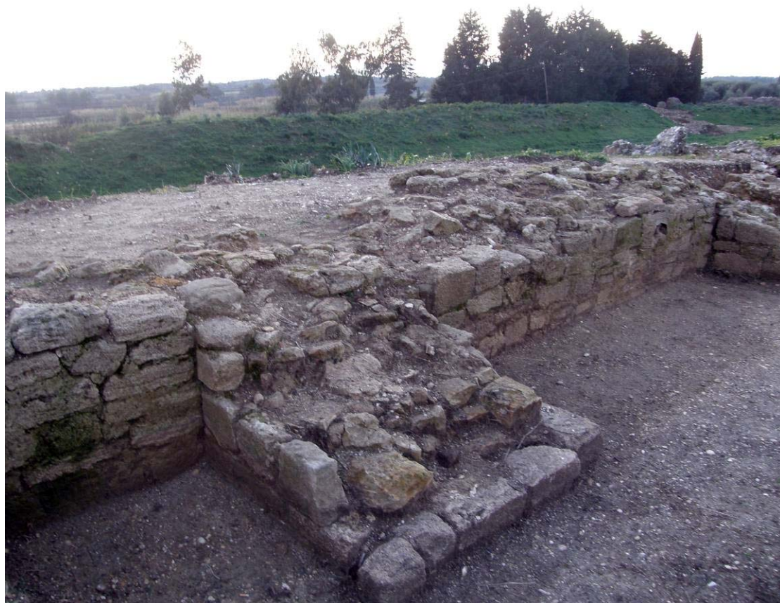
Εικόνα 7. Τμήμα του βόρειου αναλημματικού τοίχου. Διακρίνονται το είδος τοιχοποιίας και η χαρακτηριστική αποσάθρωση των κονιαμάτων της Α' φάσης (Zachos – Pavlidis 2010).

Τόσο τα εκτεταμένα φαινόμενα λιθολόγησης όσο και οι σημαντικές καταπτώσεις τμημάτων της ανωδομής, μακροσκοπικά δημιουργούν σύγχυση για το ακριβές μέγεθος και την κλίση των πρανών του. Αυτό σε συνδυασμό με τις έντονες επιχώσεις λόγω της συνεχούς εισόδου ομβρίων υδάτων στο εσωτερικό από δυσμάς αλλοιώνει το σχήμα του και προκαλεί γεωμετρική παραμόρφωση των αρχικών χαράξεων του.