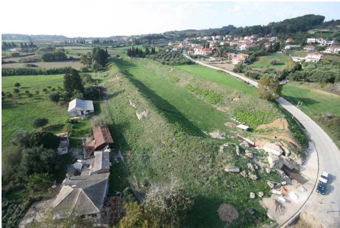
Εικόνα 6. Αεροφωτογραφία του Σταδίου από Νοτιοδυτικά. Διακρίνονται οι τοιχοποιίες της ανατολικής σφενδόνης.

Το Στάδιο της Νικόπολης έπεσε θύμα συστηματικής λιθολόγησης ανά τους αιώνες, αποτελώντας μία διαχρονική, πλούσια σε οικοδομικό υλικό πηγή. Η λιθαρπαγή των ασβεστολιθικών λιθοπλίνθων και εδωλίων, σχεδόν στο σύνολό τους, επέδρασε με τον πιο βίαιο και επιβαρυντικό τρόπο στη συνοχή της κατασκευής, προκαλώντας καταρρεύσεις τοιχοποιιών και θόλων. Σε αυτό πρέπει να συνυπολογιστεί η χρήση διαφορετικών στατικών μοντέλων και συστημάτων δόμησης κατά μήκος της κατασκευής, εξαιτίας των δύο μεγάλων οικοδομικών φάσεων του μνημείου.