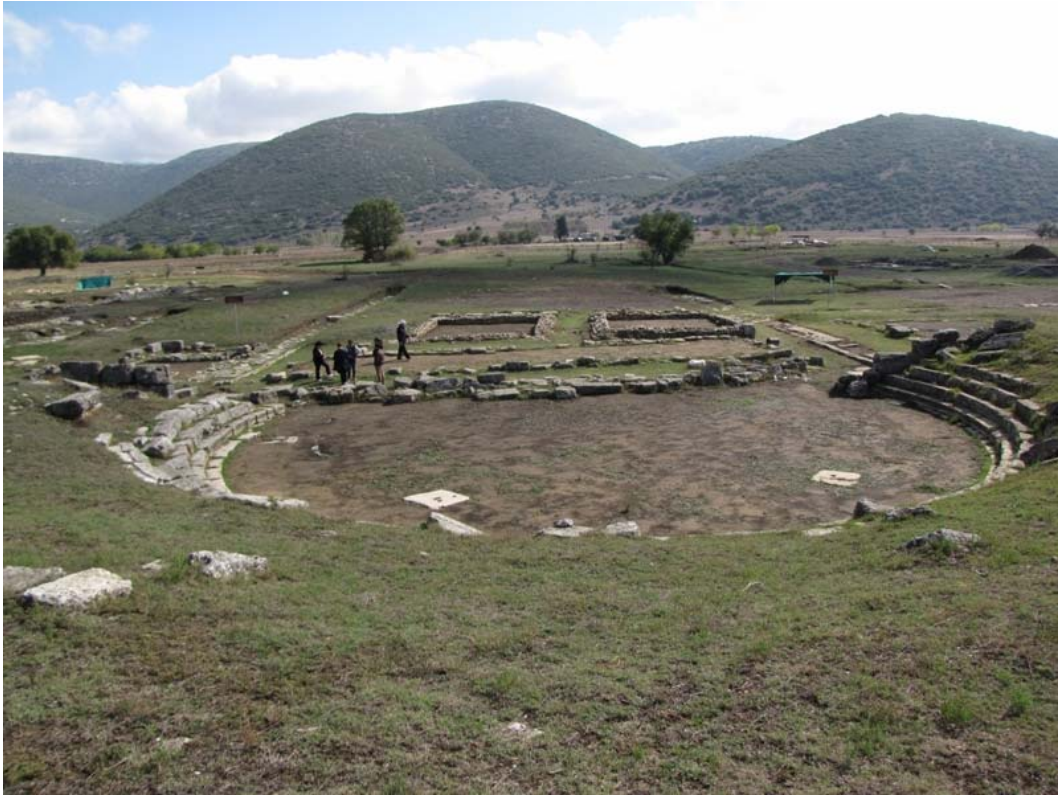
Εικ. 1. Γενική άποψη του θεάτρου και της αγοράς από Δ.