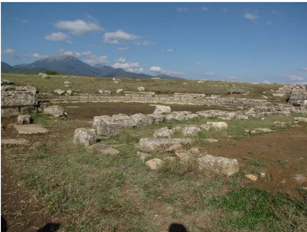
Εικ. 2. Γενική άποψη του θεάτρου από Α. Σε πρώτο πλάνο τα ερείπια του σκηνικού οικοδομήματος.