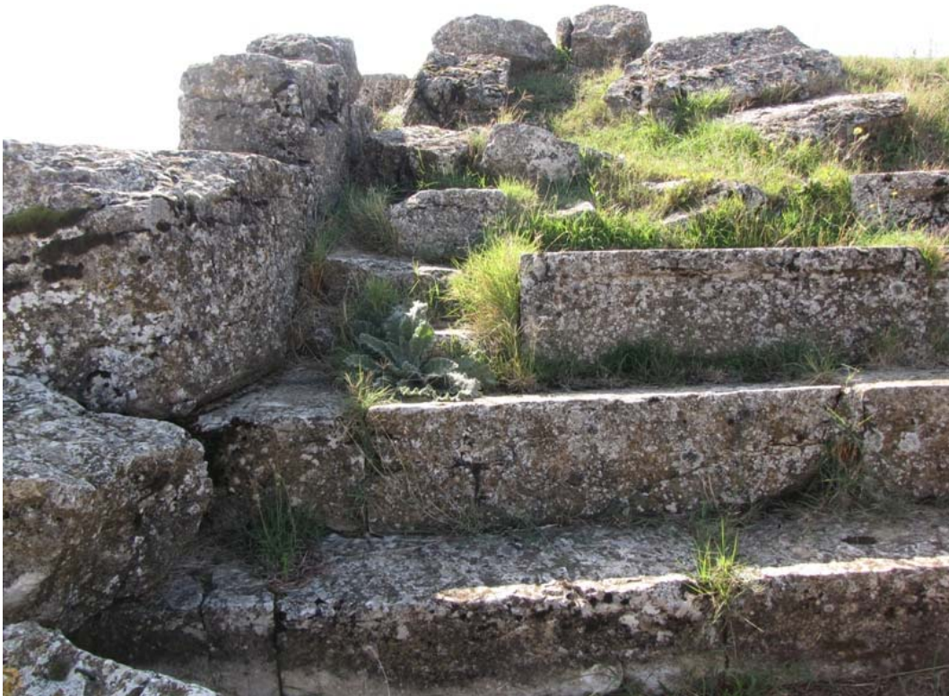
Εικ. 7. Η ακραία κλίμακα προς Ν.