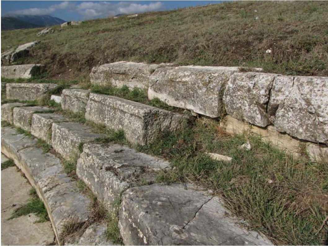
Εικ. 6. Η κατάσταση των λίθινων μελών του κοίλου.