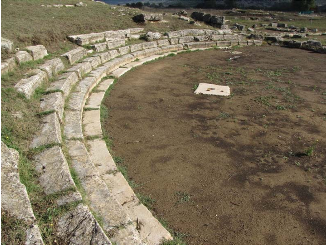
Εικ. 4. Γενική άποψη των κάτω σειρών του κοίλου. Βόρειο ήμισυ.