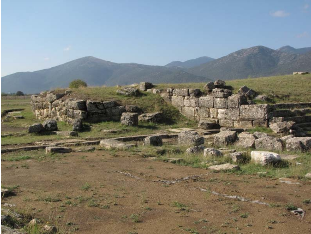
Εικ. 8. Το ανάλημμα της νότιας παράδου.