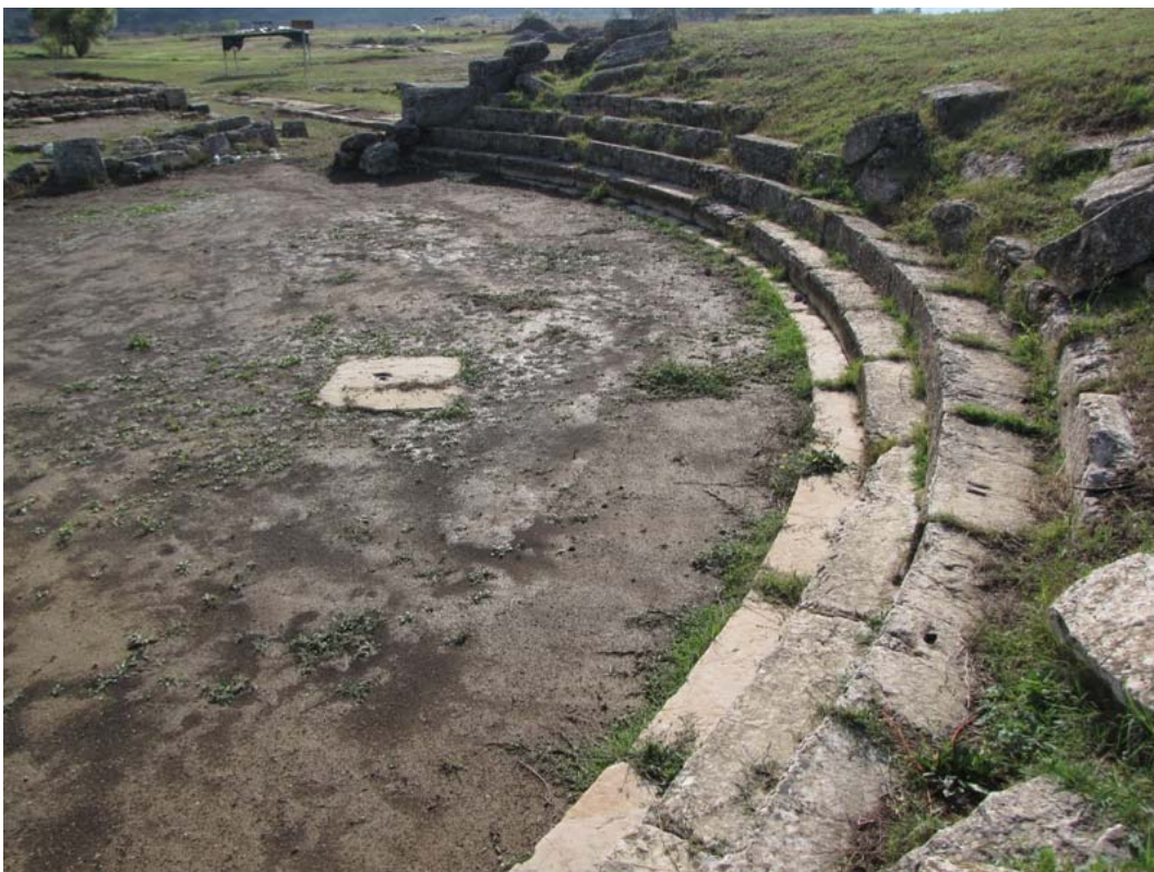
Εικ. 5. Γενική άποψη των κάτω σειρών του κοίλου. Νότιο ήμισυ.