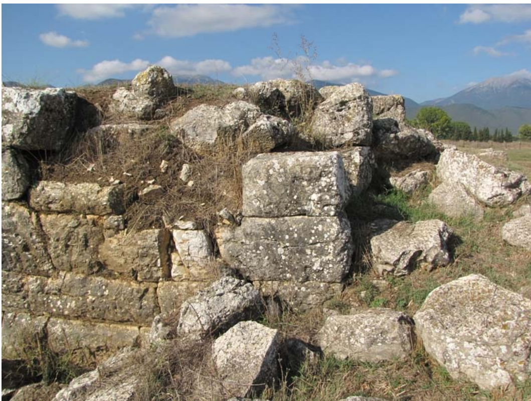
Εικ. 11. Πτώση λίθων και παραμορφώσεις στη ΒΑ γωνία του βόρειου αναλήμματος.