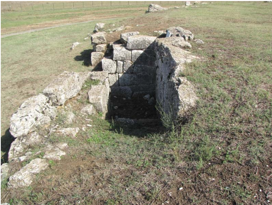
Εικ. 13. Το ανάλημμα της δυτικής εισόδου από Ν.