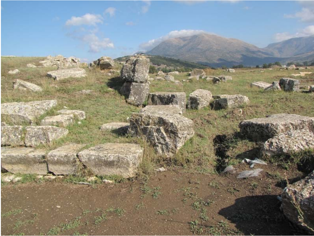
Εικ. 10. Παραμορφώσεις στο ανάλημμα της βόρειας παρόδου.