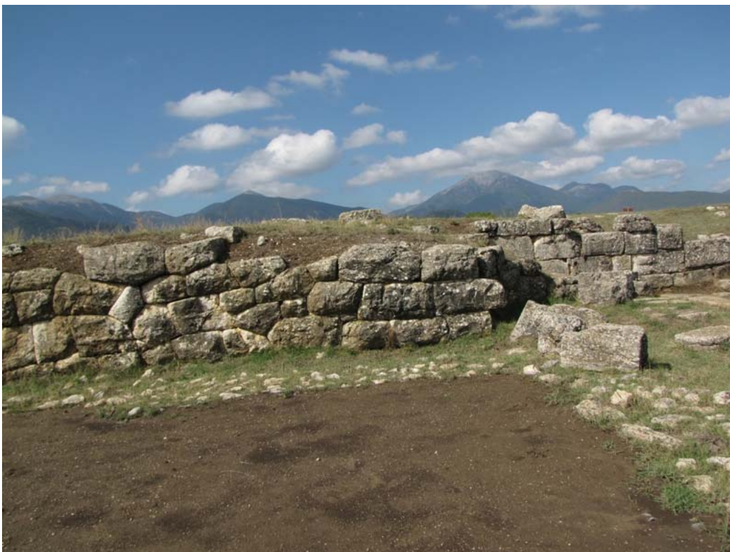
Εικ. 9. Το ανάλημμα της βόρειας παράδου.