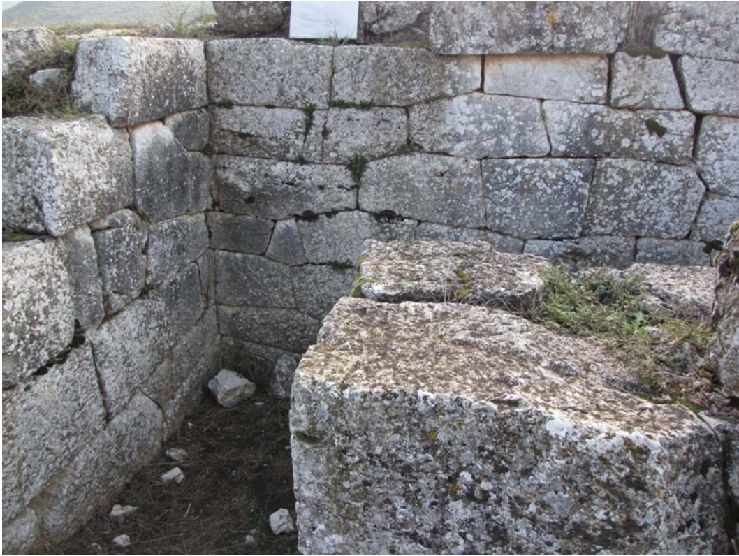
Εικ. 12. Το ανάλημμα της δυτικής εισόδου από Δ.