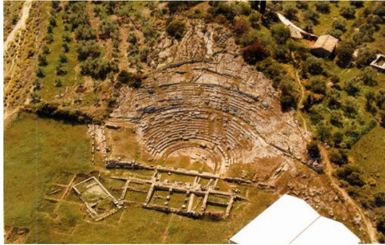
Αιγείρα θέατρο: αεροφωτογραφία του θεάτρου

Έχει πεταλόσχημο κοίλο και βρίσκεται σε υψόμετρο 350μ. από την επιφάνεια της θάλασσας, βόρεια της ακρόπολης. Η κατασκευή του χρονολογείται στο α' μισό του 3 ου αι. π.Χ., γύρω στα 280-250 π.Χ., όταν ιδρύεται το Β' Κοινό των Αχαιών – η Αχαϊκή Συμπολιτεία – και οι αχαϊκές πόλεις αναδιοργανώνονται.