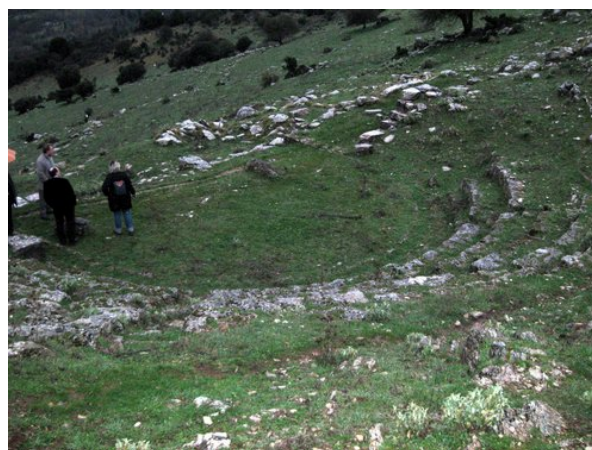
Το κοίλο του θεάτρου

Σήμερα έχουν αποκαλυφθεί 9 σειρές εδωλίων, ενώ οι ανώτερες σειρές ήταν μάλλον λαξευμένες στο βράχο. Επίσης έχουν αποκαλυφθεί στον υπόλοιπο ανασκαμμένο χώρο, λείψανα των οχυρώσεων και των πύργων της ακρόπολης και ερείπια τριών μεγάλων κτιρίων.