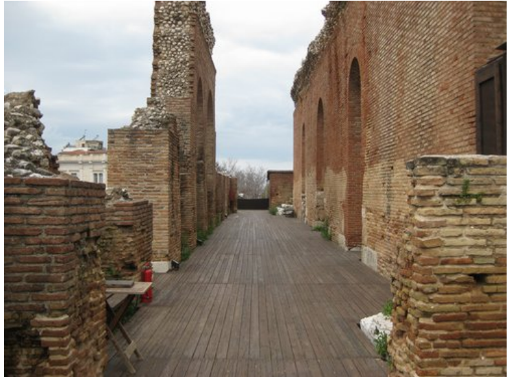
Η σκηνή του ωδείου

Το προσκήνιο είναι προσιτό από δύο κτιστές σκάλες, μια δεξιά και μια αριστερά. Η ορχήστρα είναι πλακόστρωτη και χωρίζεται σε ημικυκλικό θωράκιο από το κοίλο.