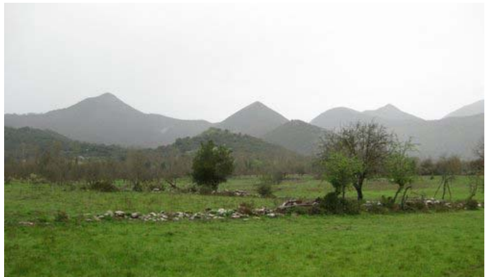
Η τοποθεσία του αρχαίου θεάτρου

Η αρχαία πόλη ήταν κτισμένη σε περιοχή εξαιρετικού φυσικού κάλλους. Πραγματικά εντυπωσιάστηκα από την ενέργεια που εκπέμπει ο τόπος ακόμη και σήμερα.