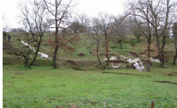
Ο τεχνητός λόφος του θεάτρου

Το αρχαίο θέατρο χωροθετείται ΝΔ της πόλης και απέδωσε ενδείξεις ύπαρξης διαζώματος. Ήταν κτισμένο σε τεχνητό λόφο και δέσποζε στην αρχαία πόλη.