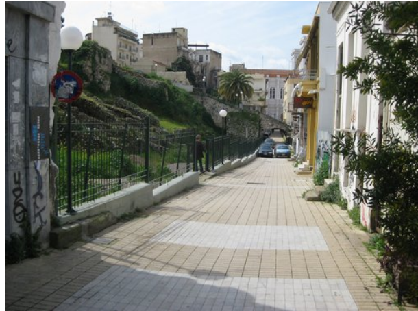
Σύγχρονη οδός και τμήμα του σταδίου

Αυτό είναι και το μεγαλύτερο ενιαίο τμήμα του αμφιθεάτρου που έχει αποκαλυφθεί και είναι ορατό. Βρίσκεται στην οδό Ηφαιστού.