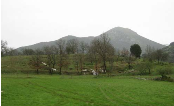
Άποψη του αρχαίου θεάτρου)

Στους ρωμαϊκούς χρόνους, η κατοίκηση εξαπλώνεται περιμετρικά εκτός των τειχών, όπου έχουμε αγροτικές δομές αυτής της περιόδου. Τα συστηματικά νεκροταφεία της πόλης εντοπίζονται εκτός των πυλών. Οι τάφοι εκκινούν από τους υστερογεωμετρικούς τάφους και φτάνουν στους υστερορρωμαϊκούς. Τον 4ο αιώνα μ.Χ. διαπιστώνεται ανακοπή στη συνέχεια της πόλης και φαίνεται ότι το κέντρο βάρους της οικιστικής οργάνωσης μετατίθεται δυτικότερα στη θέση του σημερινού χωριού Κλείτορας, γνωστού με αυτό το όνομα από το Μεσαίωνα.