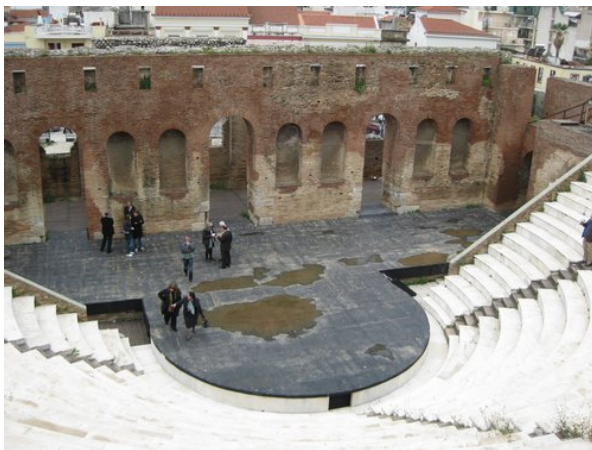
Απόψεις του ωδείου