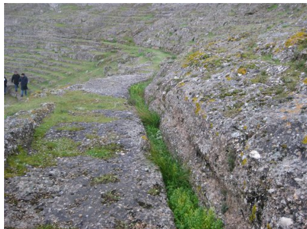
Λεπτομέρεια το διάζωμα του θεάτρου

Το σκηνικό οικοδόμημα της Ελληνιστικής περιόδου ήταν δώροφο. Ένα διάζωμα διαιρεί το κοίλο σε δύο τμήματα και η συνολική χωρητικότητά του ανέρχεται σε 3.000 θεατές, ενώ το μήκος του φθάνει τα 30.70μ.