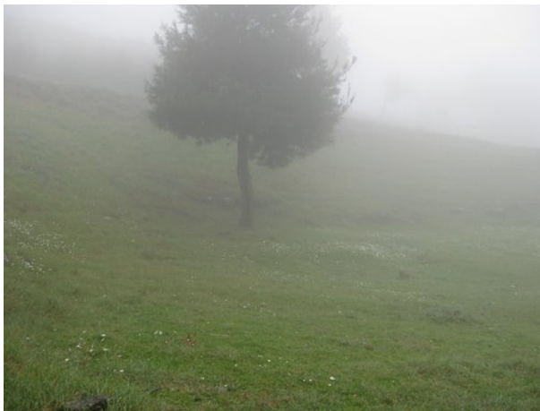
Άποψη συνολική του θεάτρου

Προσπελάσαμε το αρχαίο θέατρο κατόπιν πορείας 1χλμ. , η οποία έλαβε χώρα κατά μήκος μιας καταληκτικής διαδρομής εντός του αρχαιολογικού χώρου.