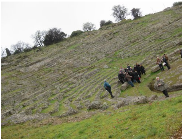
Άποψη του θεάτρου