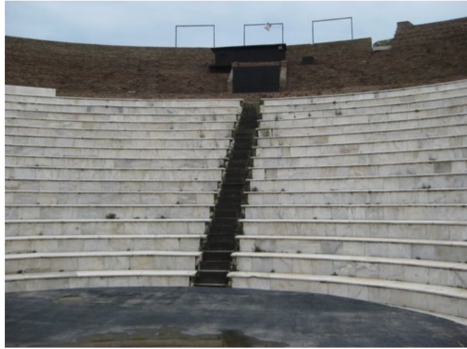
Το αναστηλωμένο κοίλο

Τα έτη 1938, 1943 και 1957 γίνονται σταδιακές ανασκαφές, αποτέλεσμα των οποίων είναι η ανακάλυψη μερών του μνημείου. Αργότερα ξεκινούν και οι εργασίες αναστήλωσης του μνημείου, ώστε να πάρει την αρχική του μορφή. Την ίδια δεκαετία, μετατράπηκε ο περιβάλλον χώρος σε αρχαιολογικό με την έκθεση σ' αυτόν, σαρκοφάγων, ψηφιδωτών και άλλων αρχαίων ευρημάτων. Από τη θέσπιση του Διεθνούς Φεστιβάλ Πάτρας, το Αρχαίο Ωδείο αποτελεί τη βασική του έδρα, φιλοξενώντας τους καλοκαιρινούς μήνες κορυφαία ελληνικά και ξένα καλλιτεχνικά συγκροτήματα.