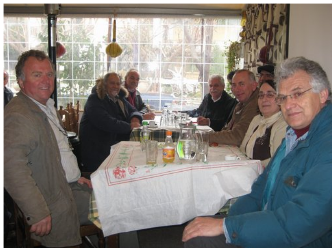
Λεπτομέρεια από τη συγκέντρωση στο καφενείο της περιοχής

Κατόπιν ξαποστάσαμε σε ένα τοπικό καφενείο, όπου συζητήσαμε τα σχετικά με την πρόοδο των εργασιών και την ανάδειξη του θεάτρου της Αιγείρας θέματα. Σήμερα υφίσταται μια πλήρης μελέτη για τη συντήρηση του αρχαίου θεάτρου, όπου θα προστεθεί και νέο υλικό, σχετικό με την ανάδειξη τόσο του ίδιου του θεάτρου, όσο και του περιβάλλοντος χώρου. Το έργο όλου του αρχαιολογικού χώρου πρόκειται να ενταχθεί στο Δ' ευρωπαϊκό πλαίσιο στήριξης - Ε.Σ.Π.Α., με το ποσό των 800.000 €. Όμως για να ανοίξει άμεσα ο δρόμος της ένταξής του, απαιτείται πρώτα μια απαλλοτρίωση, ύψους περίπου 30 000 ευρώ.