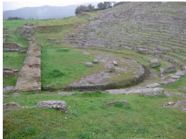
Λεπτομέρεια της ορχήστρας του θεάτρου

Το κοίλο λαξεύτηκε στο βράχο και, όπου αυτός δεν υπήρχε, διαμορφώθηκε κατάλληλα το έδαφος και τοποθετήθηκαν λίθινα εδώλια. Στο φυσικό βράχο λαξεύτηκε κατά το μεγαλύτερο μέρος και η ορχήστρα, στα κράσπεδα της οποίας κατασκευάστηκε αυλάκι για την απορροή των όμβριων υδάτων.