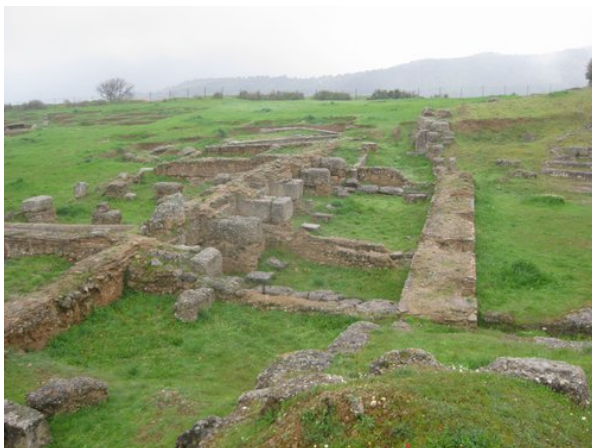
Λεπτομέρεια της σκηνής του θεάτρου

Το κοίλο λαξεύτηκε στο βράχο και, όπου αυτός δεν υπήρχε, διαμορφώθηκε κατάλληλα το έδαφος και τοποθετήθηκαν λίθινα εδώλια. Στο φυσικό βράχο λαξεύτηκε κατά το μεγαλύτερο μέρος και η ορχήστρα, στα κράσπεδα της οποίας κατασκευάστηκε αυλάκι για την απορροή των όμβριων υδάτων.