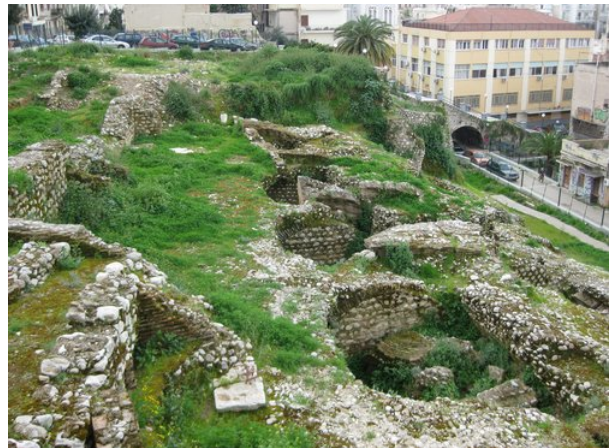
Το καλύτερο σωζόμενο τμήμα του

Το καλύτερα και ψηλότερα διατηρημένο τμήμα του αμφιθεάτρου βρίσκεται στην ανατολική μακριά πλευρά, που είναι κτισμένη στην πλαγιά φυσικού ανδύρου.