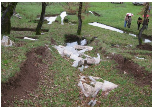
Οι δοκιμαστικές τομές