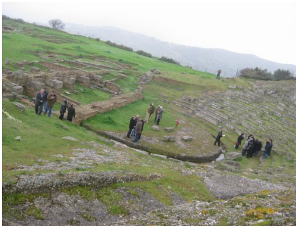
Άποψη του θεάτρου

Η ανασκαφή της πόλης ξεκίνησε το 1916 από το Αυστριακό Αρχαιολογικό Ινστιτούτο υπό τον Ο. Walter και διακόπηκε λίγο μετά, λόγω του Α' Παγκοσμίου Πολέμου. Η συστηματική ανασκαφή της Αιγείρας από το Αυστριακό Αρχαιολογικό Ινστιτούτο άρχισε ξανά το 1972 και συνεχίζεται χωρίς διακοπή έως σήμερα. Η αρχαία πόλη κατοικούνταν από τη μυκηναϊκή έως και τη ρωμαϊκή εποχή.