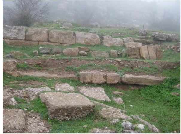
Εδώλια του θεάτρου σε λεπτομέρεια

Η διάμετρος του κοίλου υπολογίζεται σε 44μ. Τα εδώλια αποτελούνται από τον εξαιρετικά ευπαθή ψαμμίτη λίθο. Αυτά δεν εδράζονταν απευθείας στο χώμα, αλλά σε υποθεμελίωση από πλακοειδείς λίθους. Στη χαμηλότερη σειρά ήρθε στο φως τμήμα δύο θρόνων της προεδρίας. Το θέατρο, όπως δείχνει η ελληνοιστική κεραμική που αποκαλύφθηκε, χτίστηκε τον 3 ο -2 ο αι. π.Χ. Νότια του θεάτρου καθαρίστηκε από τη βλάστηση μεγάλο δημόσιο κτίσμα της αρχαίας πόλης, όπως και τμήμα ενός δεύτερου κτιρίου αμέσως βόρεια του πρώτου σε κακή κατάσταση διατήρησης.