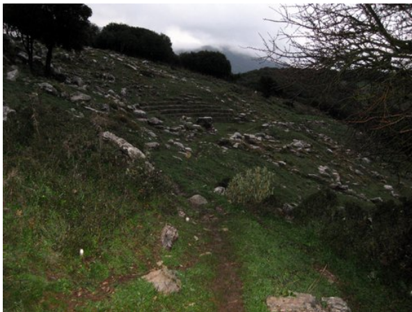
Το θέατρο του Λεοντίου