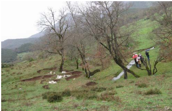
Απόψεις του κούλου του θεάτρου

Το αρχαίο θέατρο χωροθετείται ΝΔ της πόλης και απέδωσε ενδείξεις ύπαρξης διαζώματος. Ήταν κτισμένο σε τεχνητό λόφο και δέσποζε στην αρχαία πόλη.