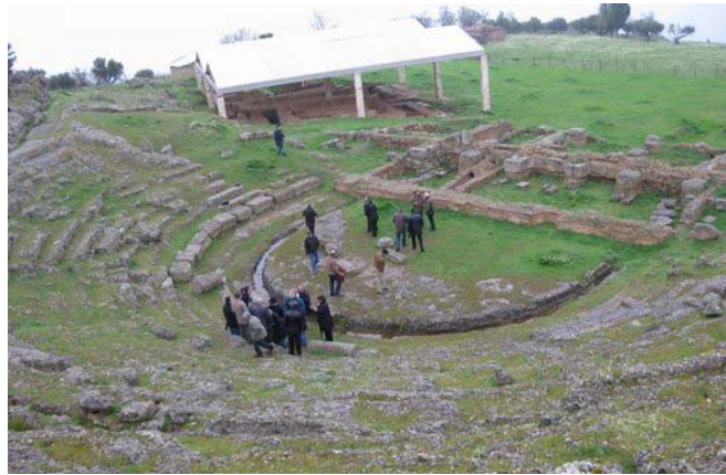
Θέατρο και περιβάλλον χώρος

Η περίοδος από την ίδρυση της Αχαϊκής Συμπολιτείας (281/280 π.Χ.) έως περίπου το 230 π.Χ. ήταν εποχή ευημερίας και πολιτικής σταθερότητας, γεγονός που ευνόησε την πραγματοποίηση ενός μεγαλόπνοου οικοδομικού προγράμματος στην πόλη. Το πρόγραμμα αυτό περιλάμβανε και την ανέγερση του θεάτρου και των ναών γύρω του. Μεταγενέστερες επισκευές κατά το 2 ο και 1 ο αι. π.Χ. είναι περιορισμένες έκτασης και έχουν σχέση με την απορροή των ομβρίων υδάτων.