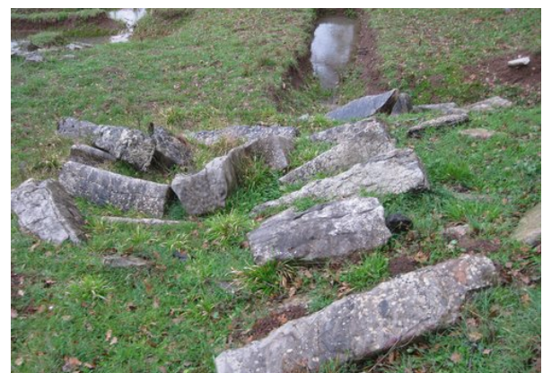
Αρχαίο οικοδομικό υλικό

Προφανώς κτίστηκε κατά τους ελληνιστικούς χρόνους. Στους ρωμαϊκούς χρόνους, έχει ήδη αρχίσει η λεηλασία του δομικού του υλικού. Έχουν γίνει αρκετές δοκιμαστικές ανασκαφικές τομές στο χώρο του θεάτρου, οι οποίες έχουν δώσει ενθαρρυντικά αποτελέσματα. Επίσης έχει αποκαλυφθεί τμήμα του αρχαίου οικοδομικού υλικού του θεάτρου.