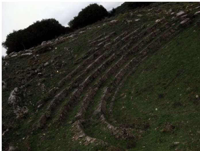
Άποψη του αρχαίου θεάτρου

Το 1958 ο αρχαιολόγος Ν. Γιαλούρης έφερε στο φως με την ανασκαφή του το αρχαίο θέατρο του Λεοντίου.