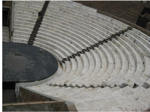
Το κοίλο του Ωδείου

Το Ωδείο, έχει όλα τα βασικά μέρη του θεάτρου, κοίλο, ορχήστρα, προσκήνιο, σκηνή, παρασκήνια. Το κοίλο έχει τέσσερις κερκίδες εδωλίων κάτω του διαζώματος και επτά άνω. Στις 23 σειρές καθισμάτων του, δύναται να φιλοξενηθούν 2.300 θεατές.