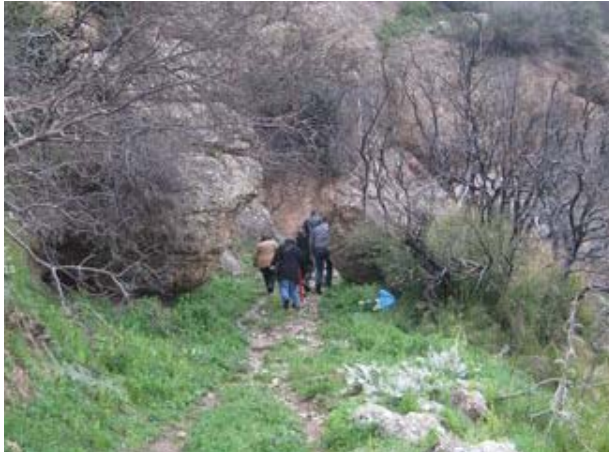
Η ανάβασή μας