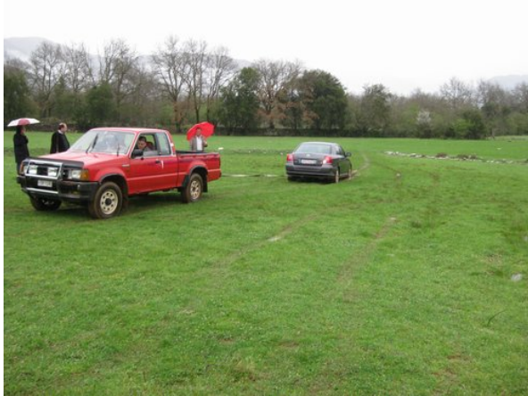
Το αυτοκίνητο που κόλλησε

Πρόθεση του «ΔΙΑΖΩΜΑΤΟΣ» είναι να συνταχθεί ένας πλήρης χορηγικός φάκελος για το μνημείο, προκειμένου να προχωρήσουμε στην εξεύρεση πόρων, οι οποίοι θα διασφαλίσουν την πλήρη αποκάλυψη του μνημείου.