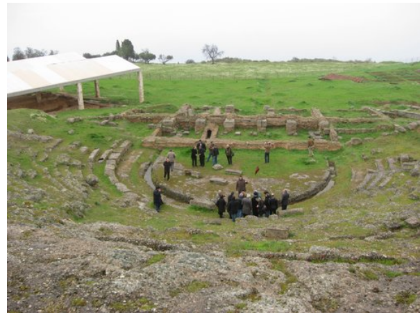
Άποψη του θεάτρου

Ένα από τα σημαντικότερα μνημεία της πόλης, αν και δεν αναφέρεται από τον Πausανία το 2 ο αι. μ.Χ., είναι το αρχαίο θέατρο. Κτισμένο στη βόρεια πλαγιά τεχνητού λόφου και εν μέρει λαξευμένο στο φυσικό βράχο το θέατρο ατενίζει το γαλάζιο της θάλασσας.