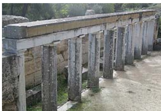
Τα τρίγλυφα και μετόπες

Το προσκήνιο, ένα μοναδικό δείγμα διατήρησης της πρόσοψης του ελληνικού προσκηνίου, έχει κομψή πρόσοψη με οκτώ λεπτούς δωρικούς μαρμάρινους, ημικίονες που συνδέονται με πεσσούς και επιστήλια. Στα επιστήλια υπάρχουν τρίγλυφα και μετόπες. Στα κενά μεταξύ των ημικίωνων αναρτούσαν τις ζωγραφικές σκηνογραφίες. Κοντά στην περιφέρεια της σκηνής ήταν αναρτημένοι πέντε μαρμάρινοι θρόνοι, οι οποίοι έφεραν επιγραφή. Οι θρόνοι προστέθηκαν στην περίοδο του Σύλλα.