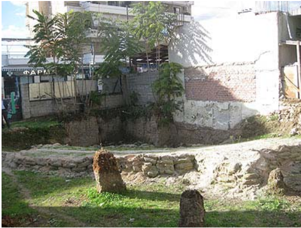
Σημερινή εικόνα θεάτρου

Από τον αρχαίο δήμο έχουν αποκαλυφθεί τμήματα των οικιών, τμήμα του οδικού δικτύου που συνέδεε το δήμο με το Άστυ και τους γειτονικούς δήμους. Οι περισσότερες πληροφορίες προέρχονται αντλούνται από τα κτερίσματα των τάφων και των νεκροταφείων, τα οποία έχουν ανασκαφτεί στην περιοχή. Περιφημος είναι ο θολωτός μυκηναϊκός τάφος, ο οποίος εντοπίστηκε στο νοτιοανατολικό τμήμα του δήμου.