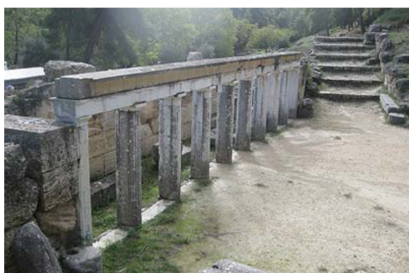
Λεπτομέρεια του προσκηνίου