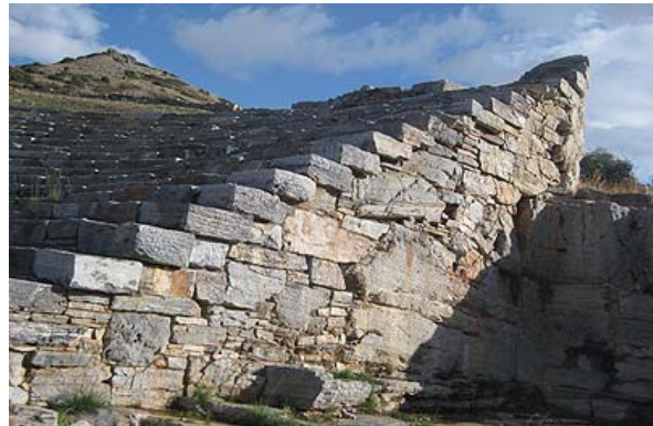
Το ανατολικό τμήμα του μνημειώδους αναλημματικού τοίχου

Το θέατρο του Θορικού θεωρείται το αρχαιότερο στον ελλαδικό χώρο και είναι μοναδικό για το ιδιόμορφο ελλειψοειδές σχήμα του. Κατασκευάστηκε στη φυσική αμφιθεατρική πλαγιά, στη νότια πλευρά του λόφου Βελατούρι στα τέλη του 6ου αιώνα π. Χ. Στα μέσα του 5ου αι. π. Χ. η ορχήστρα επεκτάθηκε και στα μέσα του 4ου αι. π. Χ. κατασκευάστηκε το άνω διάζωμα με ένα μνημειώδη αναλημματικό τοίχο. Δίπλα στη δυτική πάροδο ιδρύθηκε ο μικρός ναός του Διονύσου. Στην ανατολική πλευρά του υπάρχει μία μεγάλη αίθουσα, με θρανίο λαξευμένο στο βράχο, που ήταν πιθανώς τόπος συγκέντρωσης. Δίπλα στο δυτικό διάζωμα του θεάτρου υπήρχε ένα σπίτι με πεντάκλινο ανδρώνα (δωμάτιο συμποσίων) και αυλή. Το χωρίζει από το θέατρο ένα στενό μονοπάτι που ανηφορίζει στην πλαγιά.