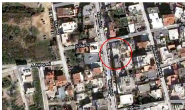
Στον παραπάνω χάρτη υποδηλώνεται με κόκκινη επισήμανση η θέση του αρχαίου θεάτρου.

Η ορχήστρα και η σκηνή του θεάτρου βρίσκονται κάτω από το οδόστρωμα της οδού Σαλαμίνας. Τα εδώλια έχουν θεμελιωθεί στο ελαφρώς επικλινές προς τα ανατολικά έδαφος. Μεταξύ της ορχήστρας και της προεδρίας υπήρχε αποστραγγιστικός αγωγός. Εντοπίστηκε επίσης μικρό τμήμα του διαζώματος και η πρώτη βαθμίδα του επιθέατρου.