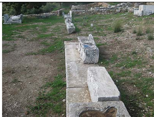
Άποψη των προεδριών

Μέσα στο αρχαίο φρούριο του Ραμούντα στα πόδια της ακρόπολης βρίσκεται το ιδιότυπο για την απλή μορφή του θέατρο, το οποίο χρησίμευε αρχικά ίσως ως χώρος συνάθροισης των πολιτών, ή βουλευτήριο. Ως κοίλο χρησιμεύει η ομαλή πλευρά του λόφου και ως ορχήστρα η επίπεδη έκταση μπροστά από τους θρόνους της προεδρίας, οι οποίοι αποτελούν και το μόνο αρχιτεκτονικό στοιχείο. Σύμφωνα με επιγραφή ήταν αφιερωμένο στο Διόνυσο, του οποίου ο ναός ήταν κοντά. Στην όψη των πέντε θρόνων, από τους οποίους σήμερα σώζονται μόνο τρεις, είναι χαραγμένη επιγραφή. Την ύπαρξη του θεάτρου μαρτυρούν ψηφίσματα χαραγμένα σε στήλες, τα οποία αναφέρουν ως τόπο ίδρυσης των στηλών το θέατρο.