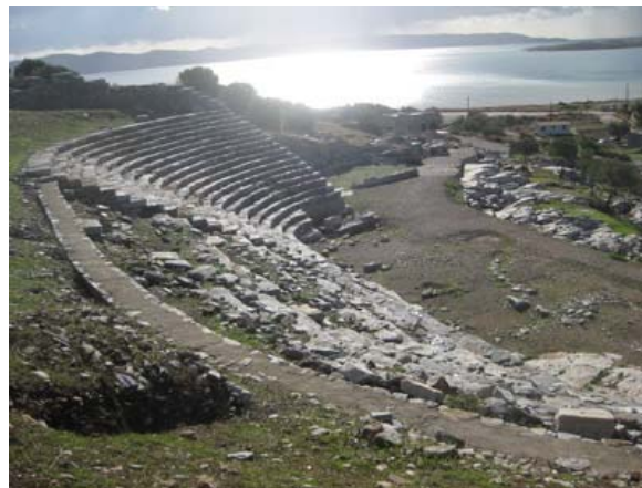
Άποψη του θεάτρου, όπου φαίνεται τόσο το αναστηλωμένο ανατολικό πέταλο, όσο και το υπόλοιπο τμήμα του θεάτρου που χρειάζεται αναστήλωση

Ήδη το ανατολικό πέταλο έχει αναστηλωθεί και πρέπει να ακολουθήσουν οι εργασίες στο κεντρικό τμήμα και στο δυτικό πέταλο του θεάτρου.