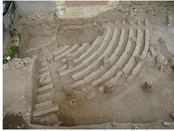
Φωτογραφία του θεάτρου στη φάση αποκάλυψής του