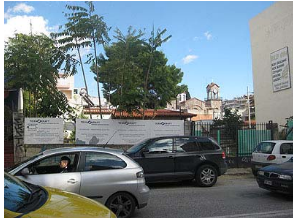
Κάλυψη του θεάτρου για λόγους προστασίας

Οι ανασκαφικές εργασίες στο θέατρο των Αχαρνών έχουν προς το παρόν διακοπεί, έως ότου ολοκληρωθεί η απαλλοτρίωση του γειτονικού οικοπέδου. Η άποψη του Διαζώματος είναι ότι η οδός Σαλαμίνας πρέπει να πεζοδρομηθεί, προκειμένου να διευκολυνθούν οι ανασκαφές. Η ωφέλεια θα είναι πολλαπλή, αφού ο Δήμος Αχαρνών θα στείλει ένα μήνυμα στους Δημότες του για την αξία του μνημείου, αλλά παράλληλα θα αναβαθμισθεί πολεοδομικά ο κεντρικός πυρήνας της πόλης.