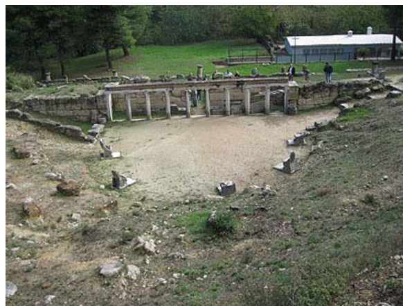
Άποψη του θεάτρου

Το ορθογώνιο θέατρο χρονολογείται τον 4 ο αι. π. Χ. Το κοίλο και το σκηνικό οικοδόμημα κατασκευάστηκαν τον 3 ο αι. π. Χ., το μαρμάρινο προσκήνιο προστέθηκε περί το 200 π. Χ. και άλλες επεμβάσεις έγιναν περί το 150 π. Χ. Το θέατρο κτίστηκε με τις προσφορές των προσκυνητών, οι οποίοι συνέρρεαν στο θεραπευτήριο του Αμφιάραου. Εκεί ετελούντο, επίσης, τα μεγάλα Αμφιάρεια, ή Αμφιαράεια. Το «κοίλον» του θεάτρου ήταν σκαμμένο στην πλαγιά του λόφου. Από αυτό σώζονται ακόμη τα πώρινα θεμέλια για τα ξύλινα εδώλια. Ενώ τα εδώλια του κοίλου φαίνεται πως παρέμειναν ξύλινα, οι τοποθετημένες μέσα στην ορχήστρα προεδρίες ξεχώριζαν για την πολυτέλεια και τον πλούσιο στολισμό τους.