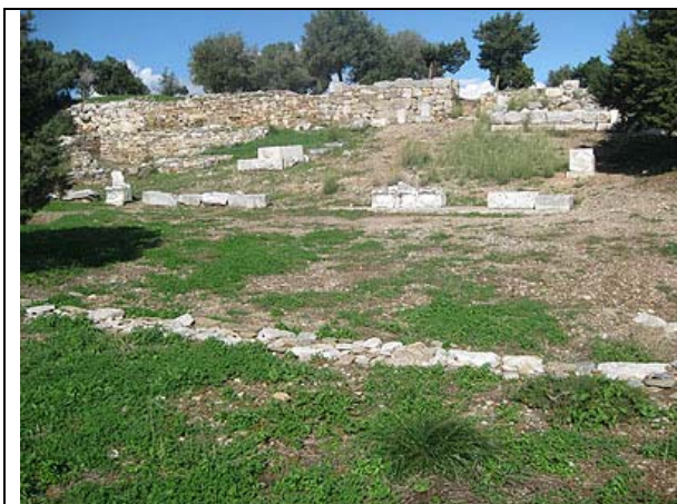
Άποψη του θεάτρου