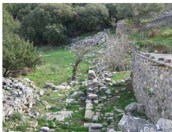
Απόψεις του αρχαιολογικού χώρου της αγοράς