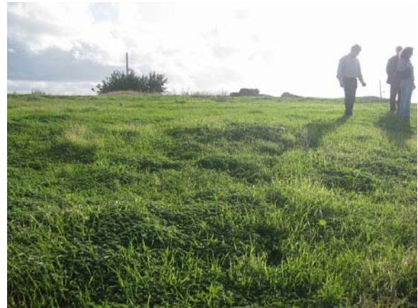
Άποψη του κοίλου

Οι περιηγητές που επισκέφθηκαν την πόλη από το 16 ο έως και το 19 ο αιώνα ανέφεραν την ύπαρξη δύο θεάτρων, ενός μεγάλου και ενός μικρότερου - αμφιθεάτρου, «ναυμαχίας» και θερμών, αλλά και εντυπωσιακών αρχιτεκτονικών μελών και αγαλμάτων.