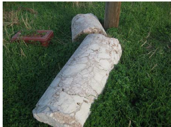
Αρχιτεκτονικά μέλη θεάτρου