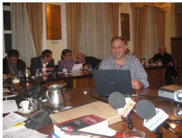
Στιγμιότυπο από τη συνεδρίαση του δημοτικού συμβουλίου Σπάρτης

Αμέσως μετά επιστρέψαμε στο δημαρχείο της Σπάρτης για την καθιερωμένη συνέντευξη τύπου και το απόγευμα παρευρεθήκαμε στην συνεδρίαση του δημοτικού συμβουλίου, όπου μας υποδέχθηκαν πολύ θερμά ο πρόεδρος και τα μέλη του δημοτικού συμβουλίου και είχαμε μια πολύ ζωντανή και ουσιαστική συζήτηση για τα όνειρα του «ΔΙΑΖΩΜΑΤΟΣ».