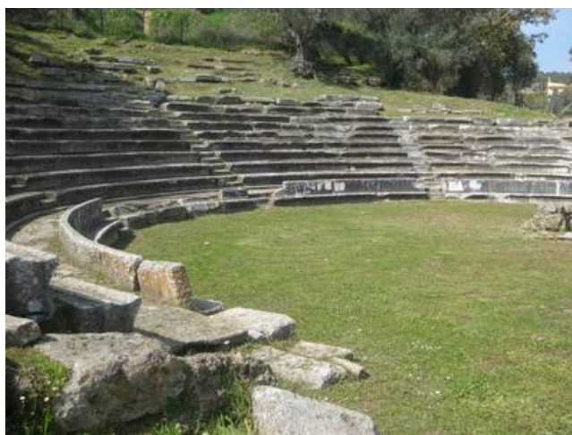
Το κοίλον και οι προεδρείες

Το κοίλο του θεάτρου σώζεται σε σχετικά καλή κατάσταση, αν και ορισμένα από τα εδώλια είναι κατά τόπους αποκρουσμένα, ενώ αυτά που βρίσκονται στο ανώτερο σωζόμενο τμήμα του κοίλου έχουν μετακινηθεί από την αρχική τους θέση. Ωστόσο η σημερινή μορφή του μνημείου είναι διαφορετική από εκείνη της εποχής της ανασκαφής. Από τη σκηνή σώζονται μόνο τα θεμέλια του πρόσθιου τοίχου ενώ από τα παρασκήνια δεν διασώζεται τίποτα. Στο κέντρο του χώρου της θυμέλης υπάρχει μεταγενέστερο πηγάδι.