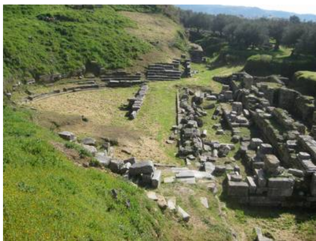
Η σημερινή εικόνα του θεάτρου

Η κατάσταση του μνημείου είναι κακή, κυρίως διότι το κοίλο κτίστηκε πάνω σε επιχώσεις, και μεγάλο μέρος του καταστράφηκε για την οικοδόμηση βυζαντινών σπιτιών και εργαστηρίων σε όλη του την έκταση. Πολλά μάρμαρα από τους αναλημματικούς τοίχους αφαιρέθηκαν από τον ιδιοκτήτη του χώρου ως οικοδομικό υλικό για τα σπίτια της σύγχρονης πόλης γύρω στα 1870, ενώ το 1933 διαλύθηκε μεγάλο μέρος του δυτικού αναλημματικού πύργου για την κατασκευή της Δεξαμενής Ύδρευσης στην κορυφή του λόφου.