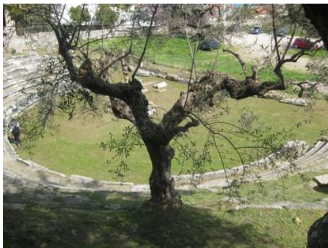
Άποψη του θεάτρου του Γυθείου

Το μνημείο ανασκάφηκε το 1891 από τον Ανδρέα Σκιά. Τότε ήρθε στο φως σχεδόν ολόκληρο το μνημείο, εκτός από το πίσω μέρος της σκηνής.