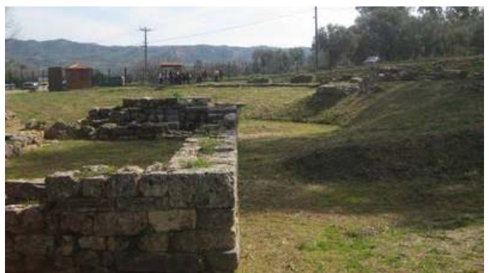
Διακρίνεται μπροστά ο ναός που περικλείεται από το αμφιθέατρο