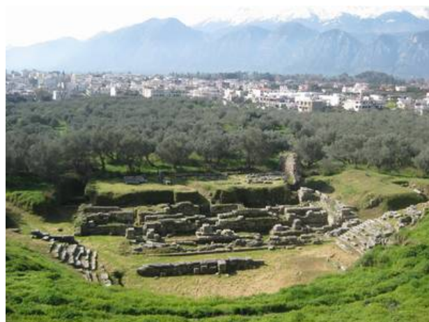
Άποψη του θεάτρου της Σπάρτης. Στο βάθος ο χιονισμένος Ταύγετος.

Το θέατρο βρίσκεται στη νότια κλιτύ της Ακρόπολης και διασώζει στοιχεία από πολλές διαφορετικές φάσεις: η κατασκευή που σώζεται σήμερα ανάγεται στα ύστερα Ελληνιστικά χρόνια, ενώ υπάρχουν και πολλά άλλα επί μέρους στοιχεία που χρονολογούνται μέχρι και το τέλος του 4 ου μ.Χ. αιώνα.