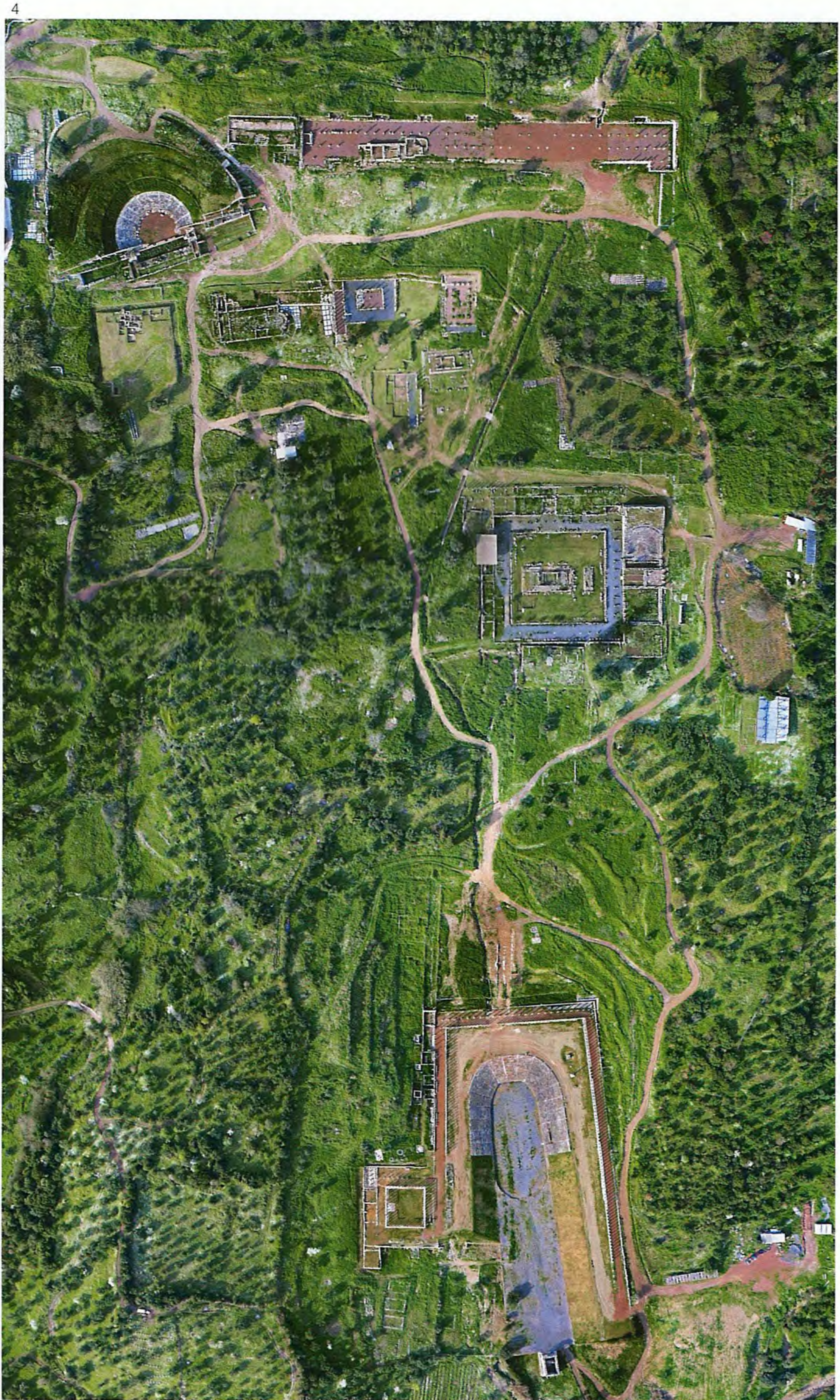
4. Γενική άποψη του αρχαιολογικού χώρου της αρχαίας Μεσσήνης. Φωτ. Κώστας Ξενικάκης