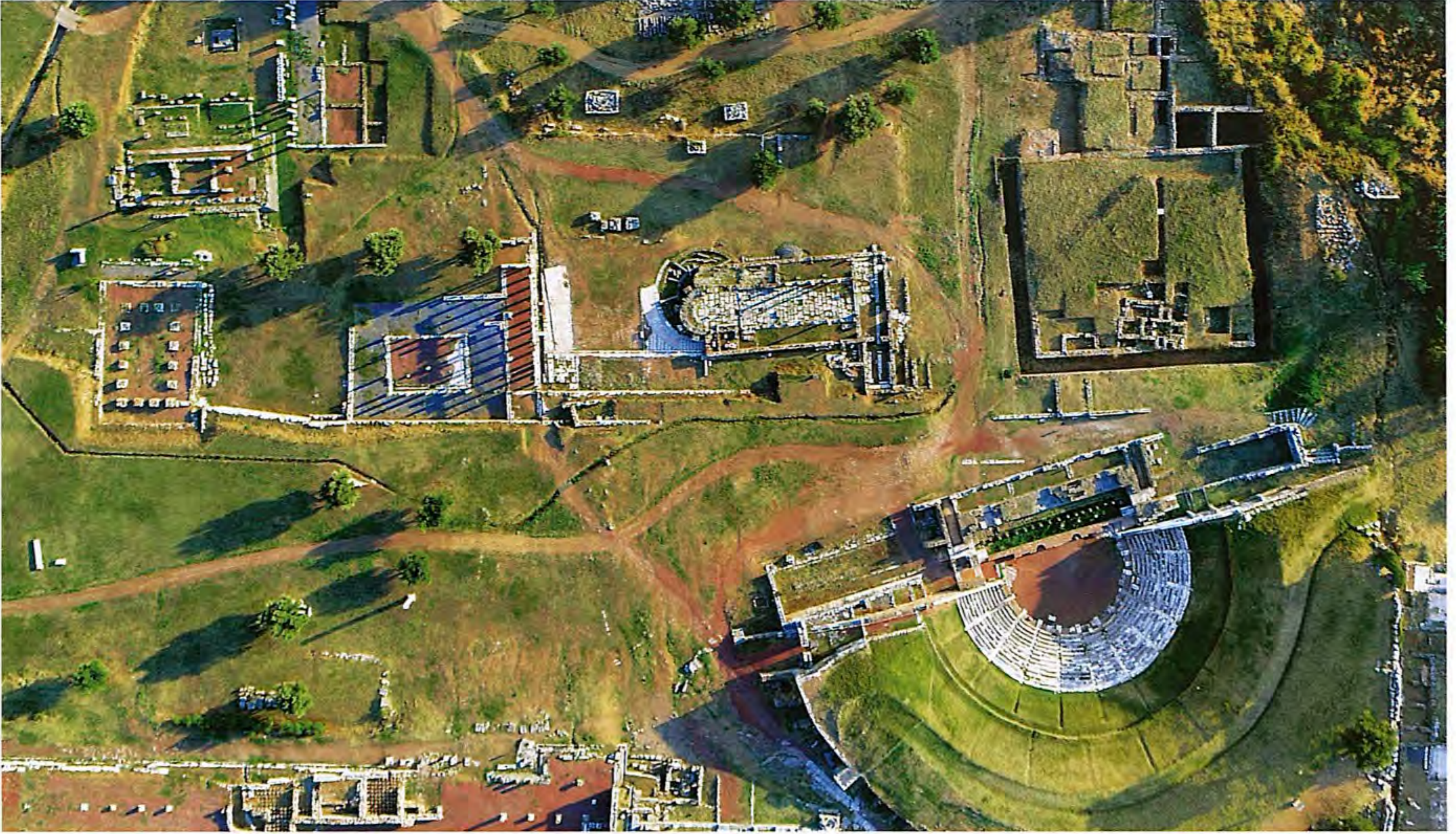
6. Το Θέατρο της αρχαίας Μεσσήνης και νότια αυτού το Βουλευείο, το Κρεπωλείο, η παλαιοχριστιανική βασιλική και το Ιερό της Ίσιδος και του Σαράπιδος.

Η λειτουργία του μνημειακού συνόλου της αρχαίας μεσσηνιακής πρωτεύουσας και το άνοιγμα στο ευρύ κοινό έχει προσφέρει σημαντικές δυνατότητες τοπικής ανάπτυξης, τόνωση του ενδιαφέροντος της τοπικής κοινωνίας για την πολιτιστική της κληρονομιά και εγγύηση ότι αυτή η κληρονομιά θα κρατήσει τη δυναμική της και θα διατηρηθεί αλώβητη για τις επόμενες γενιές μέσα στο πνεύμα της αειφόρου ανάπτυξης 8 .