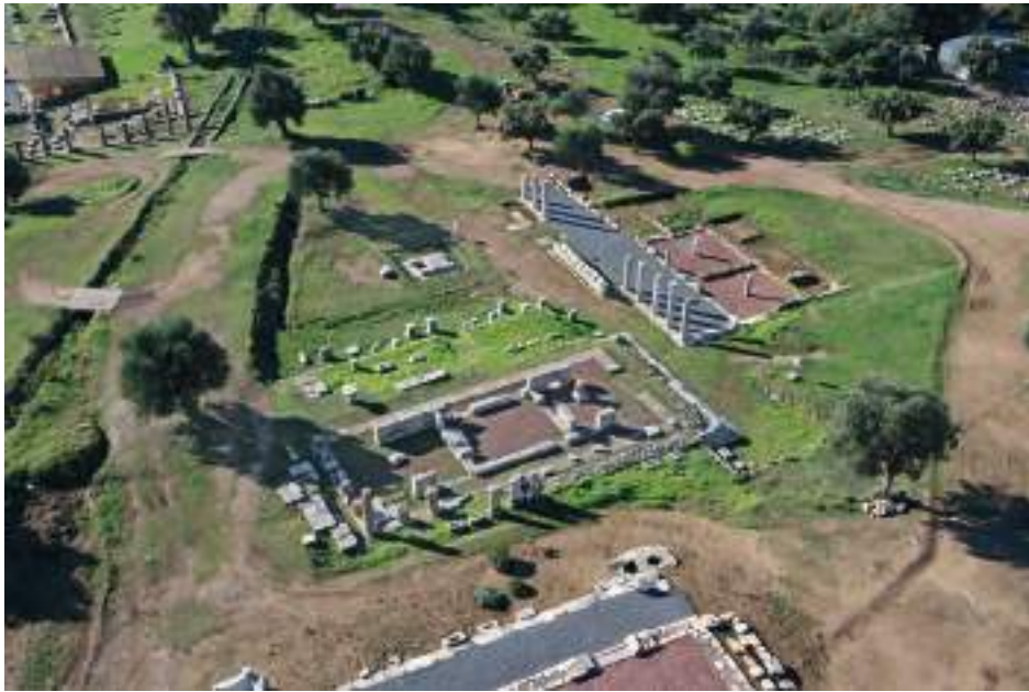
Fig. 2 — Aerial view of the Messana temple and the buildings around.

The sanctuary of Messana comprises a peripteral Doric temple, 11.016 × 22.536 m, with six columns on the short and twelve on the long sides dedicated to the deified mythical queen of the land who gave her name to the capital of liberated Messenia (Paus. 4.32.1) (fig. 2). The temple of the goddess was founded in the late 4th century BC and continued to function to the late 4th century AD as a sacred place of great importance for the social, political and economic life of the new city. It was excavated during the years 2002 to 2012 while its architectural study was published in 2016. 4 On the west front of the temple a podium of five preserved steps of a high crepis , rather unusual for Doric temples, was constructed to adjust the difference of the temple floor level to the ground level on the west. 5