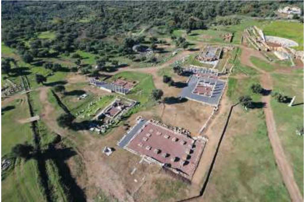
Fig. 6 — General view of the central agora area.

pots and consequently deposited into the well. 26 For our immature remains is suggested that the risks of pregnancy and childbirth (affecting the mother and/or the infant) should be considered as the most plausible explanation. 27 Scholars suggest different social attitudes towards the burial of infants associated with the time that children are accepted as full members of the society at the age of 3. 28 It can be argued that the non-adults recovered from the well were initially buried in pots and amphorae at a specific burial ground, which presumably at a point changed its use and the pot burials were transported and re-deposited into the well. 29 Of importance is the association of dogs with childbirth. 30 The mythical dog seems to be a medium on the border between