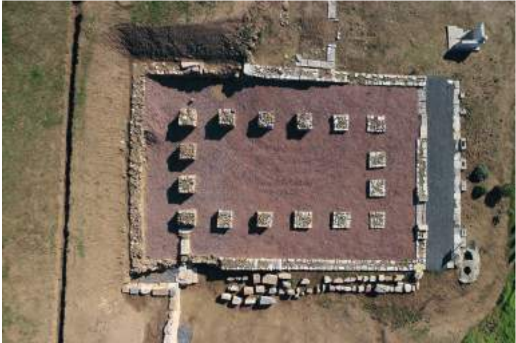
Fig. 5 — Aerial view of the Bouleion .

A row of six bases for the support of inscribed stelae were uncovered along the south colonnaded vestibule of the Bouleion , opposite the north side of the Messana temple (fig. 5). Two of the stelae carry decrees of 61 and 93 verses respectively edited by the cities of Smyrna and Demetrias in Thessaly paying honors to Messenian judges. They date to the middle of the 2nd century BC. 17