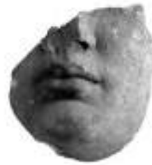
Fig. 4 — Lower part of the marble head of Messana’s cult statue.

The “chrysolith” cult statue of the goddess Messana was made of gold and Parian marble, according to Pausanias; fragments of the garment and the head were brought to light (fig. 4). On the back wall of the cella (5.175 m wide) was a painting made by the painter Omphalion, pupil of the famous Athenian painter Nicias whose floruit dates to the late 4th century BC. 12 In the painting the following figures were represented: Kresphontes, one of the leaders of the Dorian invasion who, according to legend, had gained Messenia by lot, and thirteen figures of the Messenian pre-Dorian royal house. According to the local “messenian story”, Asklepios was depicted as son of Arsinoe, one of the daughters of king Leukippos, not as son of Koronis, daughter of Phlegyas; 13 Asklepios appeared primarily as a Messenian king, as a “Messenian citizen”, a political figure which accords well with the character of the Asklepieion complex which functioned not only as a sacred precinct but also as a political agora. 14