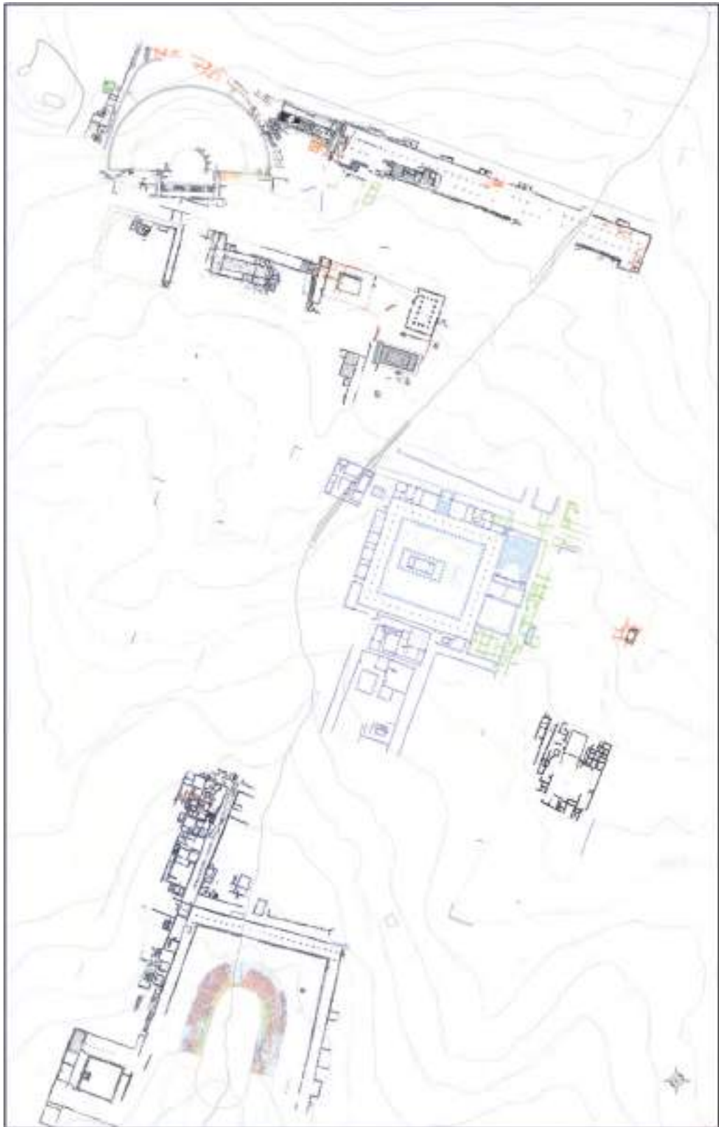
Fig. 1 — Ground plan of the agora area.