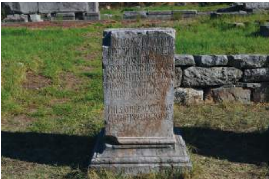
Fig. 3a — Base for the statue of Marc Aurel.