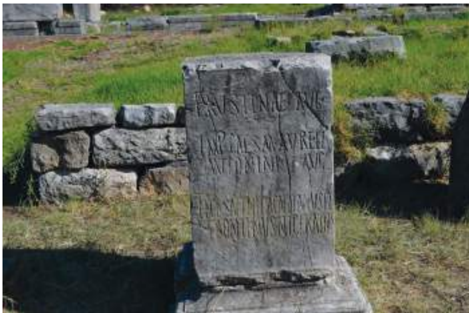
Fig. 3b — Base for the statue of Faustina the Elder.