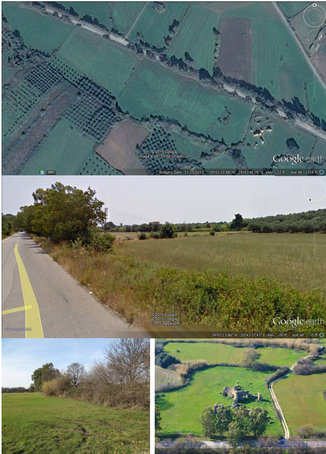
Εικόνα 2. Η θέση της Πρόσβασης Α. Αεροφωτογραφία και απόψεις της περιοχής χωροθέτησης.