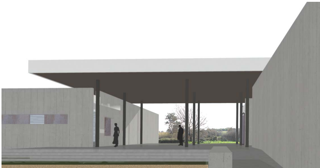
Εικόνα 5. Προοπτικές απεικονίσεις της εισόδου των επισκεπτών.