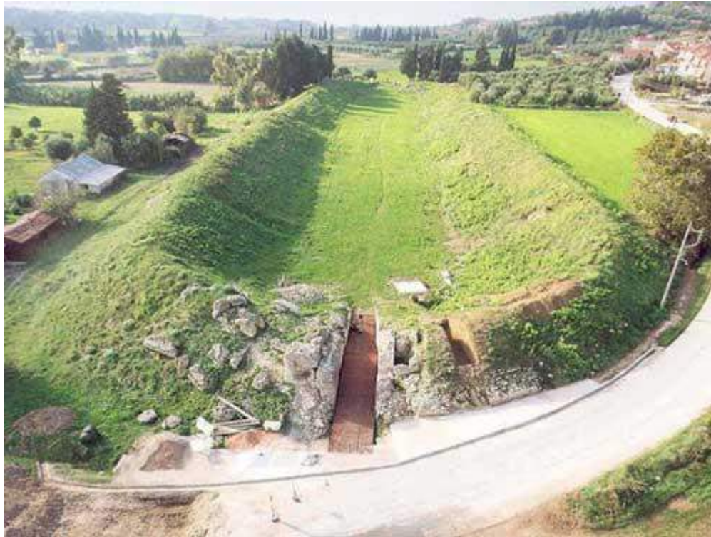
Αρχαίο Στάδιο Νικόπολις – Σήμερα