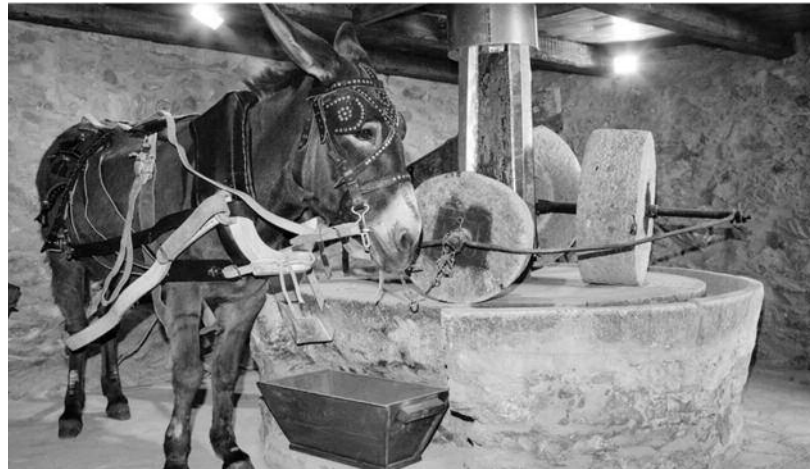
Το αλώνι με τον γαίδαρο που έκοβαν τις ελιές

Μετά τις φορτώναμε τσουβάλια στα άλογα και τις κουβαλούσαμε στο σπίτι. Εδώ άρχιζε η μερική επεξεργασία του καρπού. Άρχιζε το λιγνισμα. Πετούσαν τον ελαιόκαρπο