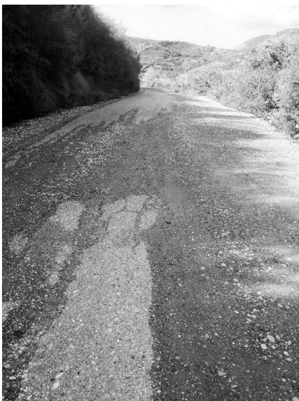
Ο δρόμος σήμερα

Η Περιφέρεια Δυτικής Ελλάδας θα θέσει άμεσα