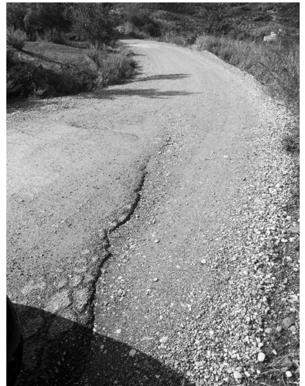
Μια άλλη φωτογραφία του δρόμου