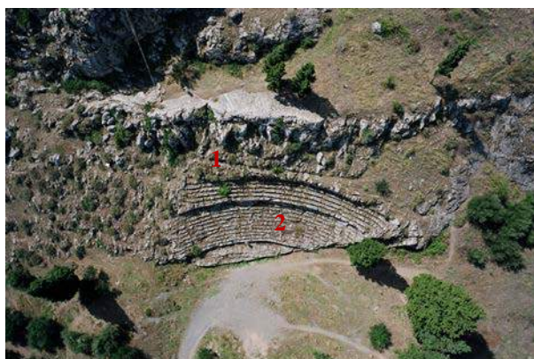
Αεροφωτογραφία του θεάτρου της Χαιρώνειας. Στο επάνω τμήμα του (1) είναι ακόμη εμφανή τα ευθύγραμμα εδώλια του αρχικού, πρώιμου θεατρικού χώρου. Αργότερα ο βράχος λαξεύτηκε βαθύτερα προκειμένου να δημιουργηθεί ημικυκλικό κοίλο (2).

Το θέατρο -σε μια ιδιαίτερα απλή μορφή- ήταν σε χρήση τουλάχιστον από τα τέλη 5 ου αι. π.Χ. Τα εδώλια (=καθίσματα) είχαν σκαλιστεί πάνω στον σκληρό, γκρίζο βράχο σε 8-10 ευθύγραμμες σειρές, μήκους 37 περίπου μ. και μπορούσαν να φιλοξενήσουν 500 περίπου θεατές. Σε αυτήν την φάση ο χώρος ίσως χρησιμοποιήθηκε γενικά για συναθροίσεις πολιτών και όχι μόνο για θεατρικές παραστάσεις. Με την ίδια μορφή το μνημείο εξακολούθησε να λειτουργεί όλον σχεδόν τον 4 ο αι. π.Χ.