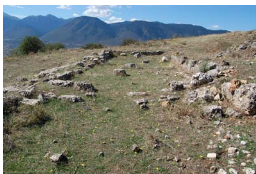
Ναός Αρτεμης Μεσοπολίτιδος.

Το πιο γνωστό, όμως, μνημείο της Αγοράς του Ορχομενού είναι το Θέατρο, το οποίο καταλαμβάνει τμήμα της ανατολικής πλαγιάς του λόφου.