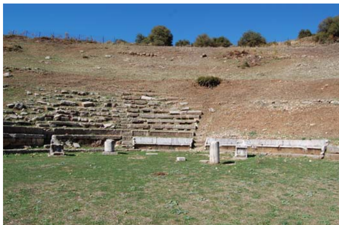
Άποψη του κεντρικού τμήματος του κοίλου.

του θα ήταν χαραγμένο σε ένα από τα μη σωζόμενα έδρανα), γιου του Επιγένους, ο οποίος είχε διατελέσει αγωνοθέτης, δηλαδή υπεύθυνος αξιωματούχος για την διοργάνωση και διεξαγωγή δραματικών αγώνων προς τιμήν του θεού Διόνυσου.