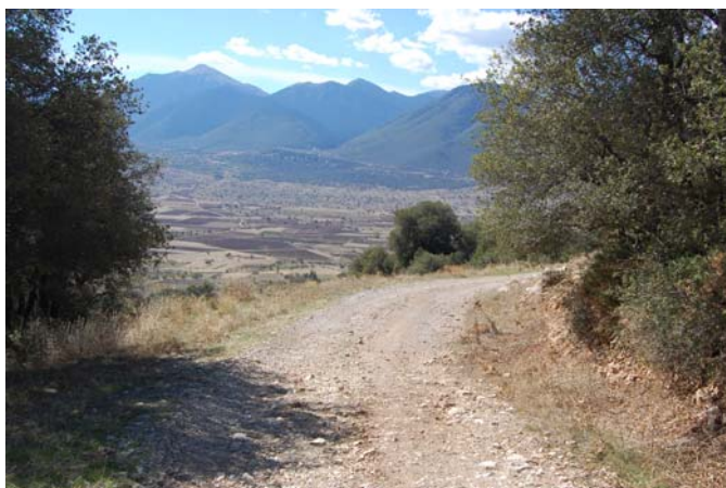
Ο δρόμος πρόσβασης στον αρχαιολογικό χώρο.

Εξάλλου το γεγονός ότι η βλάστηση αναπτύσσεται συχνά ανάμεσα στο οικοδομικό υλικό των μνημείων έχει επιβαρύνει την ευστάθειά τους.