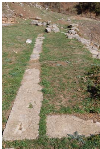
Ο στυλοβάτης του προσκηνίου.