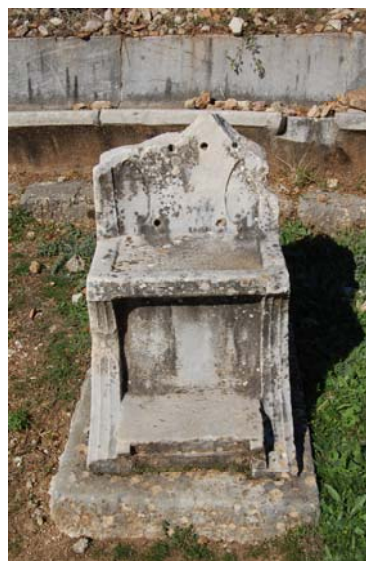
Ο ένας από τους δύο μαρμάρινους θρόνους. Εμφανείς είναι οι οπές στην πλάτη.

Πιο κοντά στο κέντρο της ορχήστρας σώζεται τμήμα αράβδωτου κίονα χωρίς βάση. Δεν είναι γνωστή η λειτουργία του αλλά ούτε και αν αυτή είναι η αρχική του θέση.