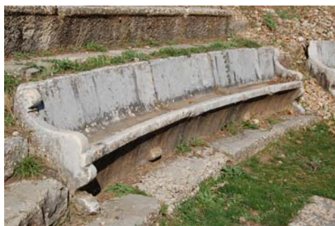
Ένα από τα καθίσματα της προεδρίας.

του θα ήταν χαραγμένο σε ένα από τα μη σωζόμενα έδρανα), γιου του Επιγένους, ο οποίος είχε διατελέσει αγωνοθέτης, δηλαδή υπεύθυνος αξιωματούχος για την διοργάνωση και διεξαγωγή δραματικών αγώνων προς τιμήν του θεού Διόνυσου.