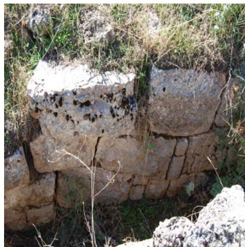
Ο λίθινος κτιστός αγωγός απορροής όμβριων υδάτων και λεπτομέρεια από την τοιχοποιία της.

Το σύστημα περιελάμβανε επίσης μικρότερους αγωγούς απορροής των υδάτων που είναι επίσης λίθινης κατασκευής. Ένας από αυτούς, πλάτους 0.20μ. περίπου, ακολουθεί πορεία παράλληλη προς το ανατολικό ανάλημμα του κοίλου σε μήκος 7μ. περίπου. Ο οχετός της ορχήστρας δεν έχει προς το παρόν αποκαλυφθεί αλλά ένα μικρό τμήμα του είναι ορατό στο νοτιοανατολικό άκρο του κοίλου.