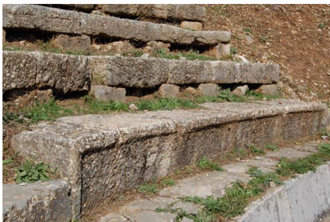
Η δεύτερη σειρά καθισμάτων σύνθετης διατομής.