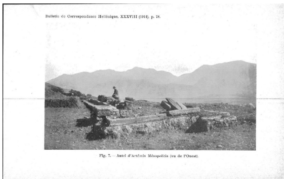
Άποψη από τα δυτικά του βωμού της Άρτεμης Μεσσοπολίτιδας

Χάρη στη λεπτομερή περιγραφή του Πausανία, τον αρχαιολογικό χώρο του Ορχομενού επισκέφθηκαν και περιέγραψαν περιηγητές του 19 ου αιώνα, όπως ο Dodwell και ο Leake. Λεπτομερή αναφορά στον οχυρωματικό περίβολο της αρχαίας πόλης πραγματοποιεί στις αρχές του 20 ου αιώνα ο Hiller von Gaertringen. Οι πρώτες και σχεδόν αποκλειστικά μοναδικές ανασκαφές στην Άνω και Κάτω Πόλη διεξήχθησαν το 1913 από τους G. Blum και A. Plassart, οι οποίοι τον επόμενο χρόνο δημοσίευσαν τα αποτελέσματα της έρευνάς τους στο άρθρο με τίτλο: “Orchomène d’ Arcadie. Fouilles de 1913. Topographie, architecture, sculpture, menus objects”, BCH 1914, σελ. 71-88, πίν. III – V.