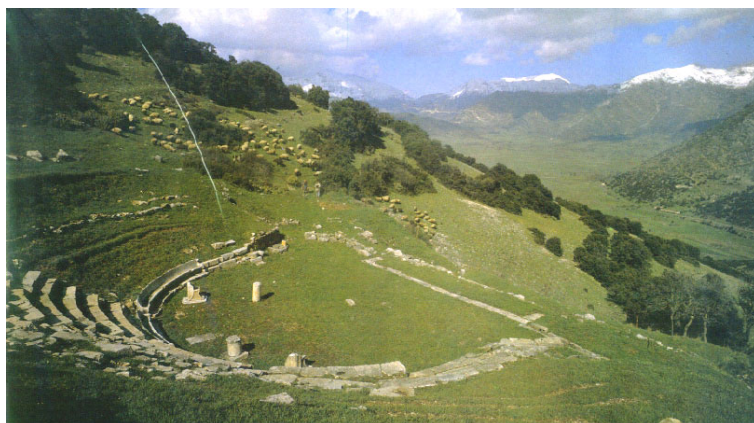
ΝΔ άποψη του Θεάτρου.