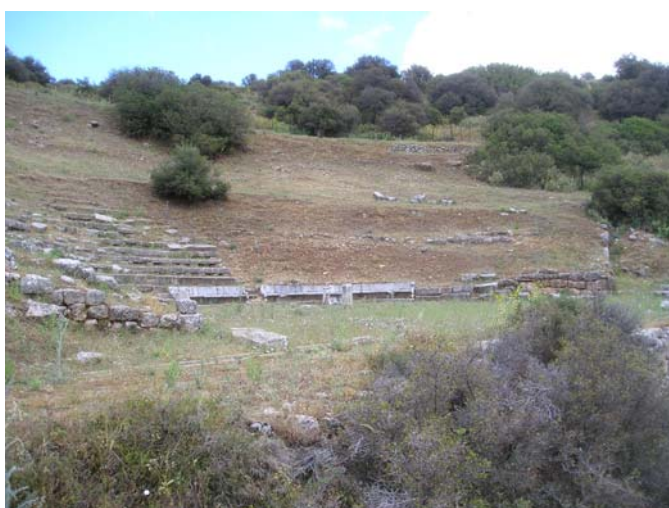
Το πρόβλημα της βλάστησης είναι έντονο σε όλη την έκταση του αρχαιολογικού χώρου. Άποψη του Θεάτρου πριν τους ετήσιους καθαρισμούς. Στο κάτω μέρος της φωτογραφίας μόλις που διακρίνεται ο αναλημματικός τοίχος της σκηνής.