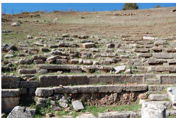
Αποψη της δεύτερης από Ν κερκίδας. Εδώ το κάθισμα της προεδρίας δε σώζεται πλέον.