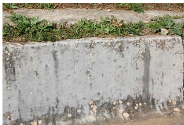
Λεπτομέρεια από την επιγραφή: [ο δεινά] Επιγένεος αγωνοθετήσας Διονύσωι .

Από επιτόπιες παρατηρήσεις προκύπτει ότι τα εδώλια της δεύτερης σειράς είναι πιο επιμελημένα από αυτά των υπολοίπων σειρών. Τα εδώλια αυτά είναι σύνθετης διατομής, αποτελούνται δηλαδή από το καθαυτό κάθισμα πάνω στο οποίο κάθετα ο θεατής και από την πλάκα του διαδρόμου που λειτουργεί ως υποπόδιο. Στην άνω επιφάνεια του κυρίως καθίσματος δεν υπάρχει η φαρδιά εγκοπή που συναντάται συνήθως κατά μήκος της οπίσθιας παρυφής του. Χαρακτηριστική επίσης είναι η πρόσθια όψη των καθισμάτων. Μία ταινία περιτρέχει την άνω οριζόντια πλευρά όλων των εδωλίων καθώς και τις εξωτερικές κάθετες πλευρές των δύο γωνιακών καθισμάτων της κάθε κερκίδας. Η επιφάνεια του λίθου παραμένει αδρά λαξευμένη και παρουσιάζει