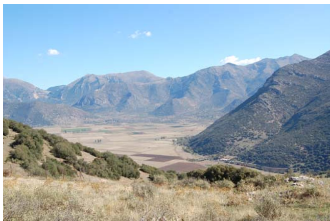
Θέα από το Θέατρο προς το δεύτερο ορχομένιο πεδίο.

Ο αρκαδικός Ορχομενός αποτελεί ένα χαρακτηριστικό παράδειγμα αρχαίας πόλης που συνδυάζει τα αμυντικά πλεονεκτήματα μίας ακρόπολης με τις δυνατότητες για επικοινωνία και ανάπτυξη της γεωργίας που προσφέρουν οι πεδινές εκτάσεις με τα ποτάμια.