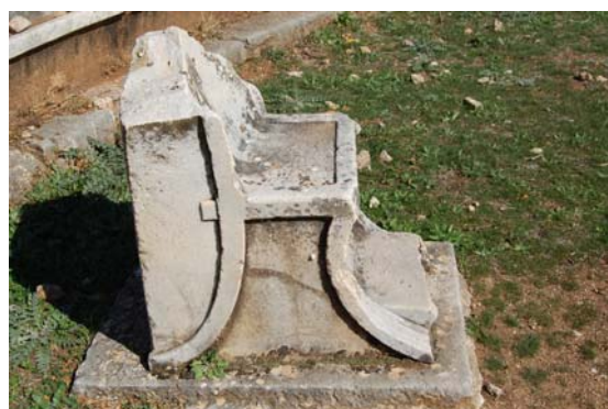
Πλάγια όψη του ίδιου θρόνου. Χαρακτηριστική η ανάγλυφη διακόσμηση, απομίμηση στοιχείων από έπιπλα.