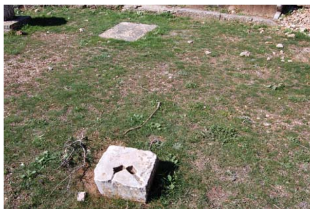
Μία από τις βάσεις των ξύλινων κιόνων του προσκηνίου.

Η σκηνή κατά τις ανασκαφές αποκαλύφθηκε στο ύψος της θεμελίωσης. Είναι ομοίως κατασκευασμένη από ασβεστόλιθο και αποτελείται από δύο παράλληλους μεταξύ τους ορθογώνιους χώρους, μήκους 13.25μ. και πλάτους 3.10 και 4.20μ. αντίστοιχα. Λόγω της απότομης κλίσης της πλαγιάς φαίνεται ότι τμήμα του συγκροτήματος της σκηνής λειτουργούσε και ως ανάλημμα.