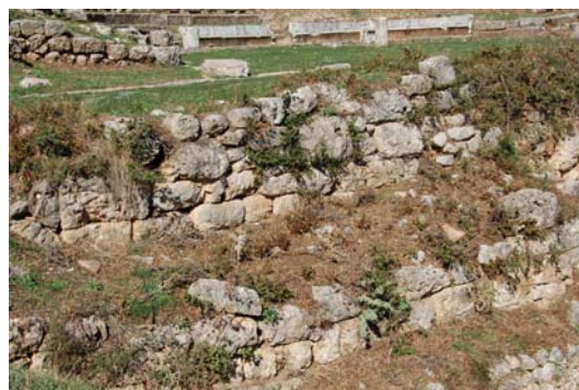
Λεπτομέρεια από την τοιχοποιία της σκηνής.

Η σκηνή κατά τις ανασκαφές αποκαλύφθηκε στο ύψος της θεμελίωσης. Είναι ομοίως κατασκευασμένη από ασβεστόλιθο και αποτελείται από δύο παράλληλους μεταξύ τους ορθογώνιους χώρους, μήκους 13.25μ. και πλάτους 3.10 και 4.20μ. αντίστοιχα. Λόγω της απότομης κλίσης της πλαγιάς φαίνεται ότι τμήμα του συγκροτήματος της σκηνής λειτουργούσε και ως ανάλημμα.