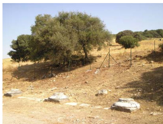
Θεμέλια του αρχαϊκού δωρικού ναού στο σημερινό χωριό του Ορχομενού.