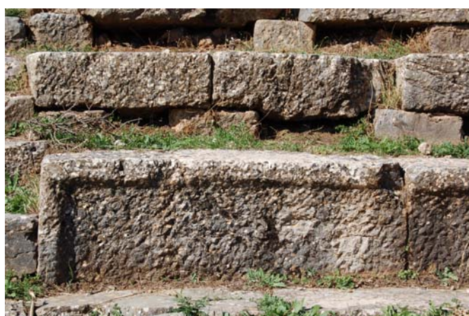
Λεπτομέρεια από τα καθίσματα της δεύτερης και τρίτης σειράς.