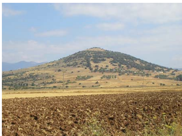
Άποψη του λόφου του Ορχομενού.