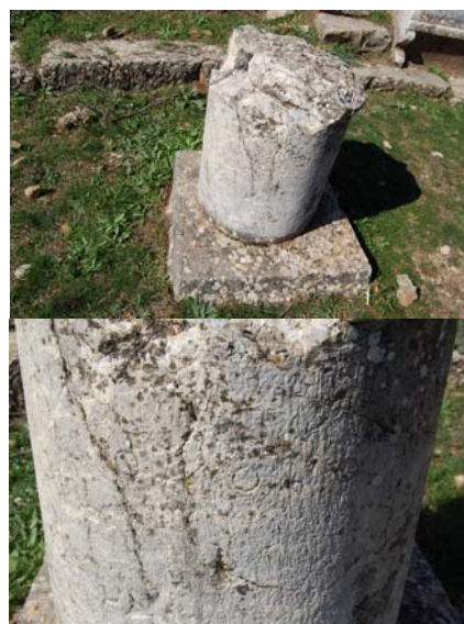
Ο βωμός που διασώζει την επιγραφή: Ομονοίας .