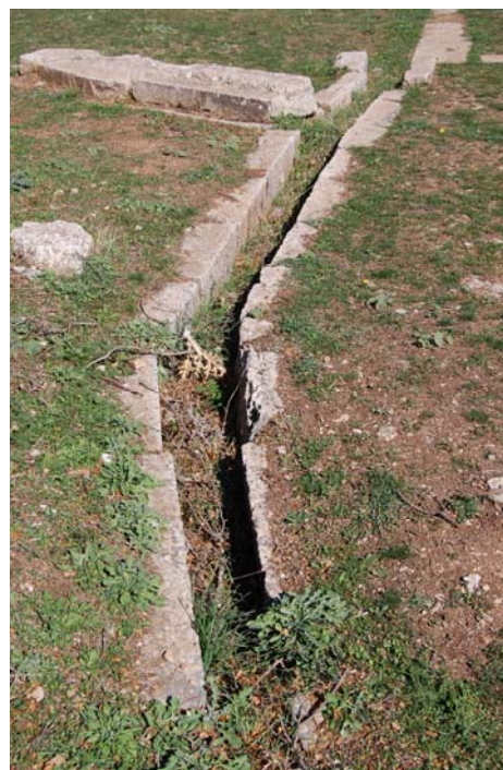
Άποψη λίθινου αγωγού αποστράγγισης υδάτων.

Το σύστημα περιελάμβανε επίσης μικρότερους αγωγούς απορροής των υδάτων που είναι επίσης λίθινης κατασκευής. Ένας από αυτούς, πλάτους 0.20μ. περίπου, ακολουθεί πορεία παράλληλη προς το ανατολικό ανάλημμα του κοίλου σε μήκος 7μ. περίπου. Ο οχετός της ορχήστρας δεν έχει προς το παρόν αποκαλυφθεί αλλά ένα μικρό τμήμα του είναι ορατό στο νοτιοανατολικό άκρο του κοίλου.