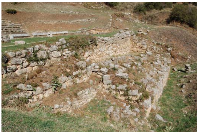
Το διάσπαρτο οικοδομικό υλικό στο χώρο της σκηνής επηρεάζει κατά πολύ την αναγωσιμότητα του μνημείου.

Εδώλια από το κοίλο του Θεάτρου έχουν πρόχειρα παρατοποθετηθεί, προφανώς για την κάλυψη αναγκών υποδοχής των θεατών σε παραστάσεις των προηγούμενων δεκαετιών.