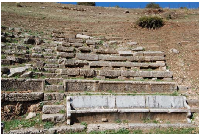
Άποψη της κεντρικής κερκίδας του Θεάτρου. Τα κατά χώραν σωζόμενα εδώλια συνυπάρχουν με διάσπαρτα ή θραύσματά τους.