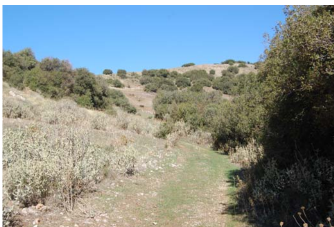
Το μονοπάτι που οδηγεί στο Θέατρο.