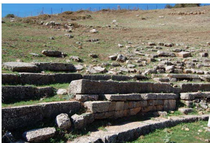
Άποψη της πρώτης από Ν. κερκίδας του Θεάτρου που παρουσιάζει έντονη εικόνα αποδιοργάνωσης.

Το ανάλημμα της ορχήστρας του μνημείου παρουσιάζει προβλήματα ευστάθειας. Την άσχημη εικόνα στο σημείο αυτό επιτείνουν και οι μεγάλοι σωροί από τα μπάζα των παλαιότερων ανασκαφών στην περιοχή του κοίλου, τα οποία αποτέθηκαν πρόχειρα στην πλαγιά όπου και το ανάλημμα της ορχήστρας.