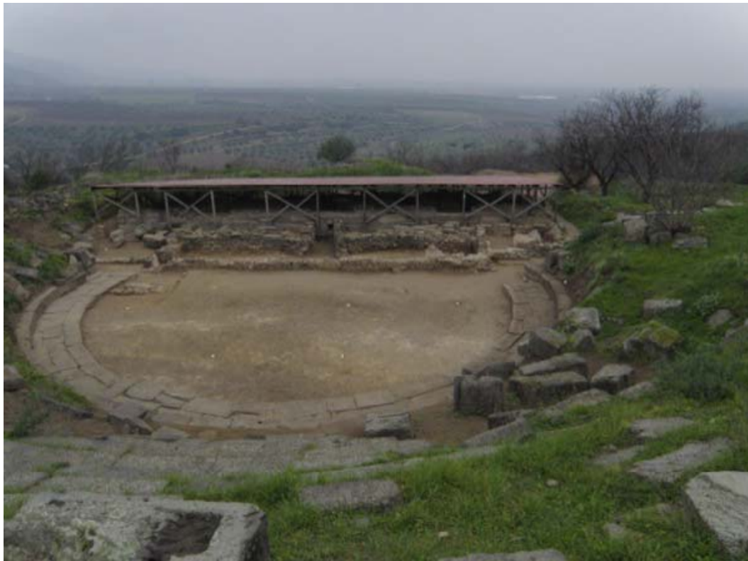
Το αρχαίο θέατρο Φθιωτίδων Θηβών . Γενική άποψη της ορχήστρας και της σκηνής από το κοίλο.