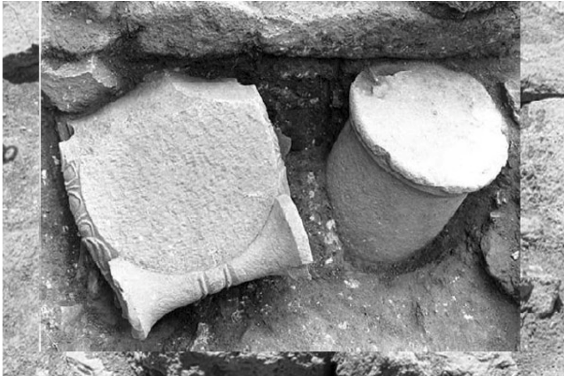
Το αρχαίο θέατρο Φθιωτίδων Θηβών . Αρχιτεκτονικά μέλη από την πρόσοψη της ρωμαϊκής σκηνής