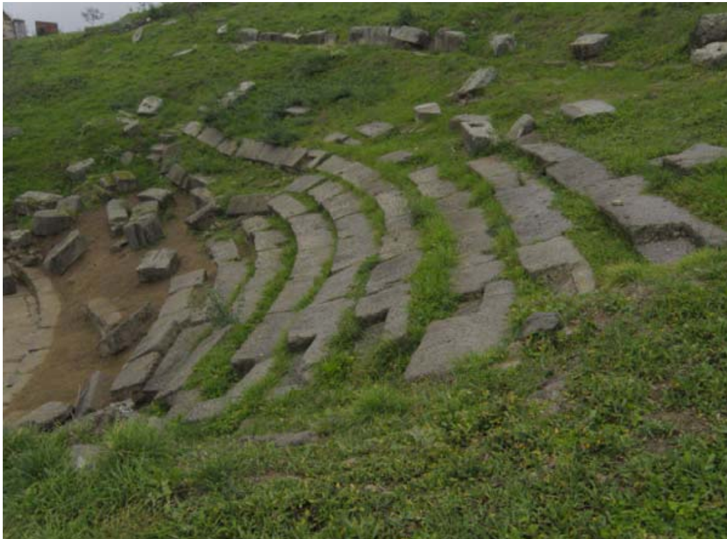
Το αρχαίο θέατρο Φθιωτίδων Θηβών . Γενική άποψη του κοίλου □ του κάτω θεάτρου