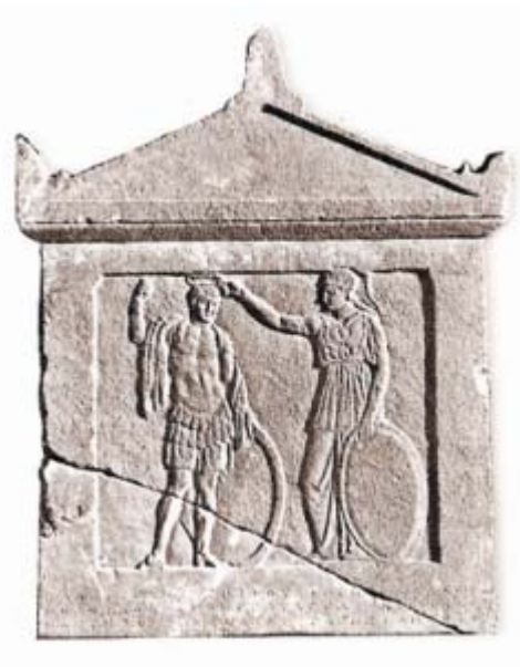
Μετόπη από ψηφισματικό ανάγλυφο με την Αθηνά και τον Άρη. 4ος αιώνας π.Χ.