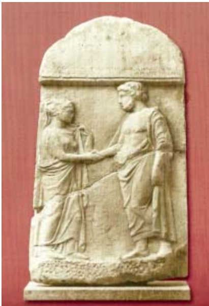
Μαρμάρινη επιτύμβια στήλη της Πατροκλέας με σκηνή αποχαιρετισμού. Βρέθηκε στις Αχαρνές. 4ος αι. π.Χ. Μουσείο Πειραιά.

* Ο επονομαζόμενος «Τύμβος του Σοφοκλή», βιβλιογραφικά γνωστός ως τύμβος της Καμβέζας, αν και ανακηρύχθηκε πρόσφατα ως αρχαιολογικός χώρος από το Κ.Α.Σ. δεν είναι αποδεκτό από όλη την επιστημονική κοινότητα ότι ανήκει στο μεγάλο τραγικό.