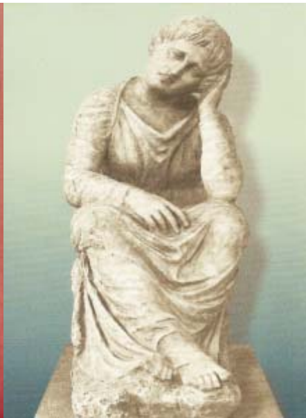
Άγαλμα θρηνωδού από μεγάλο επιτάφιο μνημείο στις Αχαρνές. Βερολίνο, Αρχαιολογικό Μουσείο Πέργαμου.