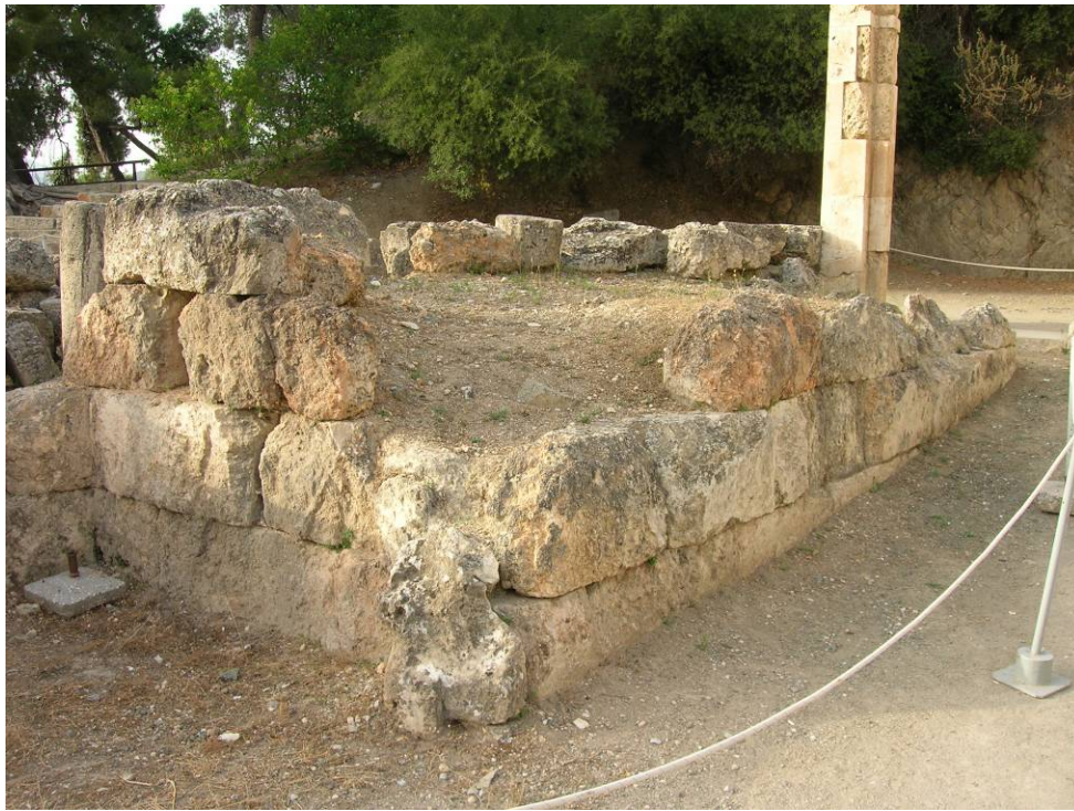
Τα ερείπια (με το ιδιαίτερος ευπαθές υλικό) της ανατολικής αναβάθρας του προσκηνίου.