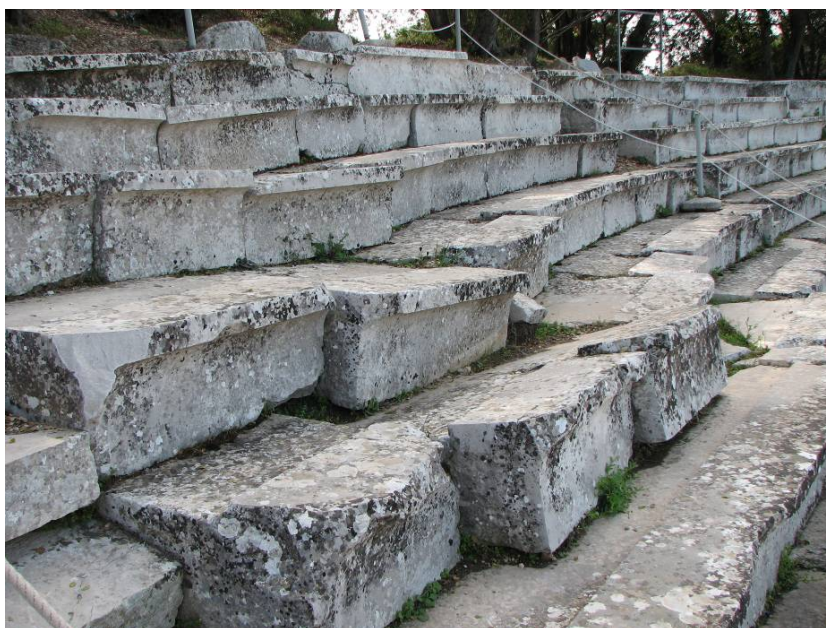
Διαταραγμένα εδώλια στο επιθέατρο.