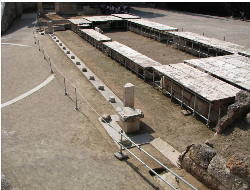
Το προσκήνιο του θεάτρου και τα κατάλοιπα της σκηνής με την ξύλινη προστατευτική κάλυψη.