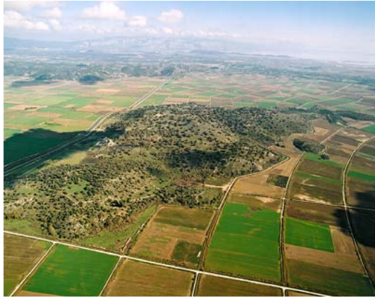
Αεροφωτογραφία του λόφου Τρίκαρδου, όπου αναπτύσσεται η αρχαία πόλη των Οινιαδών