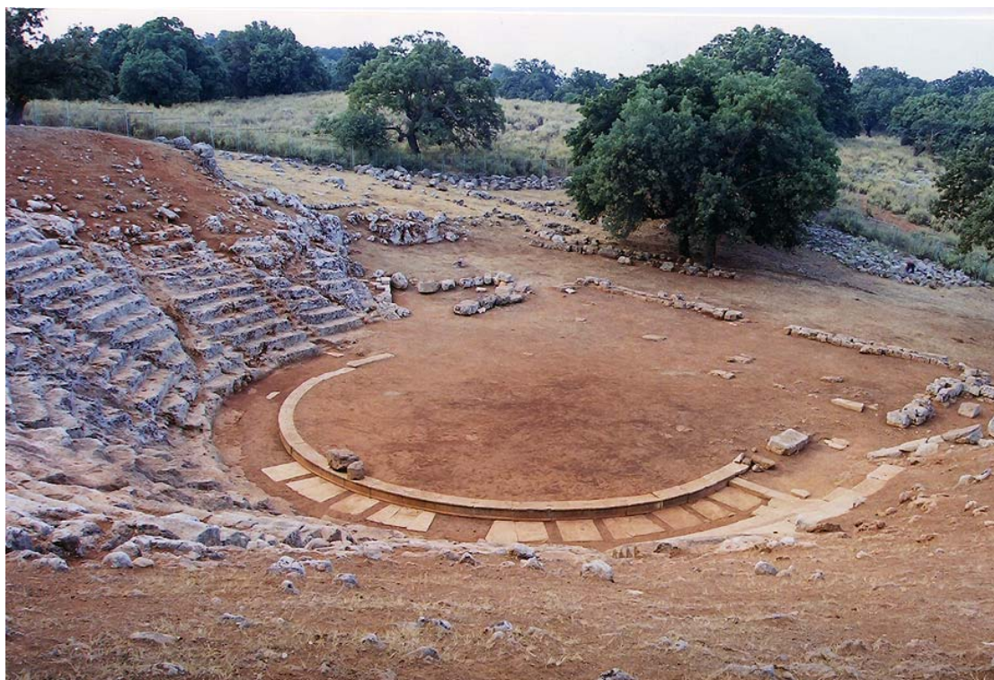
Αποψη της ορχήστρας του θεάτρου των Ονιαδών