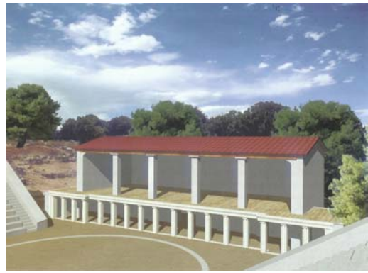
Γραφικές αναπαραστάσεις των οικοδομικών φάσεων I και II του σκηνικού οικοδομήματος του θεάτρου των Οινιαδών από τον καθηγητή Σάββα Γώγο