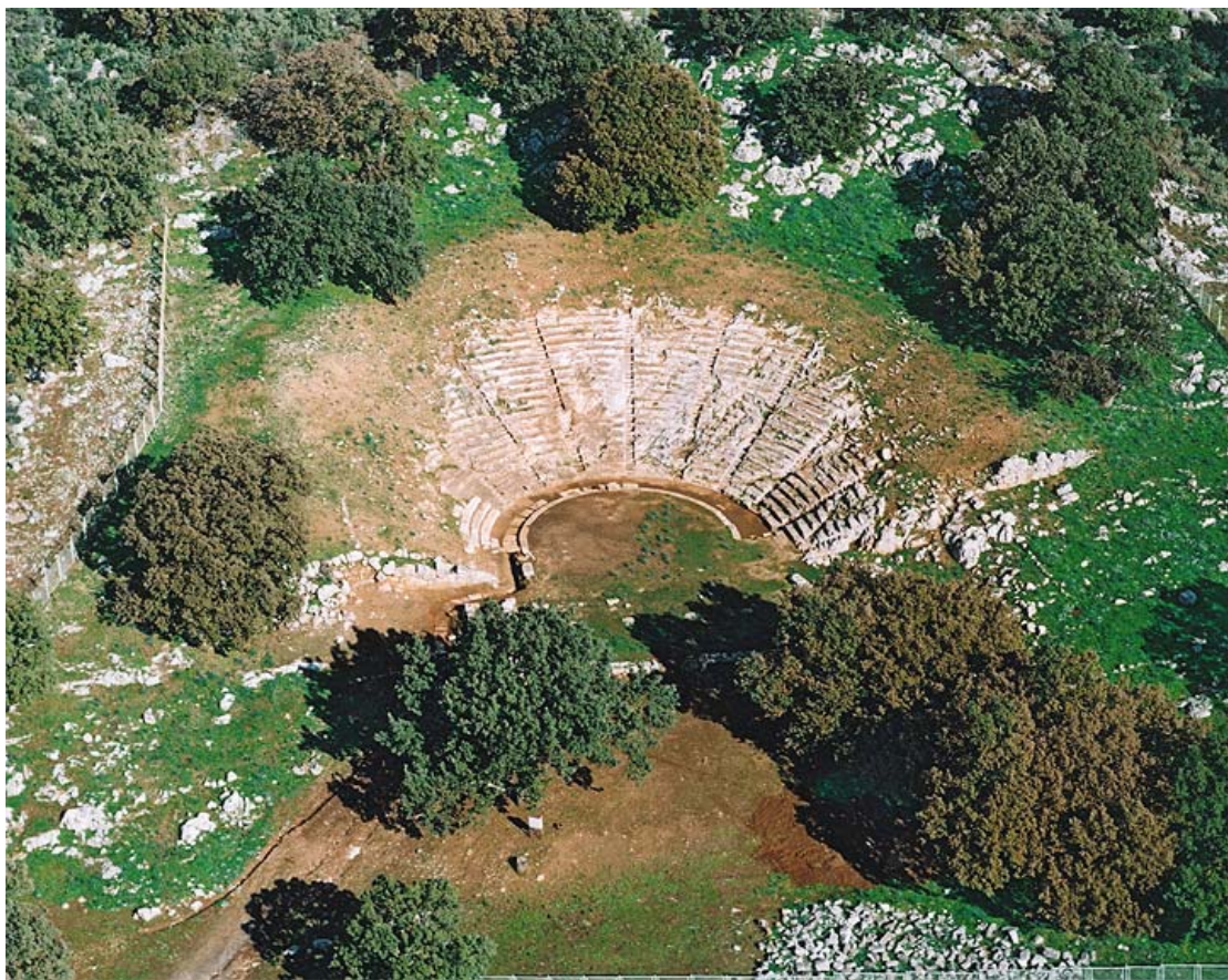
Αεροφωτογραφία του θεάτρου των Οινιαδών