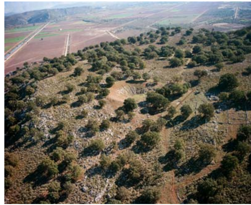
Λεπτομέρεια του λόφου Τρίκαρδου, στην οποία διακρίνεται το θέατρο των Οινιαδών