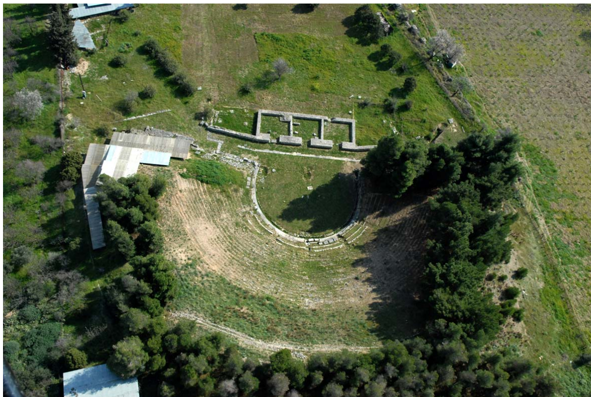
Εικ. 1: αεροφωτογραφία του θεάτρου Δημητριάδος

Ξεκίνησε ήδη το έργο «Αναστήλωση και αποκατάσταση τμημάτων του αρχαίου θεάτρου Δημητριάδος και συνολική βελτίωση του μνημείου και του περιβάλλοντος χώρου του», το οποίο χρηματοδοτείται από το Ε.Σ.Π.Α. 2007-2013 - Επιχειρησιακό Πρόγραμμα Θεσσαλίας - Στερεάς Ελλάδος – Ηπείρου, με το ποσόν των 750.000 Ευρώ.