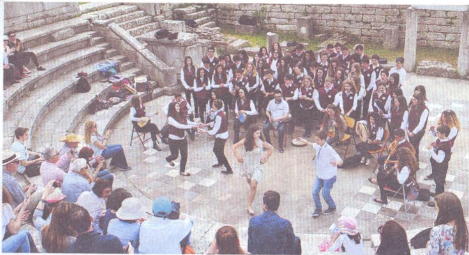
Τα παιδιά ξηναγούν τα παιδιά στα αρχαία θέατρα και... χορεύουν. Στη φωτογραφία οι μαθητές του Μουσικού Σχολείου Καλαμάτας.

Τα δύο υποέργα που εντάχθηκαν στο ΕΣΠΑ αφορούν την αναστήλωση του αρχαίου θεάτρου στα Γίτανα (προϋπολογισμού 1,2 εκατ. ευρώ) και την ανάδειξη του περιβάλλοντος χώρου του αρχαίου θεάτρου της Δωδώνης (900.000 ευρώ). Στη πολιτιστική διαδρομή (συνολικού προϋπολογισμού 37 εκατ. ευρώ) περιλαμβάνονται τέσσερις περιφερειακές ενότητες και πέντε αρχαιολογικοί χώροι (Δωδώνη,