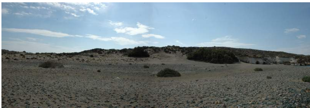
Το θέατρο όπως φαίνεται από την παραλία.

50εκ. το οποίο είχε σκοπό να καλύψει τις ανωμαλίες του φυσικού εδάφους και να διαμορφώσει την τελική στάθμη του υποστρώματος για το τελικό δάπεδο. Η είσοδος στο θέατρο γινόταν από δύο πλάγιες θολωτές παρόδους, από τις οποίες σώζονται μόνο οι αρχές των αναληματικών τοίχων του κοίλου. Η ανατολική πάροδος οδηγεί στον οικισμό, ενώ εκατέρωθεν της οδού έχουν έρθει στο φως μεγάλες οικίες πλουσίων. Τα ανασκαφικά ευρήματα από τις οικίες του οικισμού δείχνουν ότι πρόκειται για οικισμό ψαράδων, με κύρια ασχολία την επεξεργασία πορφύρας.