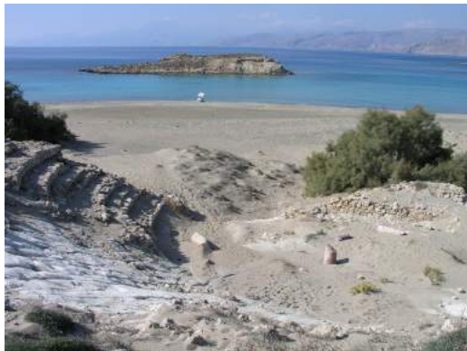
Το ρωμαϊκό θέατρο Λεύκης κρυμμένο κάτω από αμμοθίνες.

δώδεκα σειρές εδωλίων και σχήμα σχεδόν ημικυκλικό με μήκος μέγιστης χορδής 34μ. Οι σειρές των εδωλίων είναι ορατές στο σύνολο τους μόνο στο δυτικό τμήμα ενώ στο ανατολικό τμήμα σώζονται μόνο οι έξι σειρές από την 4η μέχρι και την 8η. Στις θέσεις των υπολοίπων σειρών διατηρείται η λάξευση του φυσικού βράχου για τη διαμόρφωση της λιθόκτιστης κατασκευής των εδωλίων. Το κεντρικό τμήμα του κοίλου είναι πλήρως κατεστραμμένο και δεν διακρίνεται κανένα ίχνος λάξευσης πάνω στο μαργαϊκό σχηματισμό. Από τους πλάγιους αναλημματικούς τοίχους του κοίλου προς την πλευρά των θολωτών παρόδων, σώζονται μόνο τα χαμηλά προς την ορχήστρα τμήματα.