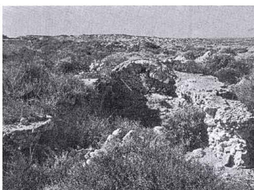
Αρχαιότητες, κτιστός αγωγός και κινστέρνα όπως δημοσιεύθηκαν το 1972 από τον αρχαιολόγο αΑ. Leonard Jr

A. Leonard Jr, ο οποίος παρατηρεί και καταγράφει τις επιφανειακές αρχαιότητες. Όπως ο ίδιος αναφέρει το 1972 όταν δημοσιεύει τις παρατηρήσεις του, στη πρώτη του επίσκεψη το 1967 ήταν δυνατή η παρατήρηση και φωτογράφιση των αρχαιοτήτων που είχε δει και ο T.B. Spratt. Το 1971 όμως όταν επισκέπτεται ξανά το νησί το βρίσκει πλήρως αλλαγμένο από τις αμμοκαλύψεις.