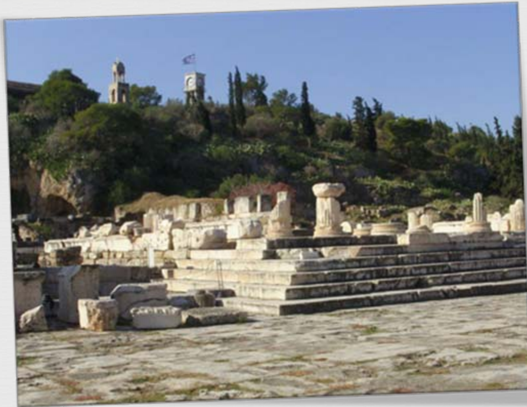
Αρχαιολογικός Χώρος Ελευσίνας