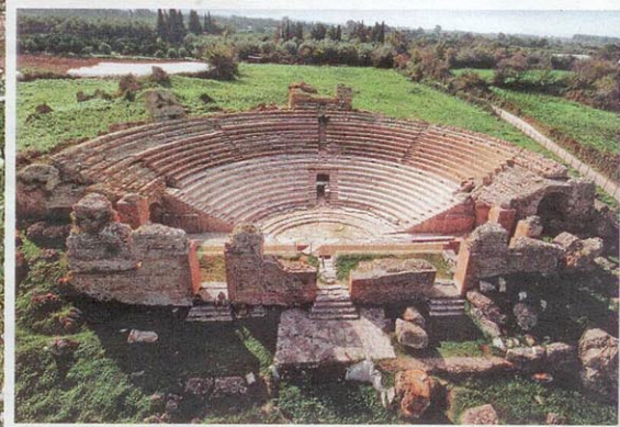
1 | 2 1. Είσοδος στην αρχαία Κασσώπη, χτισμένη στις πλαγιές του Ζαλόγγου. 2. Το Ωδείο της Νικόπολης ήταν στεγασμένο και φιλοξενούσε μουσικές και θεατρικές εκδηλώσεις, απαγγελίες ποιητών, ομιλίες και συζητήσεις ρητόρων.

Όπως εύστοχα παρατηρεί η συνταξιδιώτισσα Φανή Σπυρούλη, «το ωραίο σε αυτό το ταξίδι είναι ο τρόπος που νιώθεις τη ροή της ιστορίας. Μέσα από περιήγηση και περιπάτους σε οργιωδη φύση, αποικιάς καλύτερη γνώση των διαφορετικών εποχών, της μεταξύ τους αλληλουχίας, της αλληλεπίδρασης πολιτισμών».