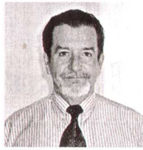
από τον Ευάγγελο Κουτίνο