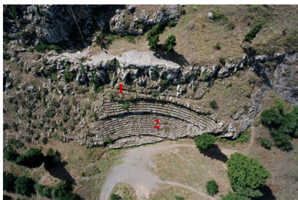
Αεροφωτογραφία του θεάτρου της Χαιρώνειας. Στο επάνω τμήμα του (1) είναι ακόμη εμφανή τα ευθύγραμμα εδώλια του αρχικού, πρώιμου θεατρικού χώρου. Αργότερα ο βράχος λαξεύτηκε βαθύτερα προκειμένου να δημιουργηθεί ημικυκλικό κοίλο (2).

Το θέατρο -σε μια ιδιαίτερα απλή μορφή- ήταν σε χρήση τουλάχιστον από τα τέλη 5 ου αι. π.Χ. Τα εδώλια (=καθίσματα) είχαν σκαλιστεί πάνω στον σκληρό, γκρίζο βράχο σε 8-10 ευθύγραμμες σειρές, μήκους 37 περίπου μ. και μπορούσαν να φιλοξενήσουν 500 περίπου θεατές. Σε αυτήν την φάση ο χώρος ίσως χρησιμοποιήθηκε γενικά για συναθροίσεις πολιτών και όχι μόνο για θεατρικές παραστάσεις. Με την ίδια μορφή το μνημείο εξακολούθησε να λειτουργεί όλον σχεδόν τον 4 ο αι. π.Χ.