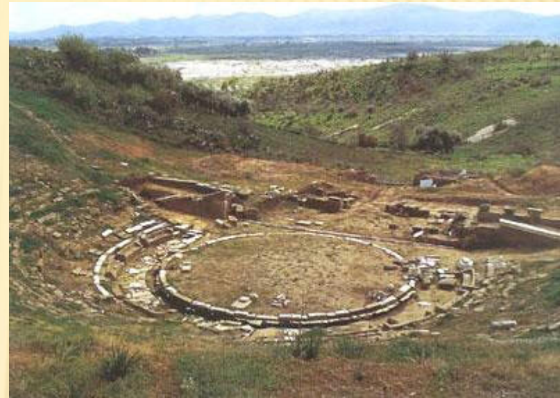
θέατρο των Οινιάδων