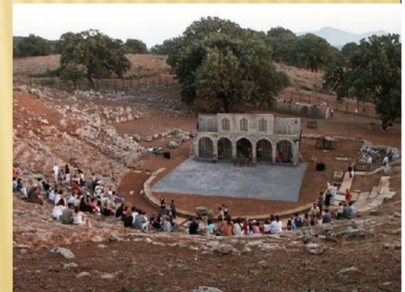
Θεατρικές παραστάσεις στο θέατρο των Οινιάδων