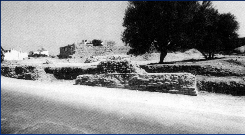
Πρόσοψη της σκηνής