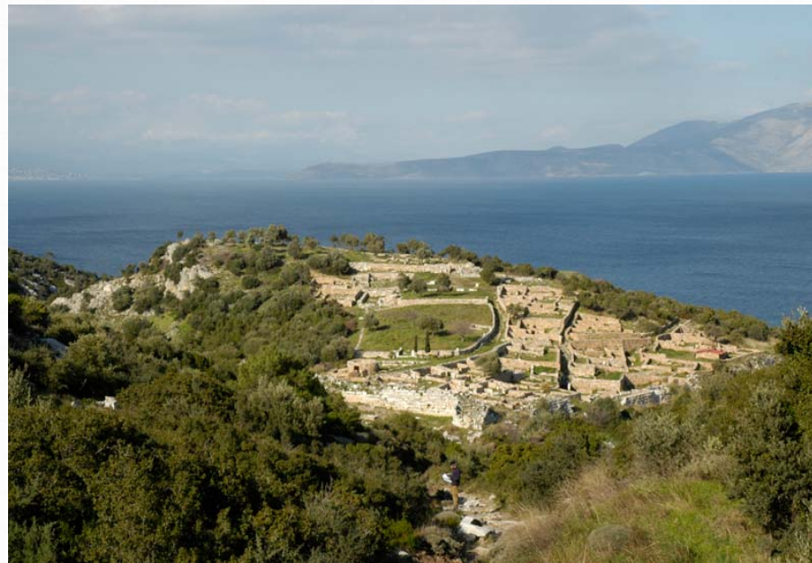
Ο αρχαιολογικός χώρος του Ραμνούντα