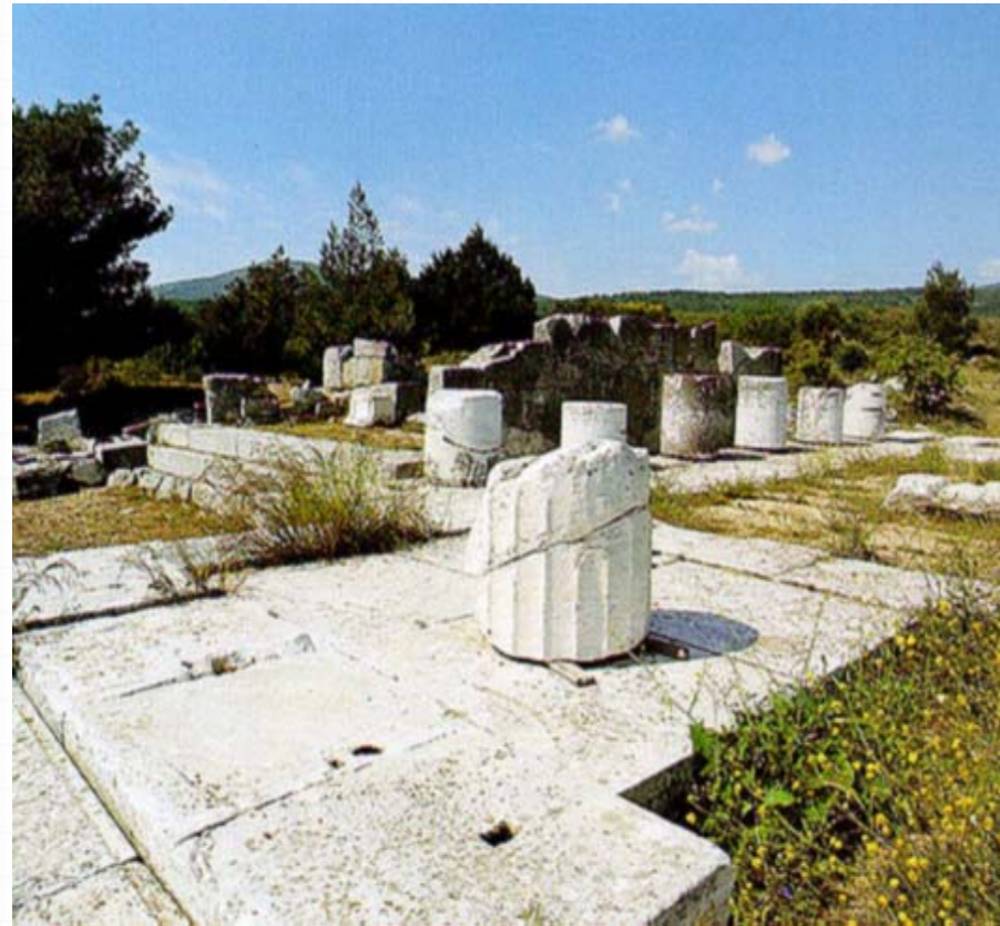
Ο μεγάλος ναός του Ιερού της Νεμέσεως