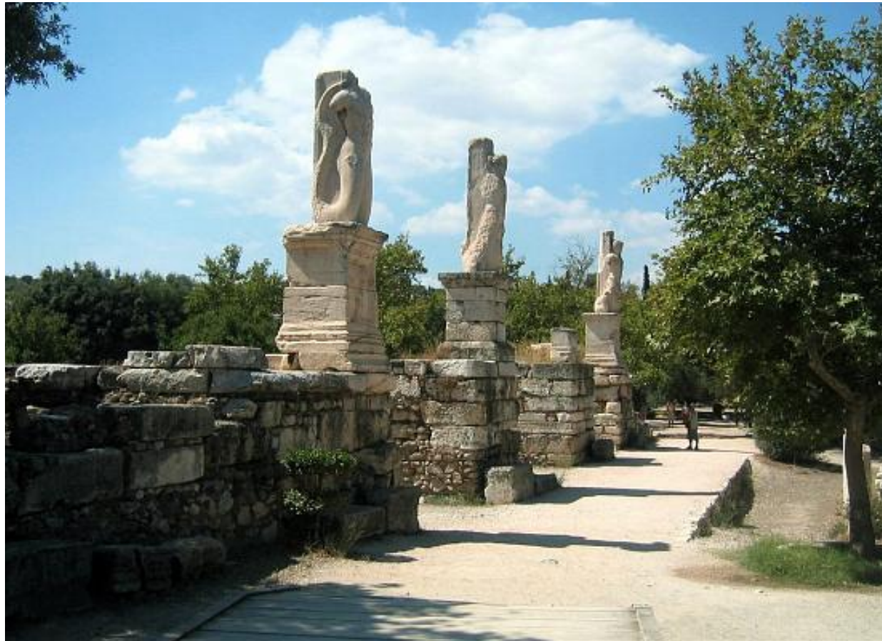
Το Ωδείο του Αγρίππα στη σημερινή εποχή

➤ Το κτήριο συνέδεσε το όνομά του με τον γαμπρό του Αυγούστου, Αγρίππα, που ήταν και ο κυριότερος συνεργάτης του, εξ ου και η άλλη ονομασία του «Αγρίππειον»