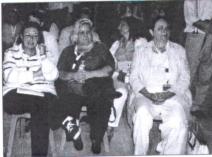
δέχτηκε τόσο κόσμο. Από εκεί ξεκίνησαν οι εκδηλώσεις της συνέλευσης

Κατ' αρχάς, το μικρό ή Β' Αρχαίο Θέατρο της πόλης, που μετά τις παραστάσεις αρχαίου δράματος του «Θεσσαλικού», αλλά και άλλων θεατρικών σχημάτων, πριν χρόνια, ξανα-