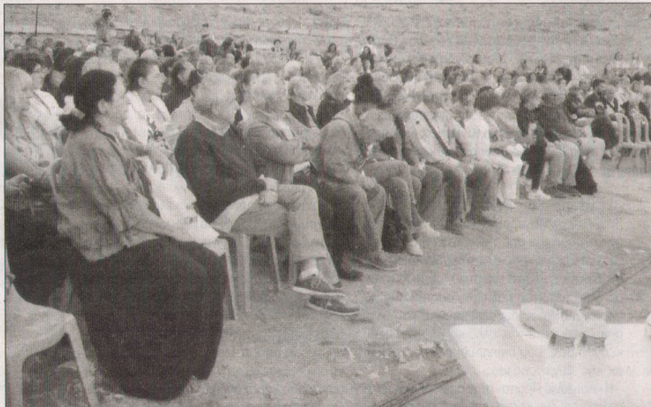
Πολλές προσωπικότητες χθες στο αρχαίο θέατρο Δημητριάδος