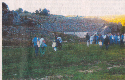
Το αρχαίο θέατρο της Διωδώνης. Από την περσινή συνέλευση του «Διαζώματος».