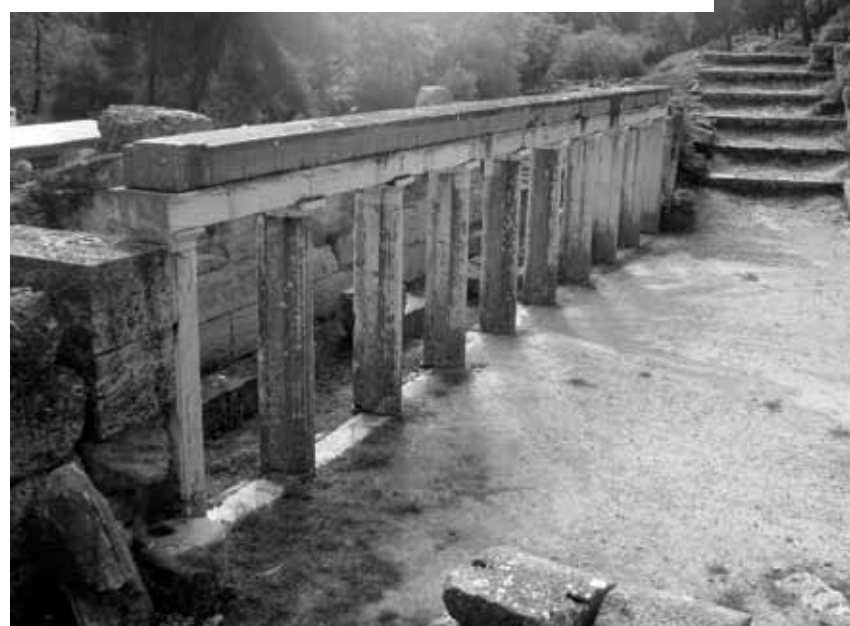
Αρχαίο θέατρο Δήλου Ancient Theatre of Delos