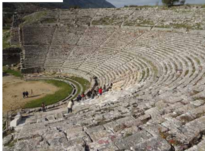
Αρχαίο θέατρο εντός του αρχαιολογικού χώρου του Αμφιαρείου στον Ωρωπό Ancient theatre at the Amphiareion archaeological site at Oropos