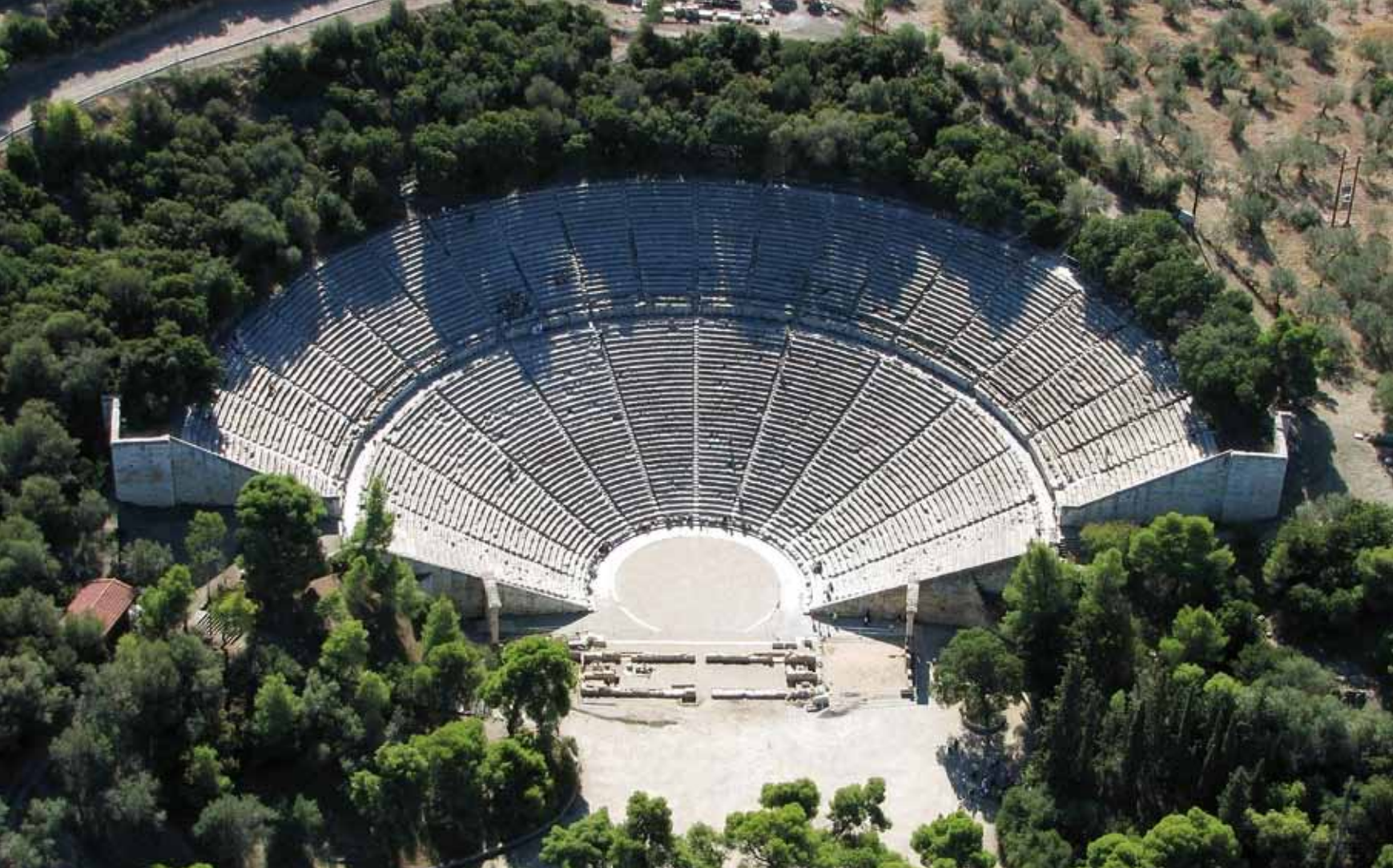
Αρχαίο Θέατρο Επιδαύρου | Ancient Theatre of Epidaurus