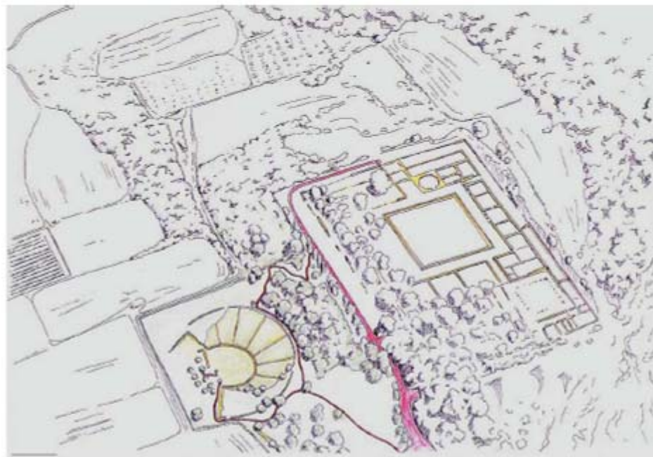
Σκίτσο. Πρόταση αποκατάστασης του θεάτρου και σύνδεσης με το ανάκτορο.

Η μορφή τους είναι συμβατή με το φυσικό περιβάλλον και η κωροθέτησή τους αξιοποιεί τα δέντρα της περιοχής, προκειμένου για την άνετη και ευχάριστη περιήγηση των επισκεπτών. Για την άρτια οργάνωση του περιβάλλοντα χώρου προτάθηκε η διαμόρφωση θέσεων στάσης, θέασης προς τον κάμπο καθώς και η ανάρτηση πινακίδων ενημέρωσης σε επιλεγμένα σημεία.