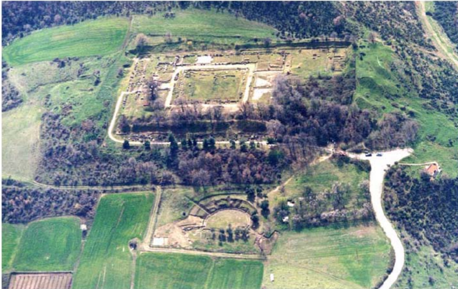
Άποψη του θεάτρου και του ανακτόρου.