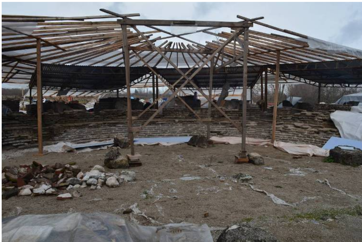
Εικ. 8: Αρμολόγηση στις σωζόμενες βαθμίδες του κοίλου, άποψη από νότια.