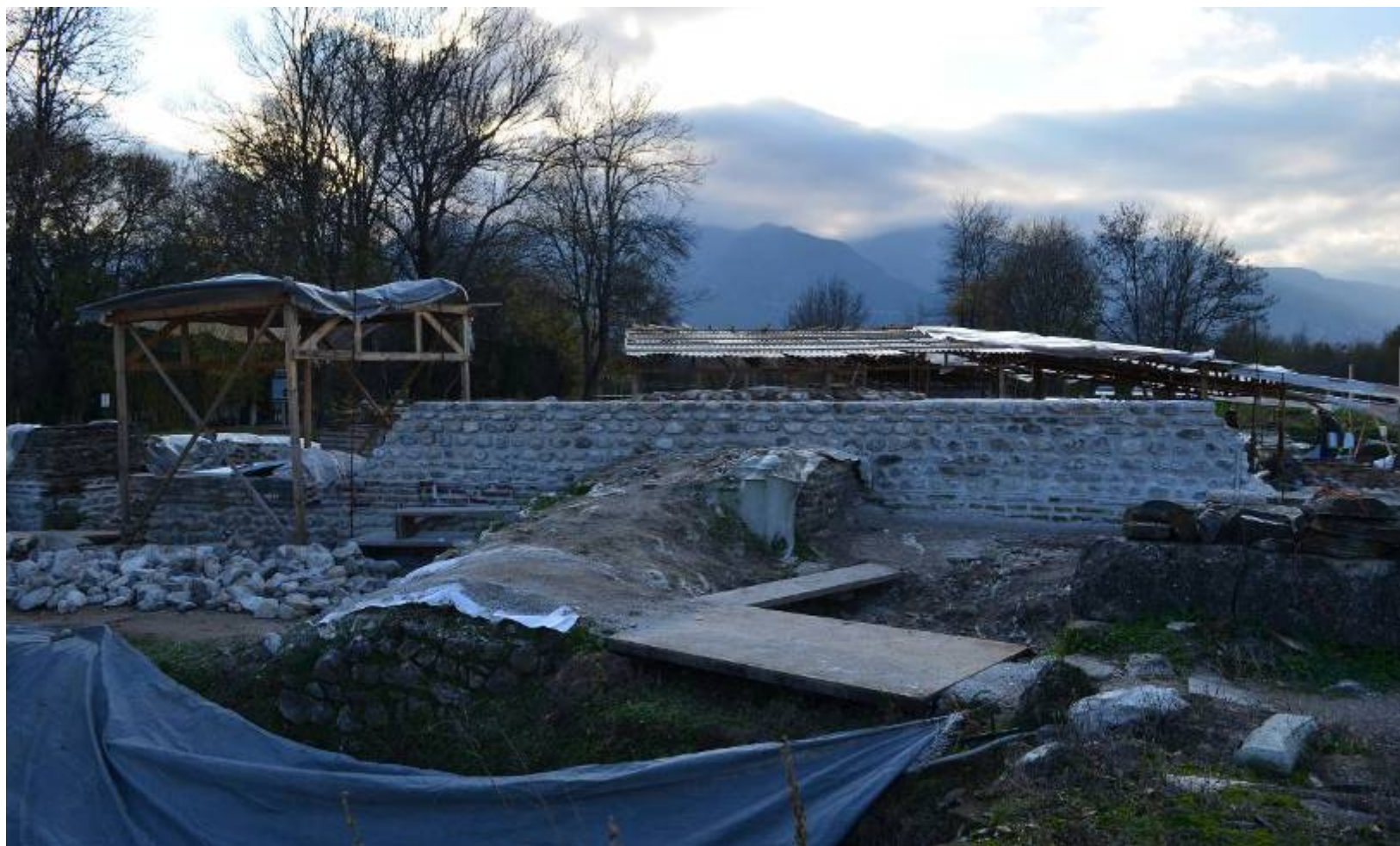
Εικ. 10: Αρμολόγηση και ανάκτηση πλινθοδομής και λιθοδομής στον Ανατολικό τοίχο.