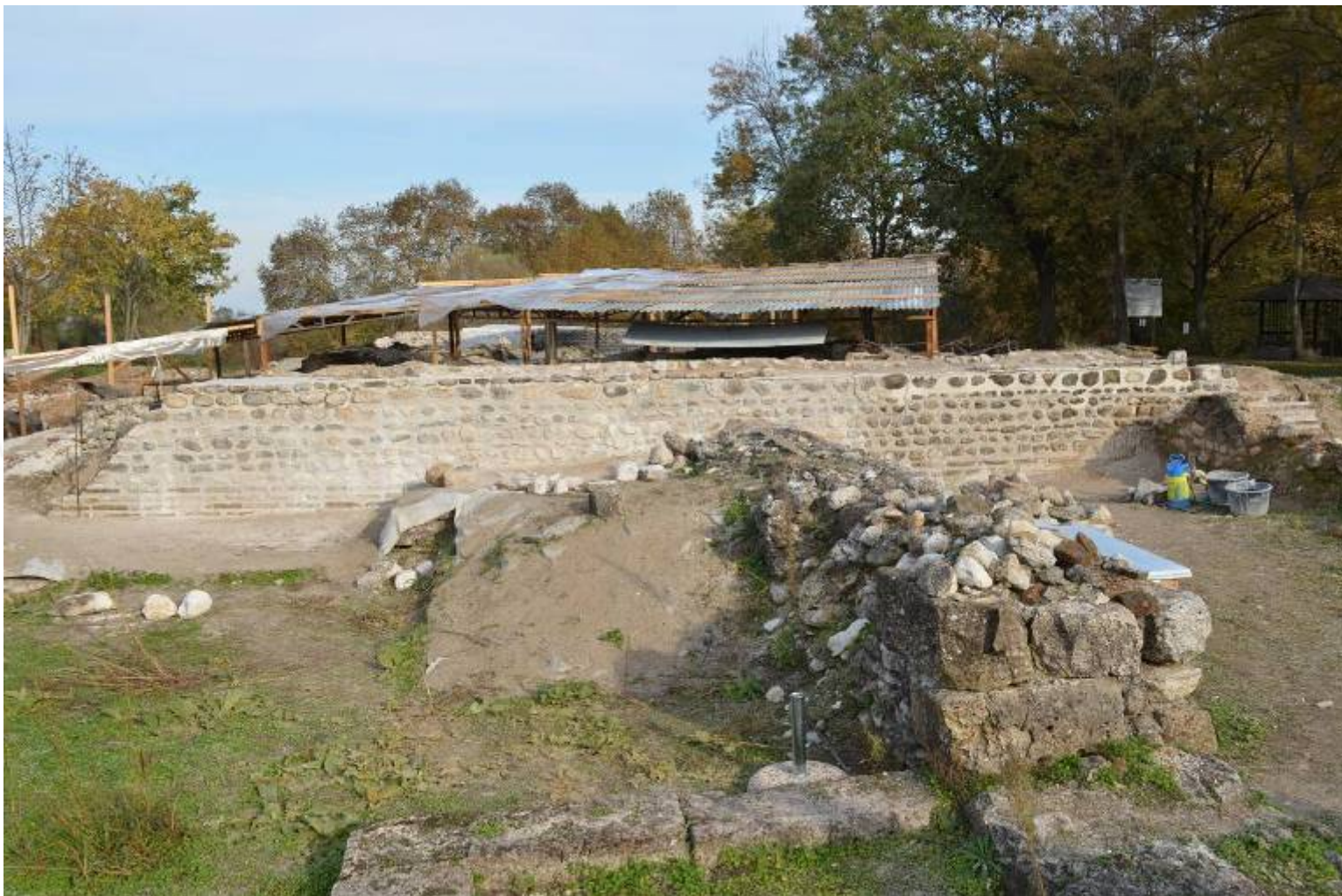
Εικ. 11: Αρμολόγηση και ανάκτηση πλινθοδομής και λιθοδομής στην Δυτικό τοίχο.