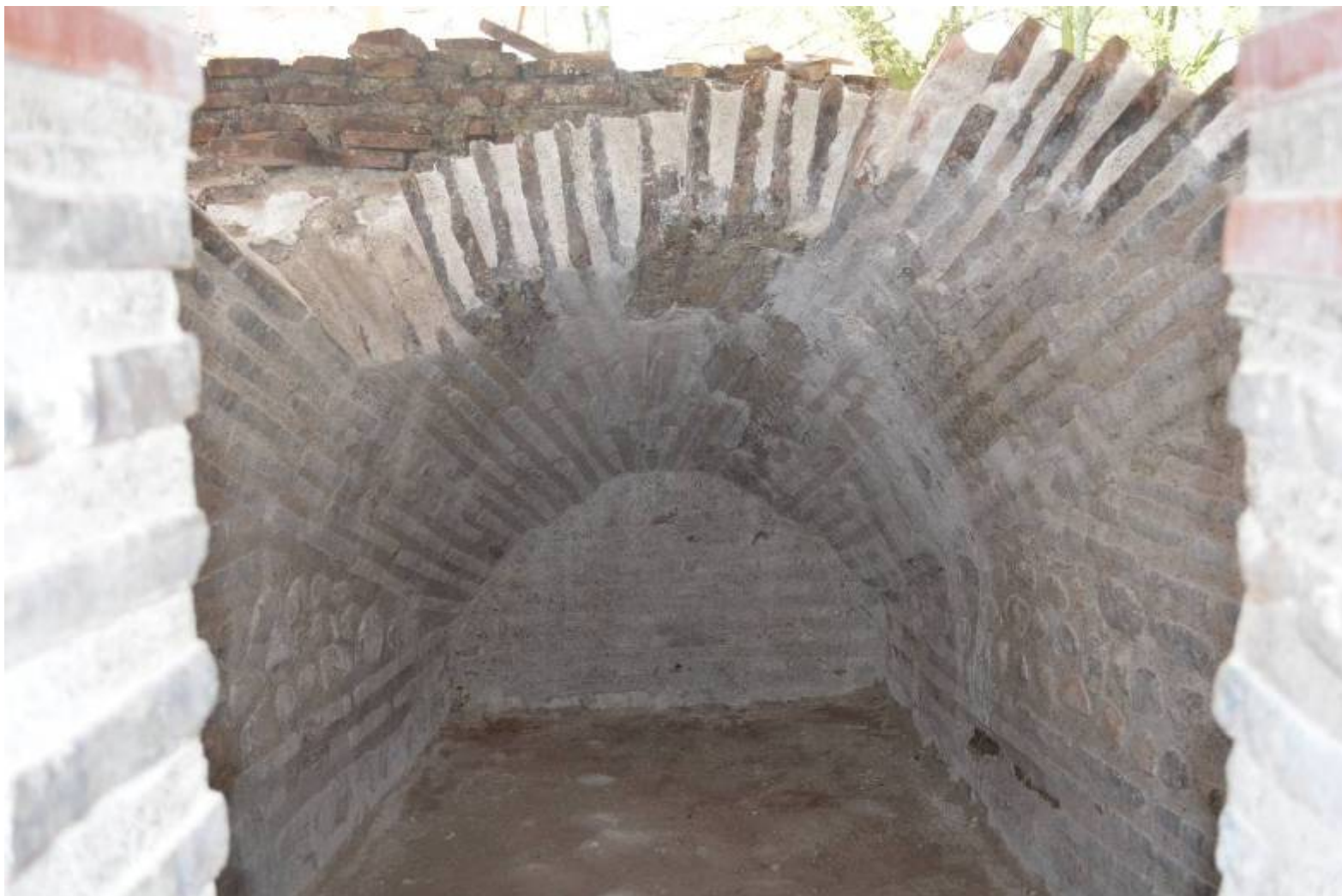
Εικ. 9: Αρμολόγηση στο εσωτερικό της σφηνοειδούς καμάρας του δωματίου 2, άποψη από την είσοδο του δωματίου.