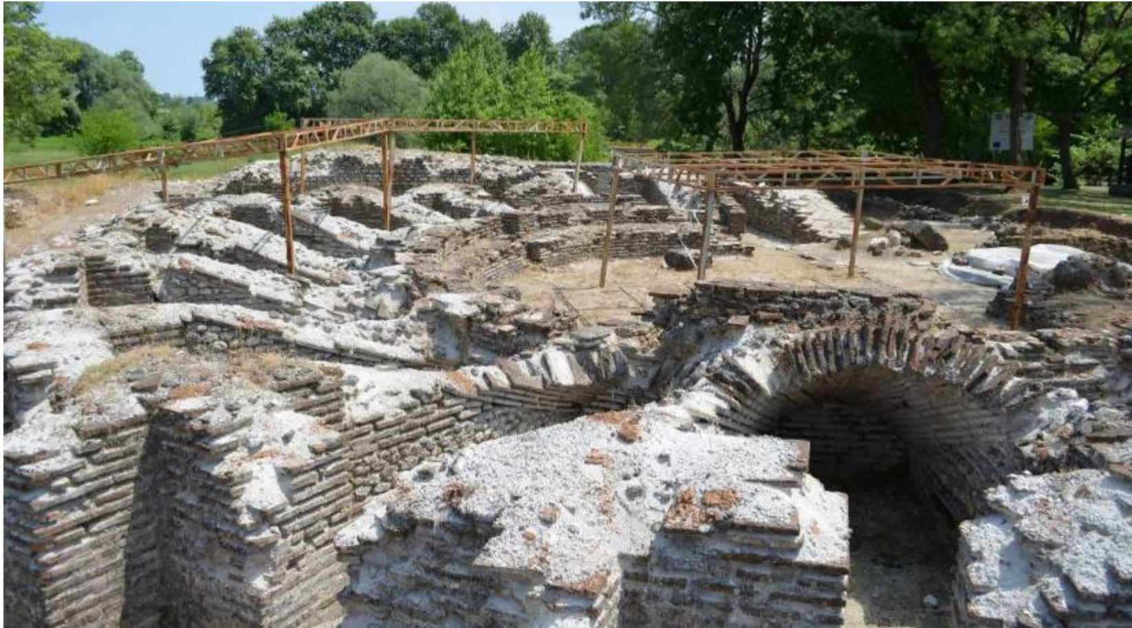
Εικ. 2: Άποψη του Ωδείου από δυτικά πριν την έναρξη των εργασιών.