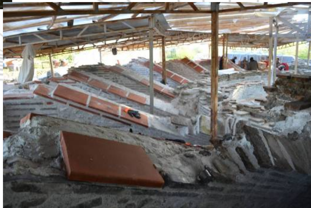
Εικ. 5: Ανάκτηση 1 ης και 2 ης σειράς σενάζ σφηνοειδών καμάρων των δωματίων, άποψη από δυτικά (η λήψη έγινε από το δωμάτιο 2).