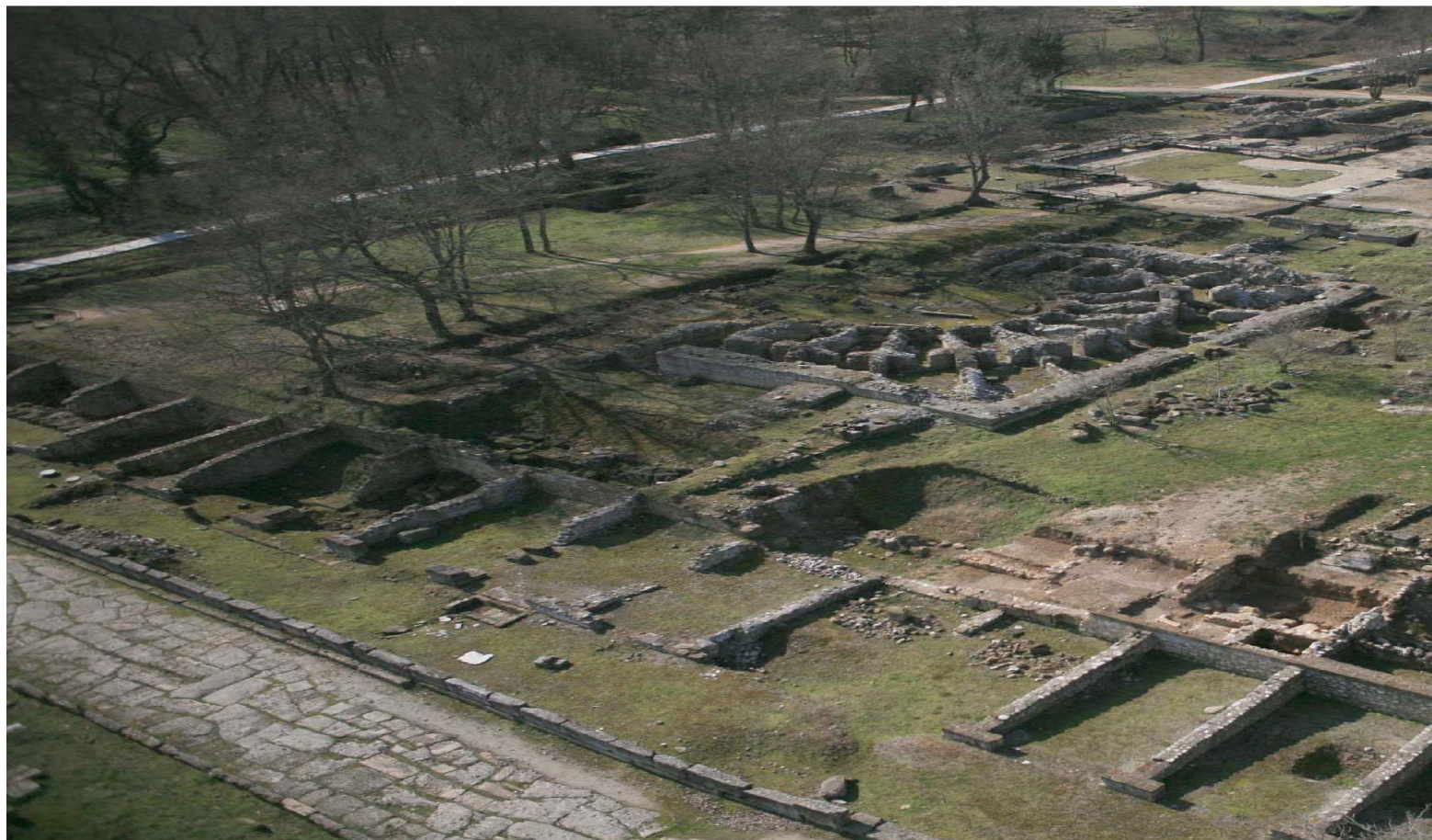
Εικ. 1: Το Ωδείο των Μεγάλων Θερμών (αεροφωτογραφία από ΒΑ). Το μνημείο βρίσκεται στα δυτικά των καταστημάτων και του κεντρικού δρόμου.