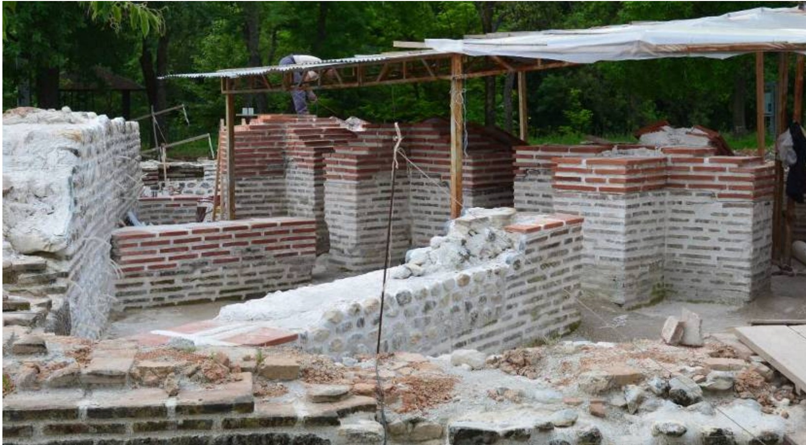
Εικ. 3: Αρμολόγηση, συμπληρώσεις και ανάκτηση πλινθοδομής και λιθοδομής στην τοιχοποιία των Χώρων VIII - X, άποψη από βόρεια.