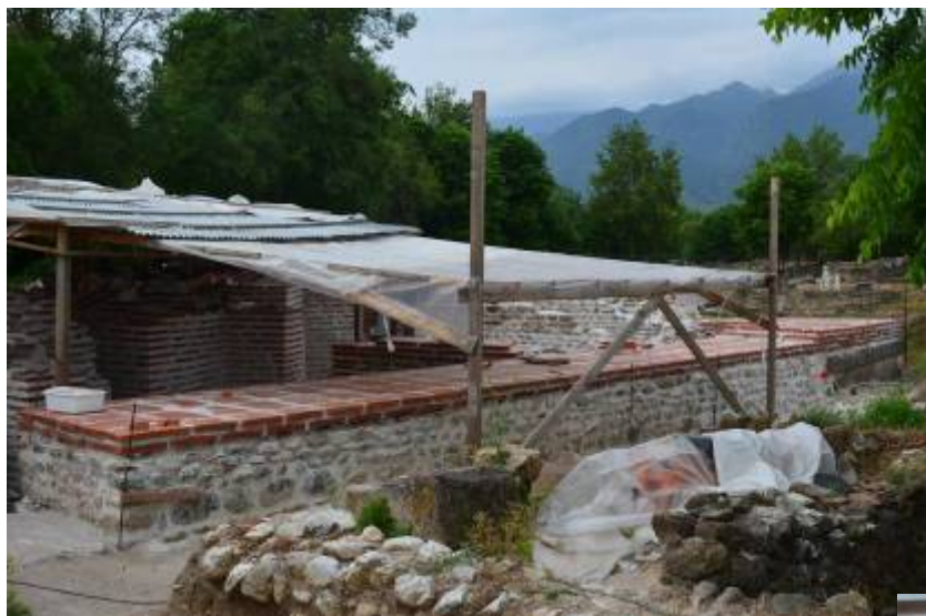
← Εικ. 4: Βόρειος τοίχος i: αρμολόγηση και ανάκτηση πλινθοδομής (σενάζ), άποψη από βόρεια.