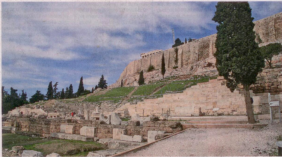
Το ποσό για τη μελέτη αποκατάστασης του θεάτρου Δελφών (δεξιά) συγκεντρώθηκε μέσω του «κουμπαρά» του «Διαζώματος», ενώ λογαριασμός έχει ανοίξει και για το θέατρο του Διονύσου (αριστερά).

Σημερινός στόχος ο αρχαιολογικός χώρος της Ελευσίνας