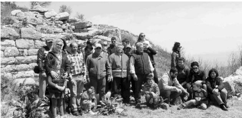
Εκδρομείς της Μακίστου στην κύρια πύλη του Αρχαίου Κάστρου, στην νότια πλευρά

Είναι μία μεγάλη ευκαιρία για τον τόπο μας, να στηρίξουμε όλοι αυτήν την προσπάθεια που θα αναδείξει την περιοχή μας. Η προσπάθεια τώρα ξεκινάει και θα πρέπει η στήριξη να είναι συνεχής. Η Μακιστία θα σας κρατάει ενημέρους για την εξέλιξη της υπόθεσης, που πρέπει να γίνει υπόθεση όλων μας.