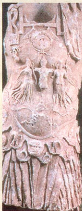
Αγάλμα του ρωμαίου αυτοκράτορα Τραϊανού, το οποίο ήρθε στο φως στο θέατρο της αρχαίας Μεσοίνης

Κατασκευασμένη από μέταλλο και ξύλο με τερματικές διαστάσεις (περίπου 5 μ. ύψος και περί τα 16 μ. μήκος) «ήταν σαν μια μεγάλη σκαλοτάπητα η οποία προς την πλευρά της ορχήστρας ήταν επενδυμένη με φύλλο ή και ύφανση ενώ από πάνω υπήρχαν κεραμίδια. Στην πρόθεση όλη άλλοτε υπήρχε η ζωγραφική απεικόνιση ενός μεγάλου οικοδομήματος. Επρόκειτο δηλαδή στην ουσία για τη σκηνική αναπαράσταση ανακτόρων μπροστά από το οποίο εδωλιούσαν η θεατρική πράξη» λέει ο κ. Θέμελης. Η κλητική σκηνή του θεάτρου της Μεσοίνης λειτουργούσε ως τον 1ο μ.Χ. αιώνα, όταν κατασκευάστηκε το πρώτο σταθερό σκηνικό οικο-