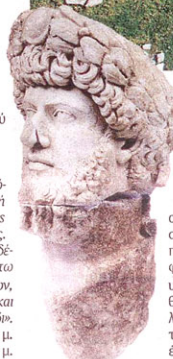
Κολοσσίο μαρμάρينو κεφάλι του Λούκιου Βέρου, συναυτοκράτορα του Μάρκου Αυρηλίου

έγινε από το αρχαίο λατομείο της Μεσοίνης.