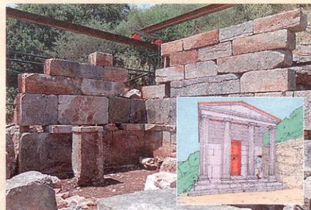
Αρχιτεκτονικά κατάλοιπα του μικρού ιερού της Ειλειθίας στην πλαγιά της Ιθώμης και (ένθετο) το σχέδιο της αποκατάστασής του

κε να τον εγκαταλείψει η Ρέα, αυτοί τον έφεραν στην Ιθώμη, όπου τον έλουσαν με νερό της Κλειψύδρας οι Νύμφες Ιθώμης και Νέδα και αναβίβαν στη συνέχεια την ανατροφή του.