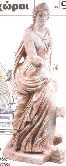
Το αρχαίο θέατρο της Μεσσήνης από ψηλά. Σε πρώτο πλάνο οικίες που κτίστηκαν μεταγενέστερα. Στην ένθετη φωτογραφία ο καθηγητής αρχαιολόγος κ. Πέτρος Θέμελης. Επάνω, σχεδιαστική μελέτη του θεάτρου για την αναστήλωσή του, με την αποτίμηση και των διάσπαρτων ειδωλίων του. Δεξιά, μαρμάρινο άγαλμα της Ιφιδας Πελαγίας που ανακαλύφθηκε κατά τις ανασκαφές στη σκηνή του θεάτρου

δόγημα, ενώ στην τρίτη και τελευταία αρχιτεκτονική φάση, όπως όλα τα θέατρα στον αυτοκρατορικό κόσμο, έτσι κι αυτό χρησιμοποιήθηκε και για μονομαχίες και «αιμαχίες» με τη σκηνή του να κατακλύζεται από νερό – αν και σε ύψος μερικώς εκατοστών. Για την προστασία των θεατών πάντως η σκηνή του θεάτρου περιβαλλόταν