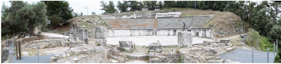
1. Άποψη του θεάτρου της Θάσου από νότια.