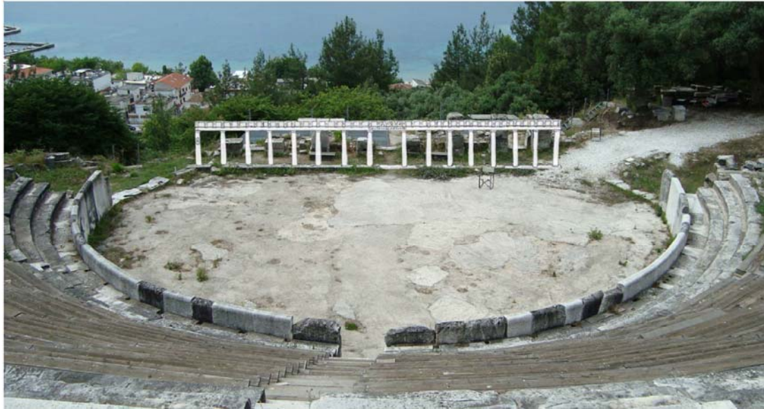
3. Σκίτσο - φωτογραφία. Πρόταση αναστήλωσης του ελληνιστικού λογείου.