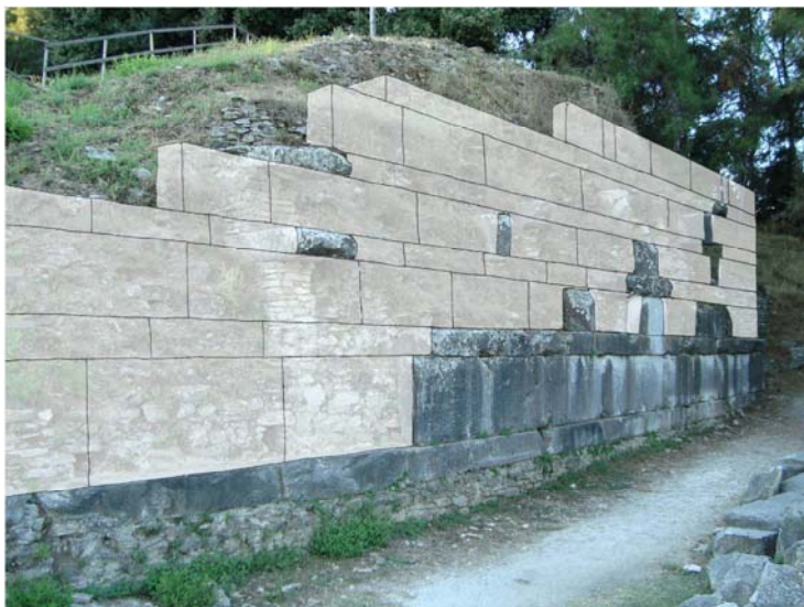
3. Σκίτσο αναστήλωσης δυτικής παρόδου

Πρόκειται για ισχυρούς αναλημματικούς τοίχους κατασκευασμένους στη ρωμαϊκή οικοδομική φάση του θεάτρου, για τη συγκράτηση των απολήξεων του κοίλου. Είναι δομημένοι εσωτερικά με ισχυρό αργολιθοδομικό τοίχο και συνδετικό υλικό ασβεστοκονίαμα και εξωτερική επένδυση με σειρές μαρμάρινων λιθόπλινθων. Το μέγιστο ύψος της δυτικής παρόδου είναι 6,50μ. ενώ της ανατολικής παρόδου είναι 4μ. το μήκος κάθε τοίχου είναι 25μ.