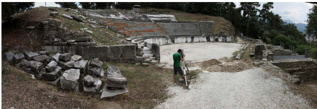
2. Άποψη του θεάτρου της Θάσου από ανατολικά.

Στην ύστερη ρωμαϊκή εποχή ανήκουν τα πρόχειρα εδώλια που σώζονται σήμερα στο κοίλο και η τελευταία μετασκευή του κτηρίου της σκηνής.