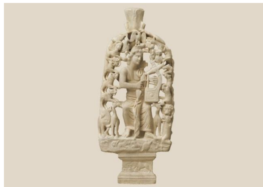
Μαρμάρινο αγαλμάτιο του Ορφέα να παίζει λύρα ανάμεσα σε ζώα. Αποτελεί αλληγορική παράσταση του Χριστού που προσελκύει πιστούς. Από την Αίγινα, 4 ος αι., ΒΧΜ

Η βυζαντινή τέχνη έχει επηρεάσει πολλούς νεότερους καλλιτέχνες όπως ο Τσαρούχης, ο Παρθένης, ο Εγγονόπουλος κ.ά. Συνεχίζει και στις μέρες μας να διαμορφώνει τις αισθητικές αντιλήψεις πολλών ανθρώπων, αφού είναι μια τέχνη που επιβιώνει στις εκκλησίες και στα χριστιανικά αντικείμενα. Πάντως, και σύγχρονοι καλλιτέχνες, όπως ο Στέλιος Φαϊτάκης, συνεχίζουν να αναζητούν στη βυζαντινή τέχνη τα εικαστικά εργαλεία τους για να εκφράσουν σημερινούς προβληματισμούς.