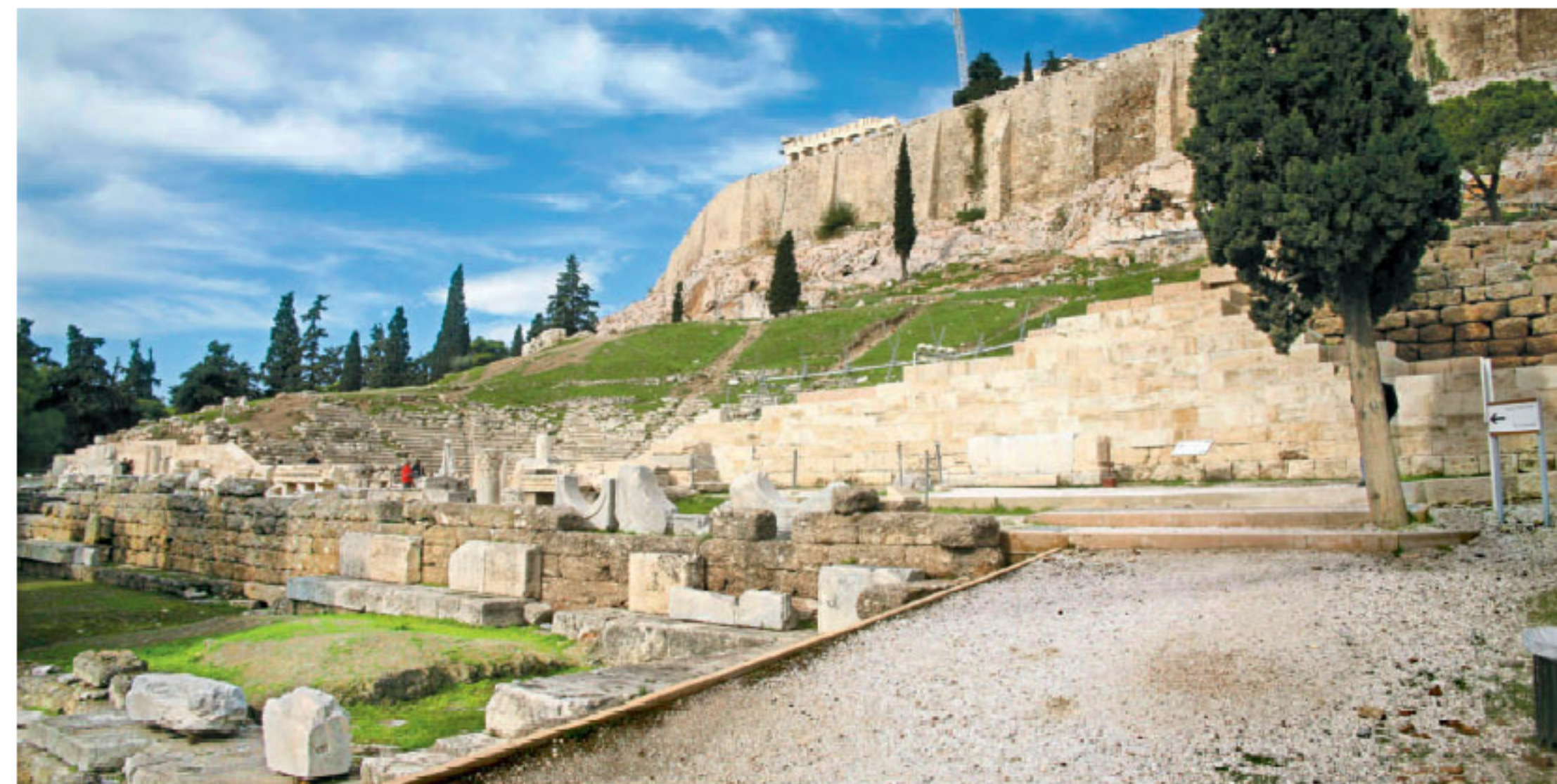
Επιστημονικές διαφωνίες έχει προκαλέσει η αναστήλωση του θεάτρου του Διονύσου. Κυρίως φόβο για πιθανή χρήση αν και οι μελετητές του μνημείου αρνούνται αυτό το ενδεχόμενο.