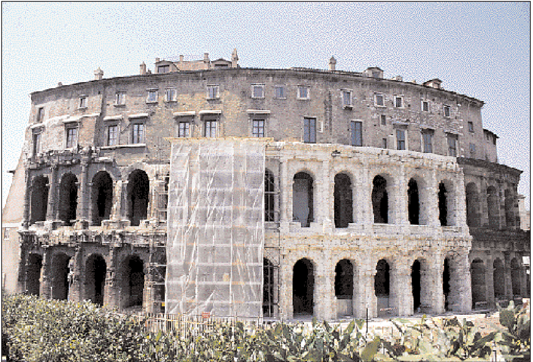
Το θέατρο του Μαρκέλλου στη Ρώμη με εμφανείς τις διαφορές μετά τους πρόσφατους καθαρισμούς της πρόσοψής του.