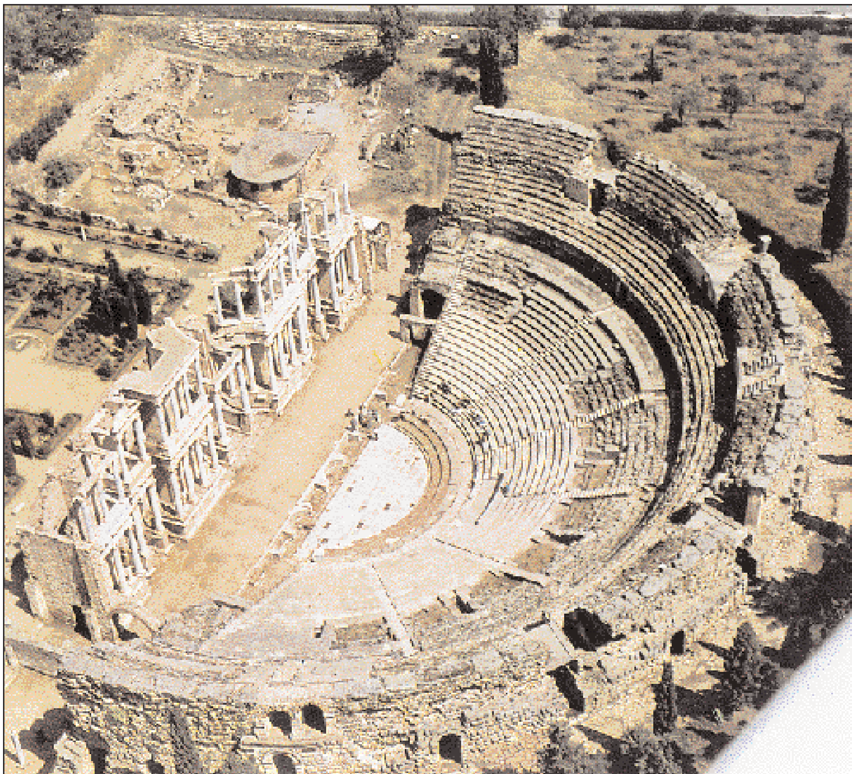
Το θέατρο της Μέριδα, στην Ισπανία, μετά την αναστήλωσή του.